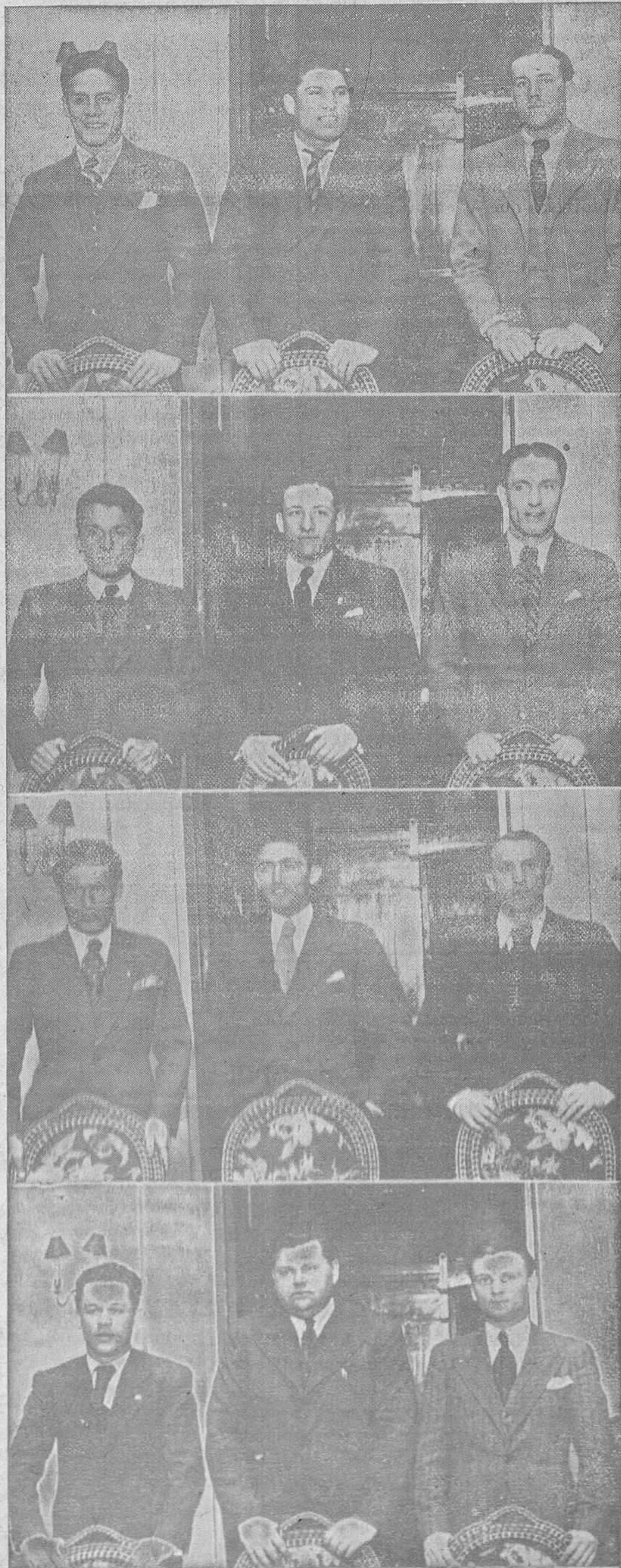
EL EQUIPO YUGOESLAVO. I.—Portero y defensas II.—Los medios. III.—Delantero centro e interiores. IV.—Entrenador y los dos extremos

donde mejor pasaría el día, seguro que, repetiría mañana domingo, al "PARK-OVETENSE" ALTO DE BUENAVISTA. Restaurant - Merendero. Lechería. Habitaciones para los que desean hacer vida de campo.