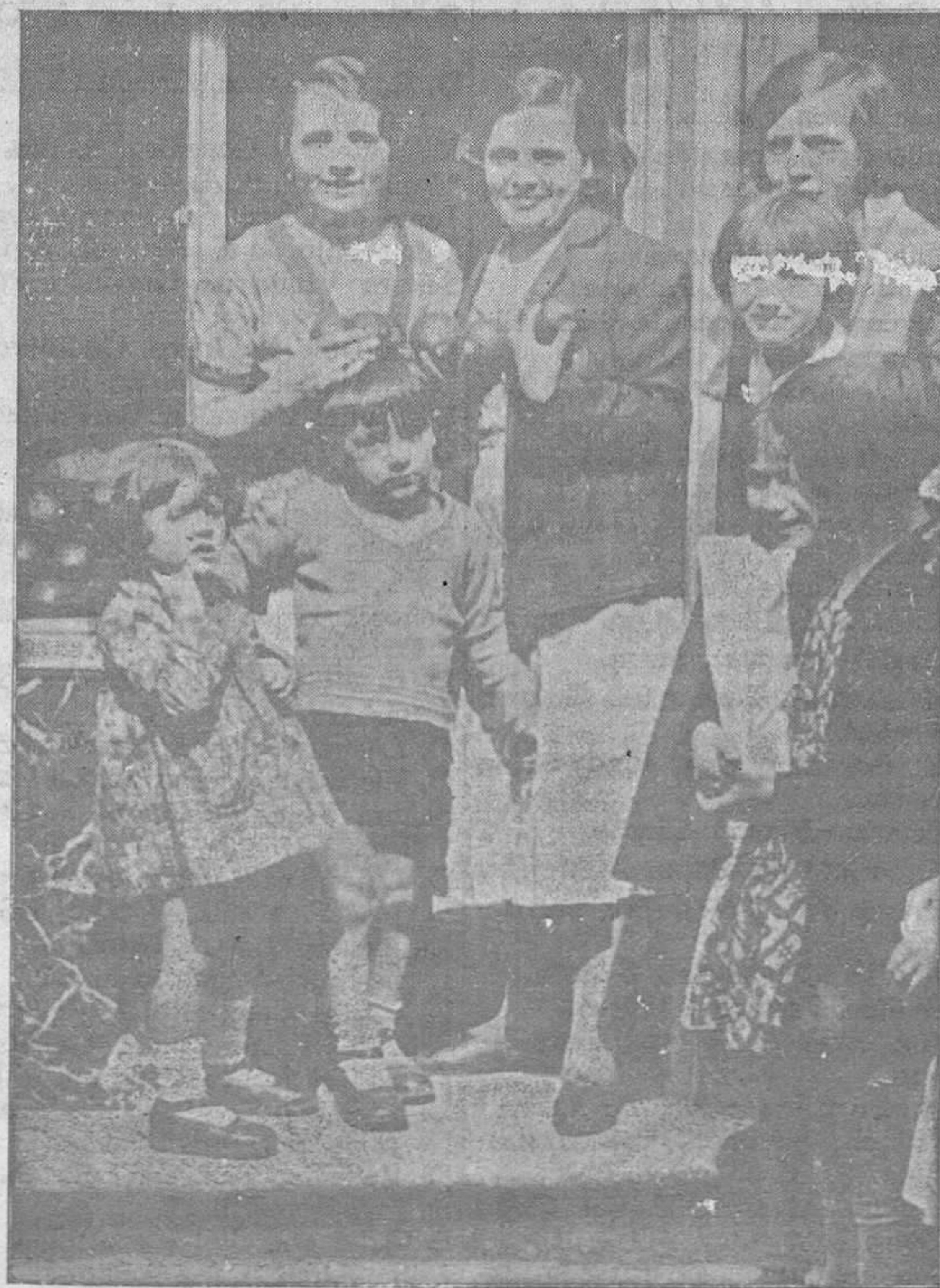
DEL ÚLTIMO SORTEO DE LA LOTERÍA NACIONAL.—Dos ovetensas afortunadas con una participación del segundo premio, y que muestran su natural satisfacción por tan espléndido regalo.

ANUNCIOS ECONÓMICOS. LE INTERESA SÍMPRE LEER LA SECCIÓN DE