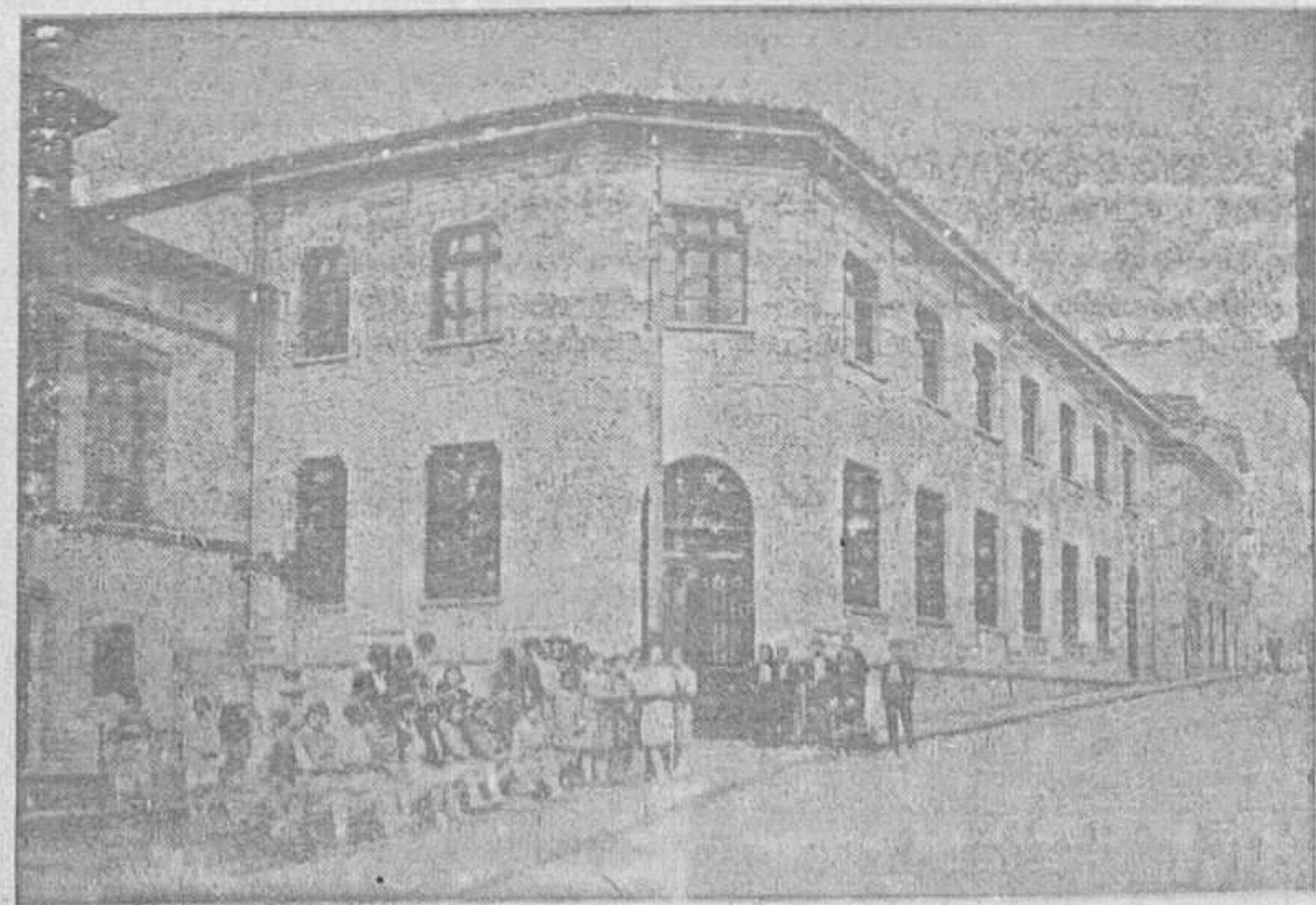
GRADO.—Fachada de la Gran Fábrica de Zapatillas «La Moscona»