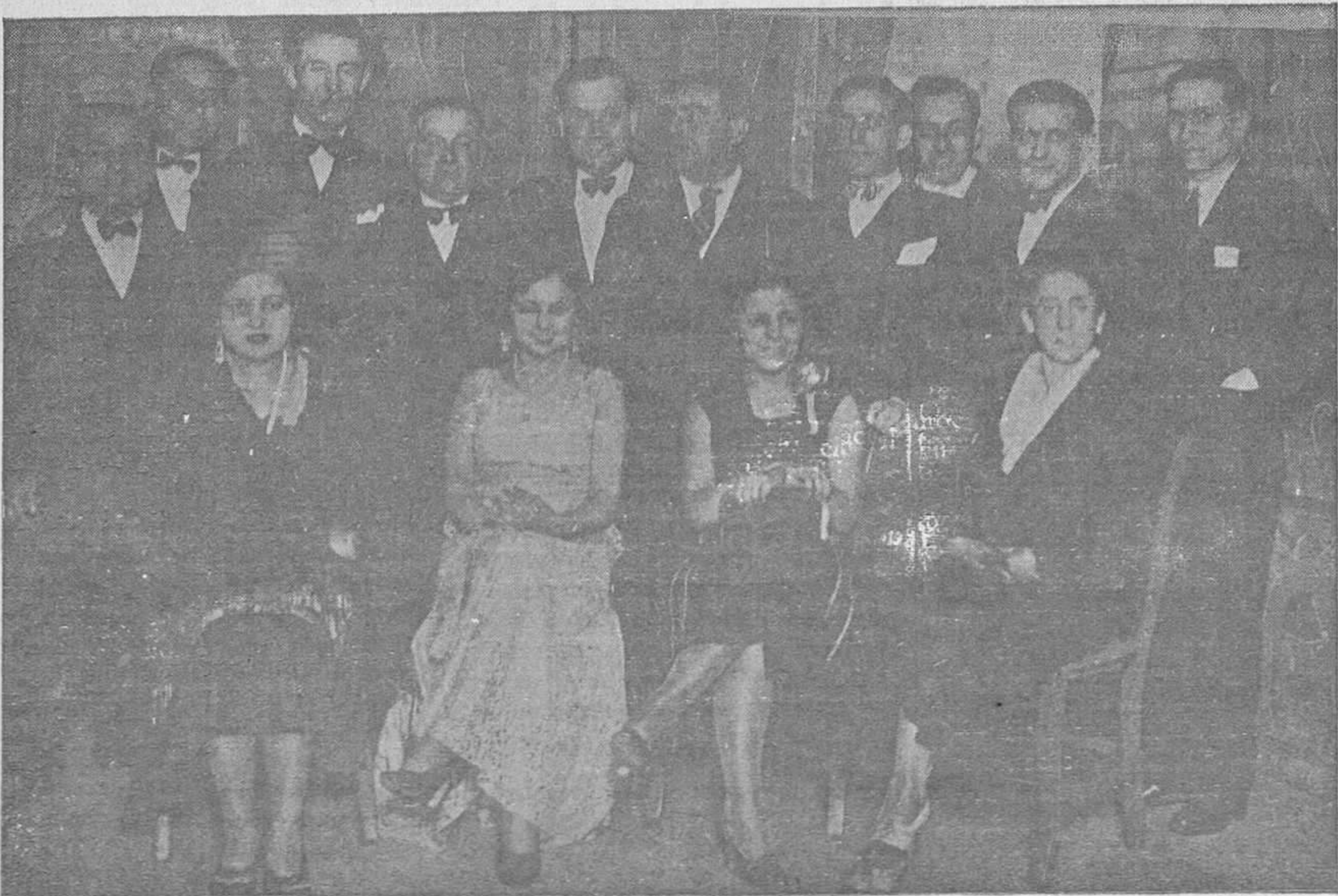
DE LOS CONCIERTOS EN EL TEATRO JOVELLANOS.—La encantadora «Miss Asturias» con los elementos artísticos que tomaron parte en las funciones dadas el pasado viernes en éste lindo teatro y en las que obtuvo un señalado triunfo el «Quinteto Musical Ovetense», organizador a la vez de las mismas.

Señalan varios medios para poder llevar a cabo las obras, señalando, entre otras cosas, que el actual contratista no tendría inconveniente en ejecutarlas a largo plazo, evitándose así un nuevo empréstito con todos sus gravámenes. Esta instancia pasó a la Comisión de Policía Urbana.