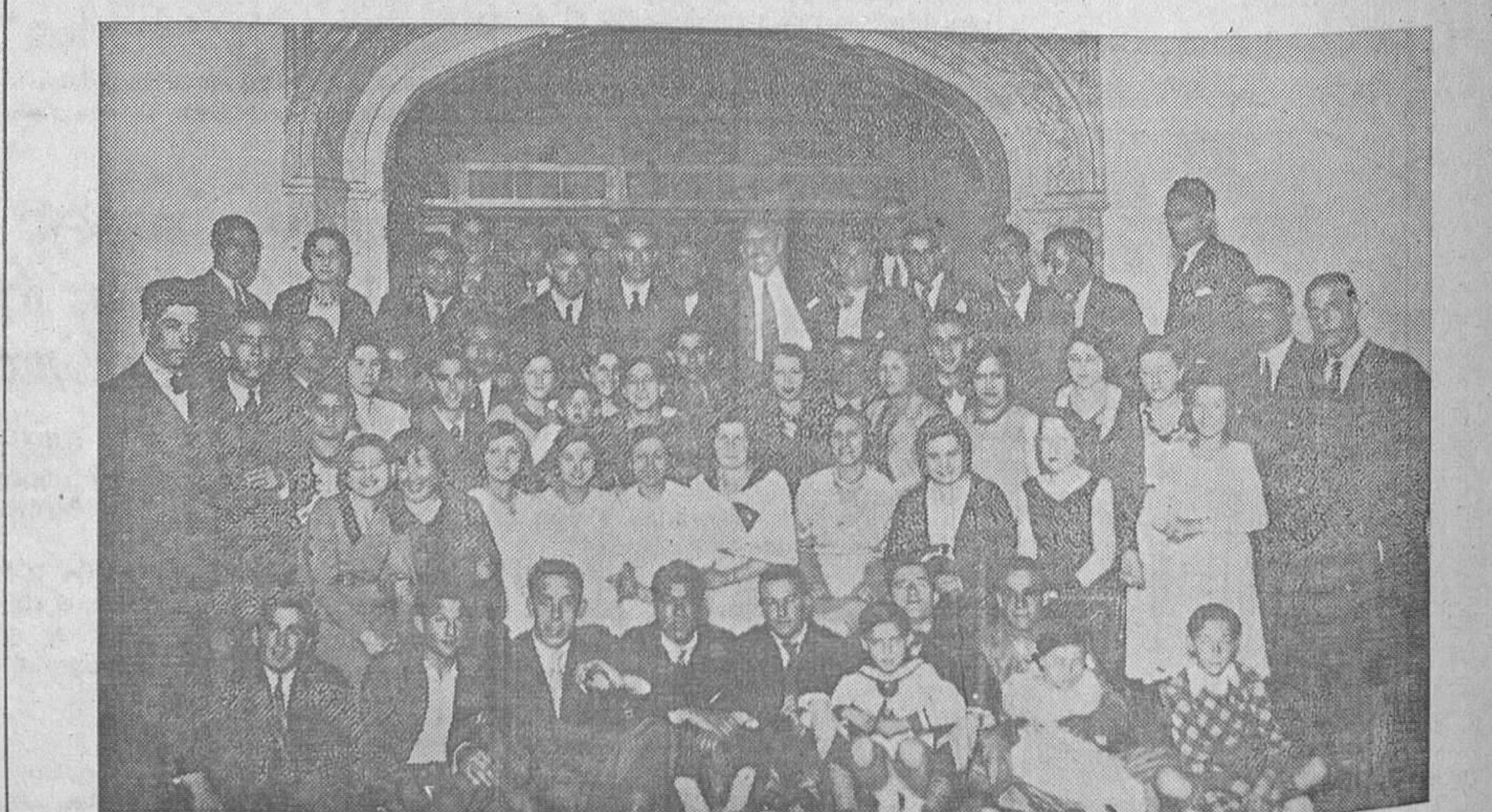
EN EL CIRCULO FERROVIARIO.—Grupo de señoritas y socios que asistieron a la fiesta celebrada en la noche de anteayer en el domicilio social de los empleados y obreros del carril.