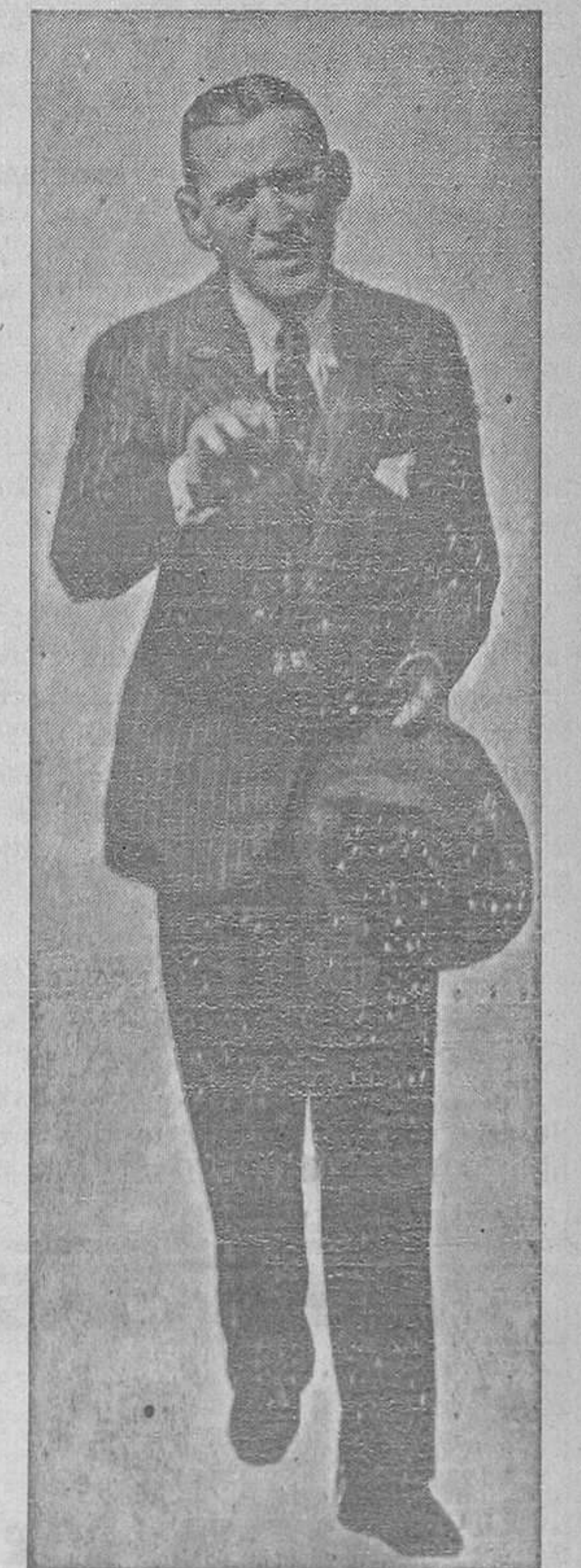
Adelantaba el ilustre crítico de hoy hacia el monumento del ilustre crítico de ayer, cuando el reporter le hizo esta silueta