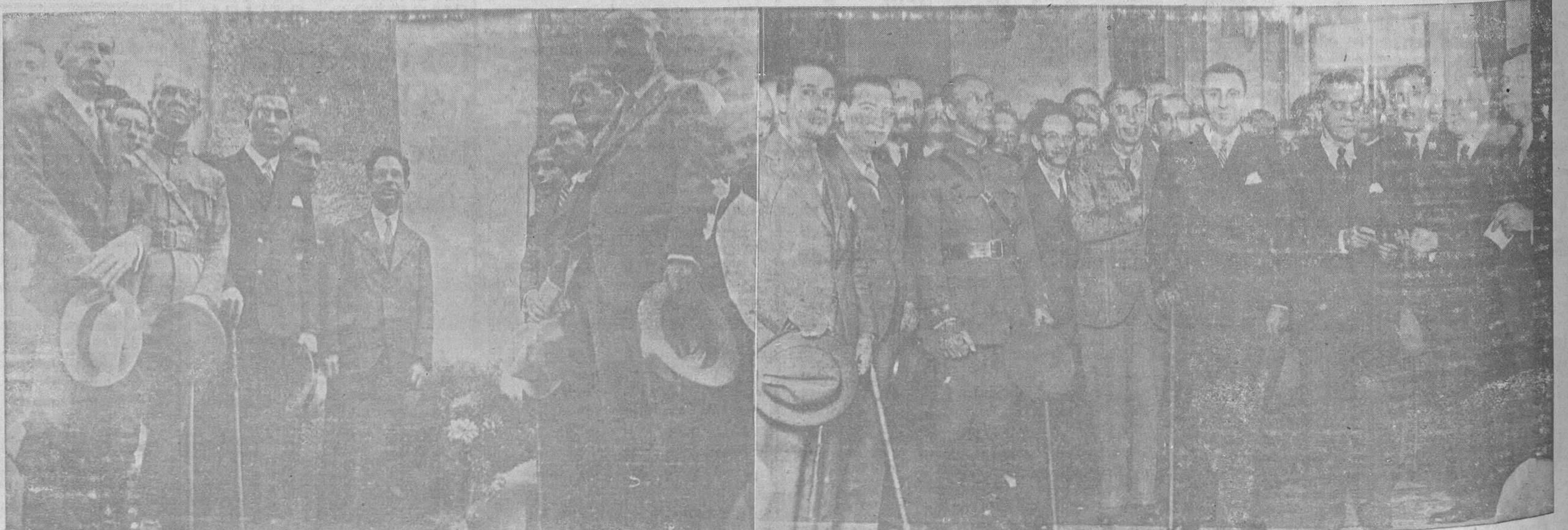
LOS ACTOS DEL DOMINGO.—En la foto de la derecha: las autoridades y personalidades reunidas en la Diputación durante el acto de entrega a Pérez de Ayala por el vicepresidente de la Comisión gestora, del documento suscrito por las representaciones asturianas. A la izquierda; el homenajeado ante el monumento a "Clarín", después de hacer la sencilla ofrenda de un ramo de flores en memoria del profesor y escritor inolvidable.

A esta reunión asistirá un representante del Colegio de Gijón, que se hará cargo de ellas para ser desarrolladas y defendidas en la Asamblea nacional convocada en Madrid para el 20 del actual.