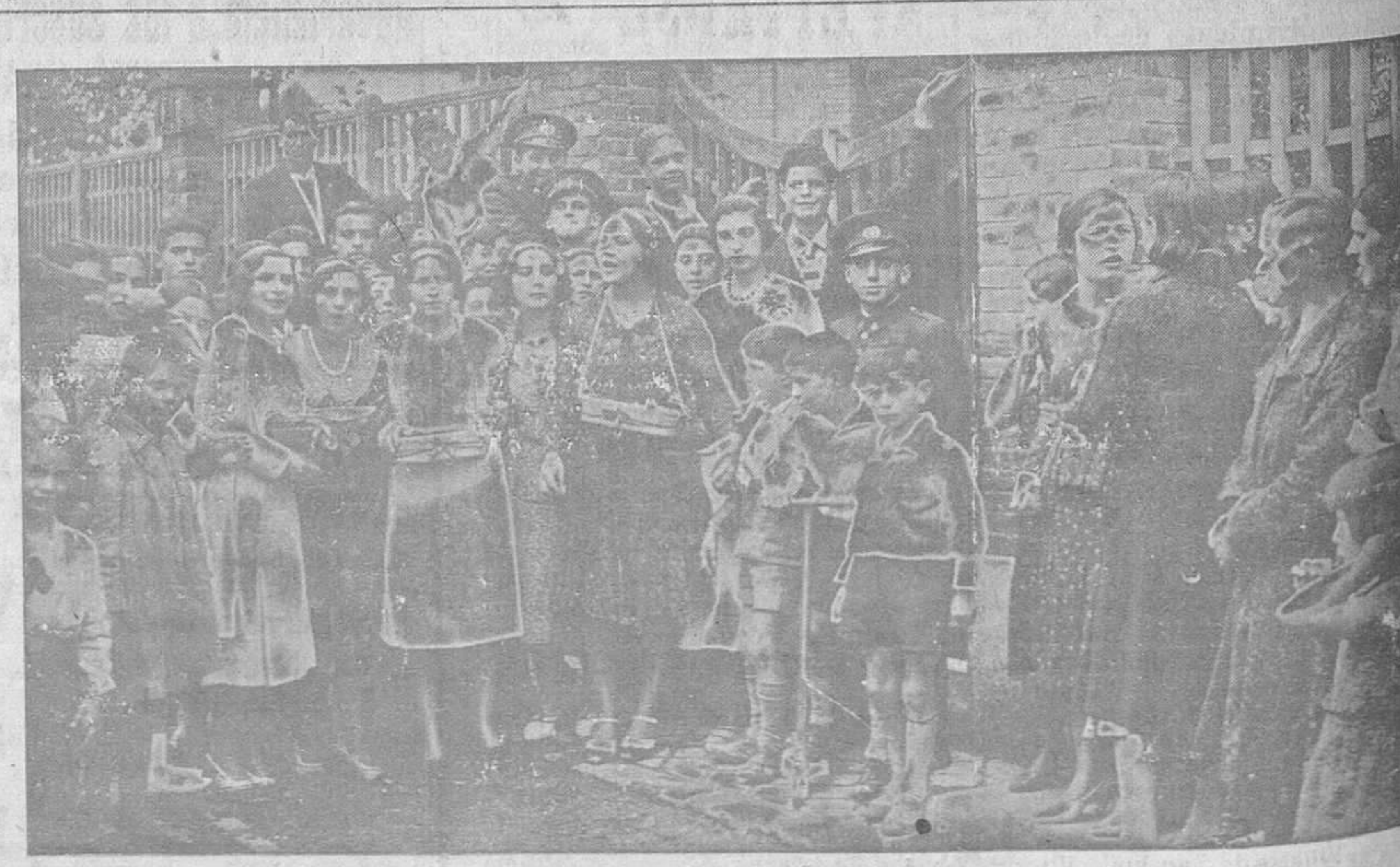
DE LA FIESTA DE LOS PILARES.—Un grupo de bellas señoritas que postularon en la fiesta de la flor organizada con motivo de los tradicionales y brillantes festejos del barrio