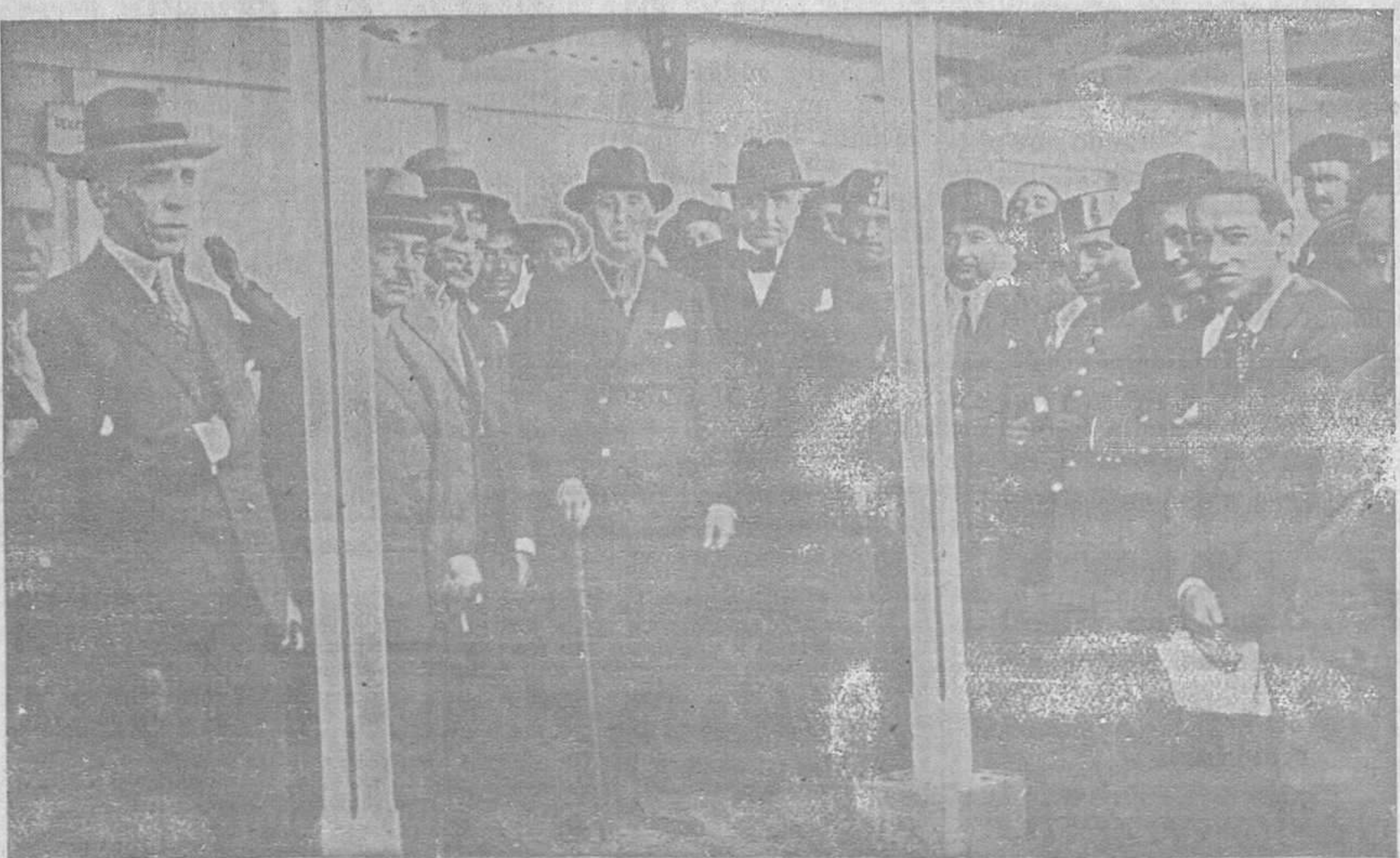
LOS ACTOS DE AYER EN AVILES.—El Gobernador civil, acompañado de otras autoridades y personalidades, durante su visita a la Exposición Agro-pecuaria