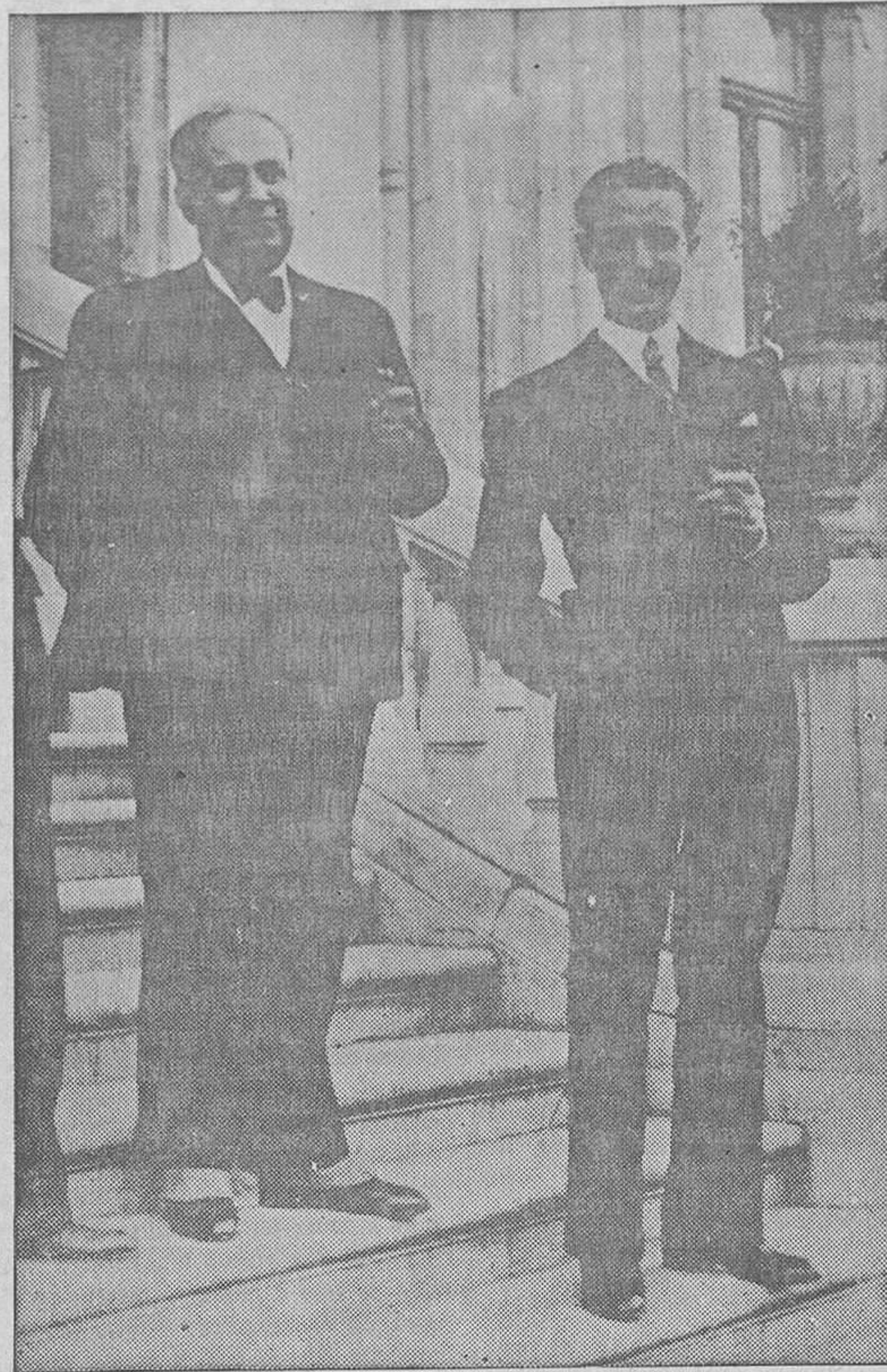
Oviedo.-El ministro de Industria, señor Orozco, y el gobernador general señor Velarde, a la entrada del Palacio oficial

Los comisionados y el Alcalde se interesaron cerca del ministro porque se habilite una fórmula que haga posible la reanudación de los trabajos en las dos mencionadas Fábricas Nacionales, y después de un cambio de impresiones, se perfilan las peticiones en el siguiente sentido: Primero, que aquellos obreros que se presentaron voluntariamente al trabajo en la Fábrica de la Vega, en la mañana del día 5, y que sólo se retiraron ante las indicaciones del Director del Centro fabril, no sólo sean tenidos en cuenta para ser readmitidos, sino que