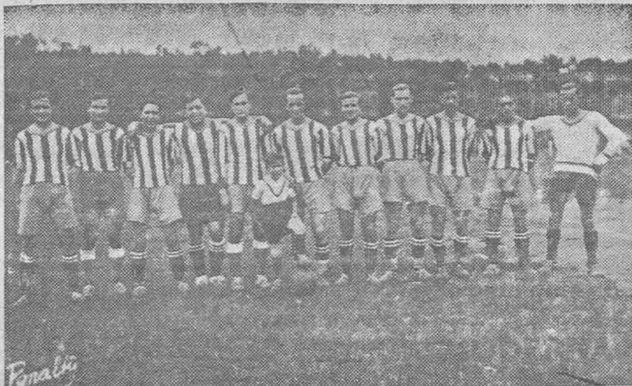
LOS EQUIPIERS DEL NAVIA F. C.