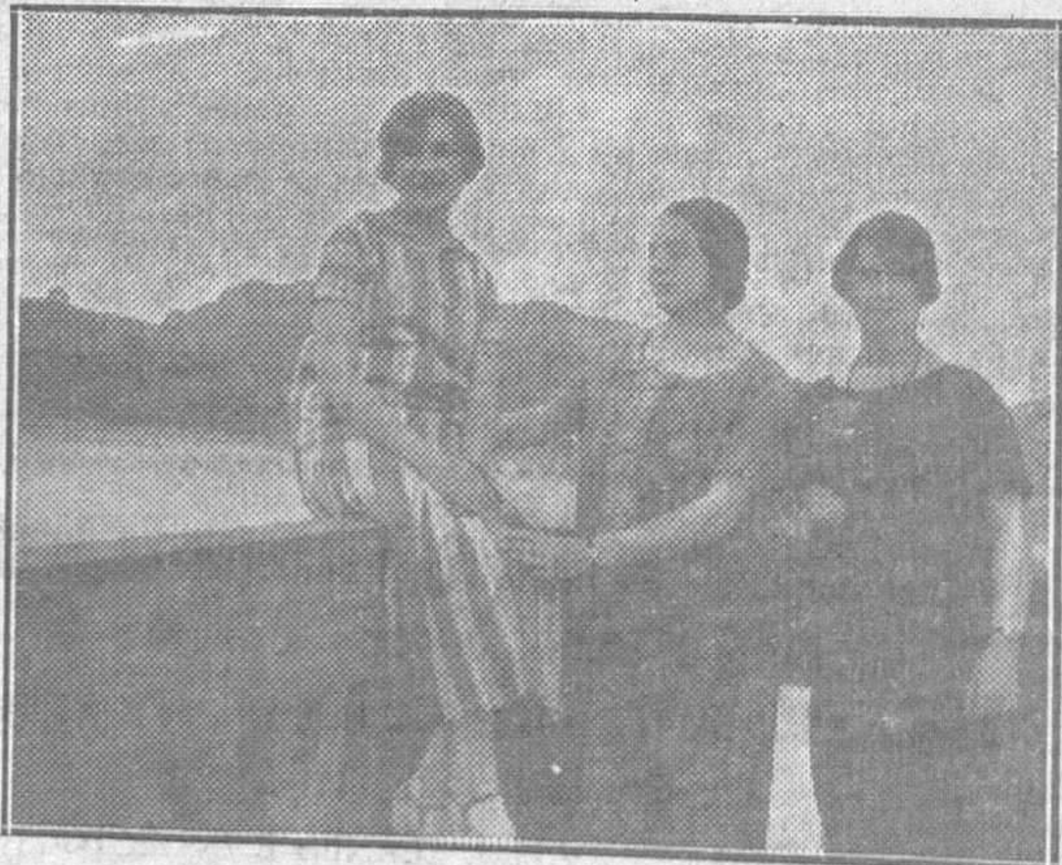
Tres bellísimas parrenses

Felicitámosle por su acierto en el negocio.