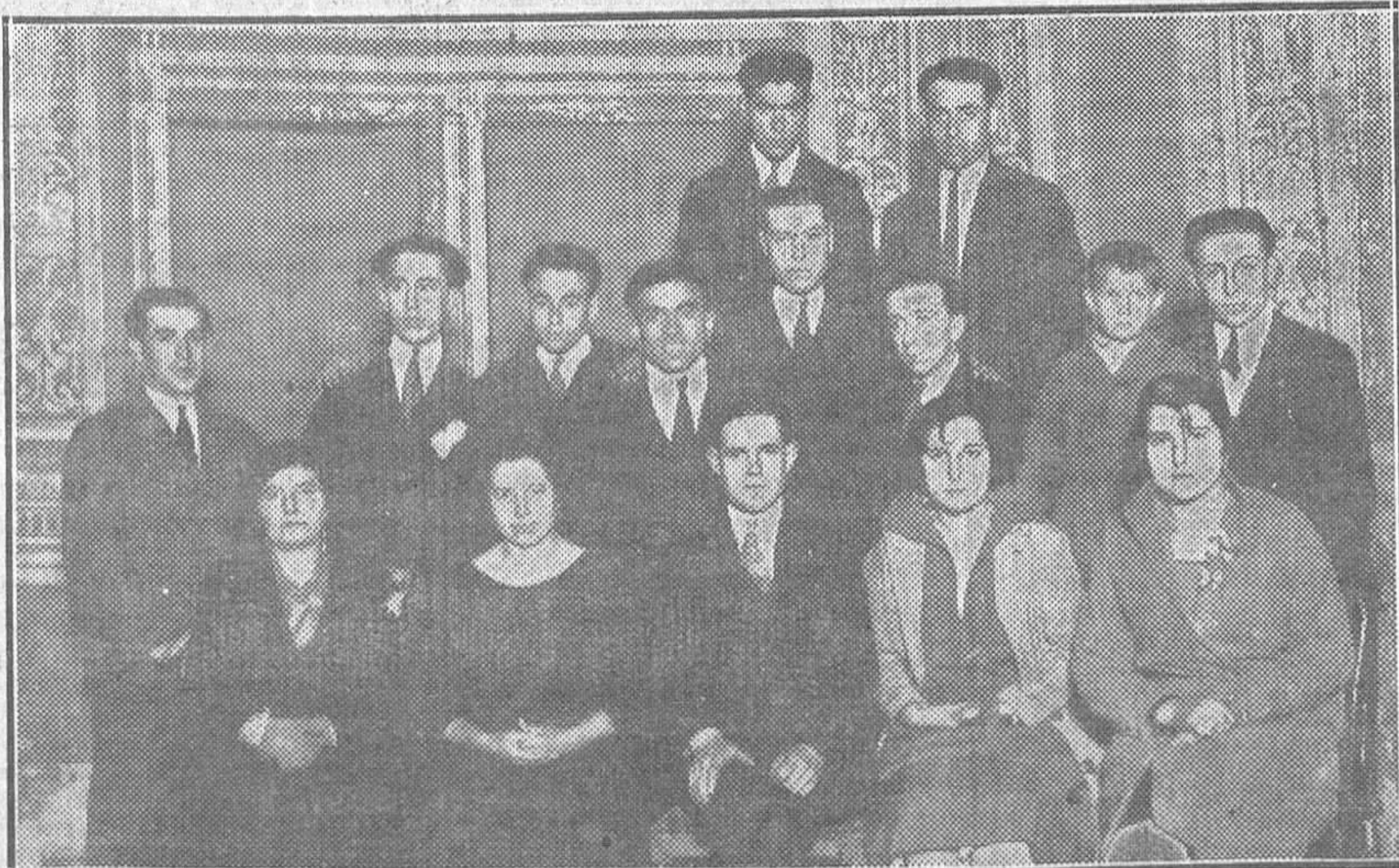
El cuadro artístico «Clarín» que el próximo sábado actuará en el Campoamor, a beneficio del Montepío de Peluqueros

Zamora.—Esta mañana cuando celebraba misa en el Colegio de las Hijas de San José el canónigo maestro de la Catedral don Bertrescuella de Cerralde, cayó a tierra sin sentido. Los fieles, pasado el primer momento de estupor, acudieron en su auxilio, pero éste resultó inútil, porque el canónigo era ya cadáver. El suceso ha causado impresión.