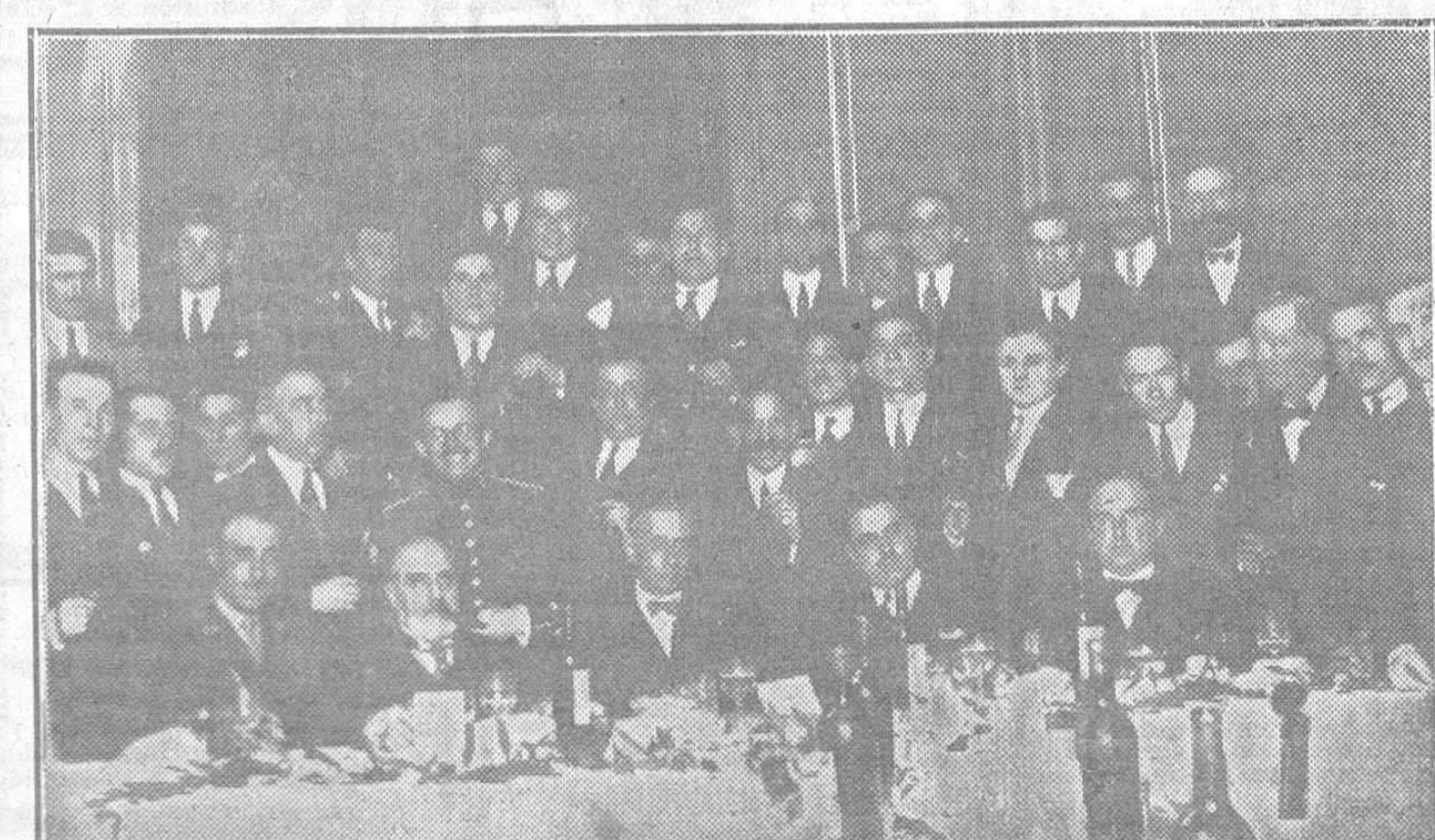
El banquete conmemorativo de la fundación del Cuerpo de policía.—Un grupo de los concurrentes al celebrado ayer en Oviedo

Lo firmaba Ismael Pérez, que ofrece 5 millones de pesetas, aumentando 250.000 pesetas cada año hasta 1930 y un tanto por ciento si la recaudación que se haga excede del citado cupo.