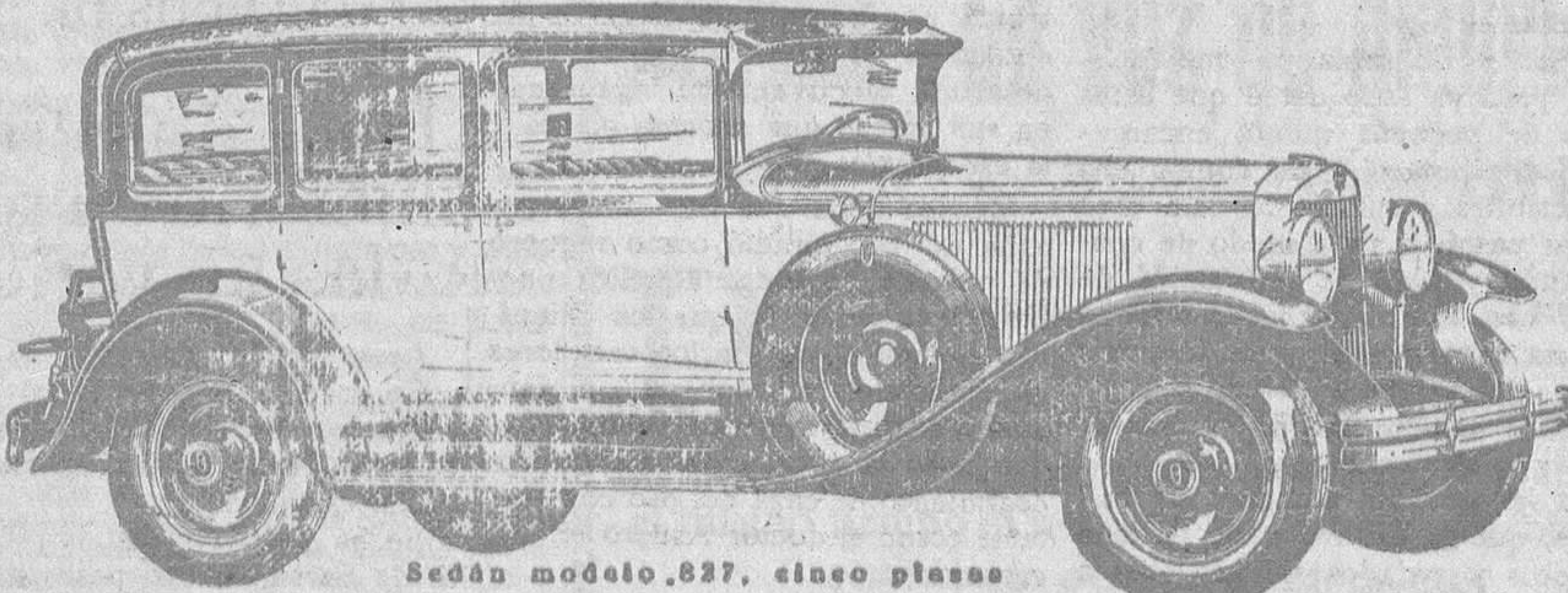
Sedán modelo 827, cinco plazas

Los propietarios de automóviles Graham-Paige dicen frecuentemente que la única nueva emoción en automovilismo que han disfrutado desde hace mucho tiempo, es el singular funcionamiento de la transmisión de cuatro velocidades hacia adelante (las dos altas silenciosas, con cambio de marcha igual al corriente de tres) de que van provistos estos coches. Solo por experiencia personal puede apreciarse la rapidez y suavidad obtenidas en cuarta, velocidad empleada casi constantemente, y la rápida aceleración que proporciona la tercera merced a un engranaje interno y silencioso.