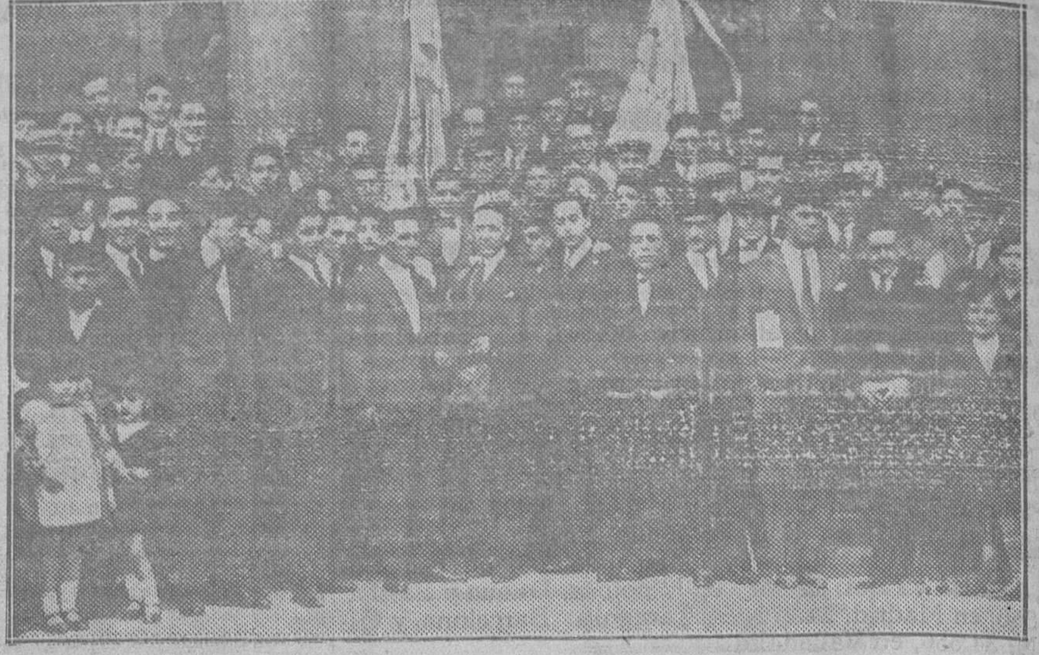
OVIEDO.—El Orfeón Ovetense, a la salida de la iglesia de San Juan, donde con motivo de la fiesta de Santa Cecilia, cantó brillantemente la misa de Rillé