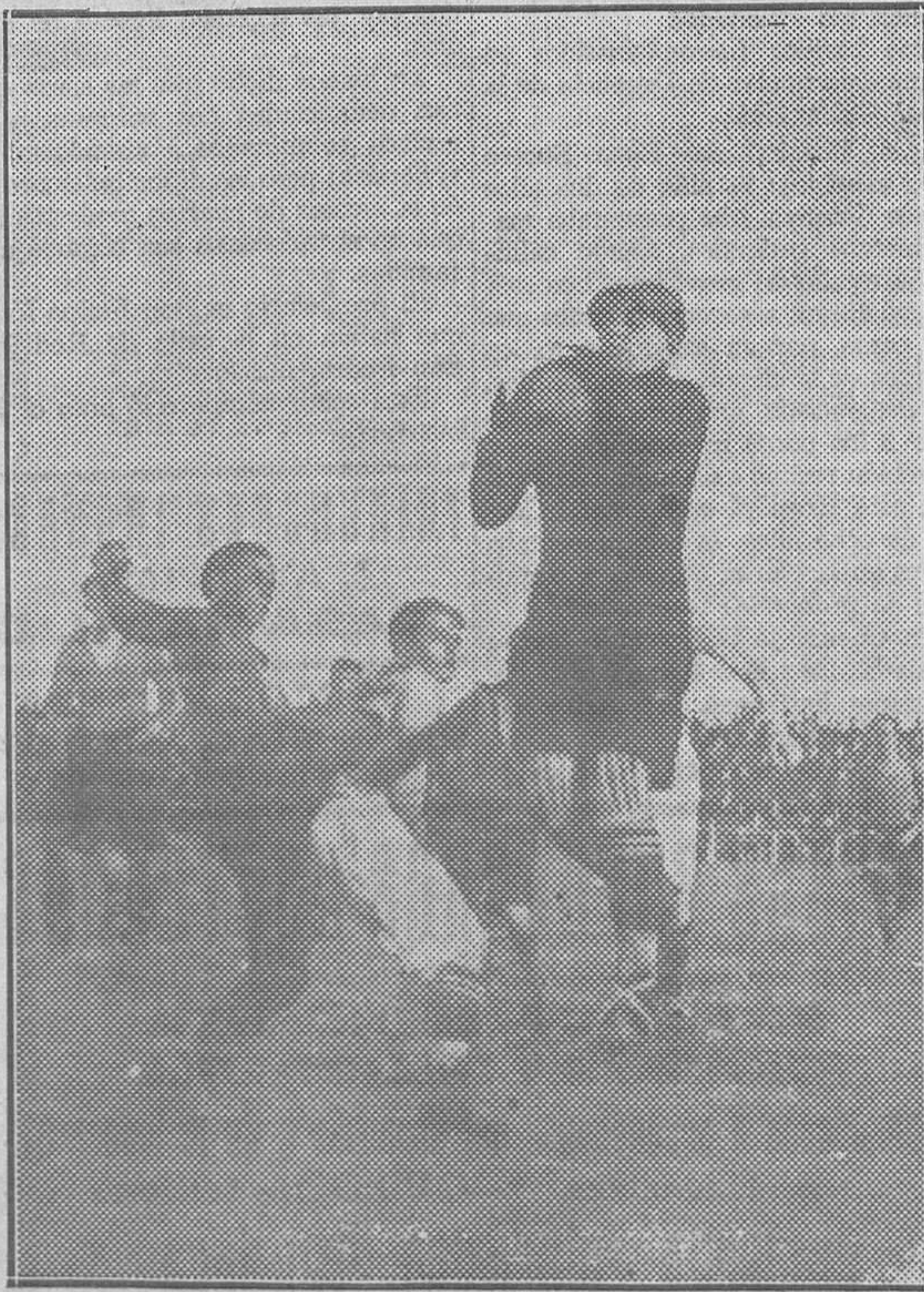
Oscar aprisionando entre sus garras de águila un fortísimo pelotón que viene de corner

Hoy salió para Gibraltar, haciendo el viaje sin novedad.