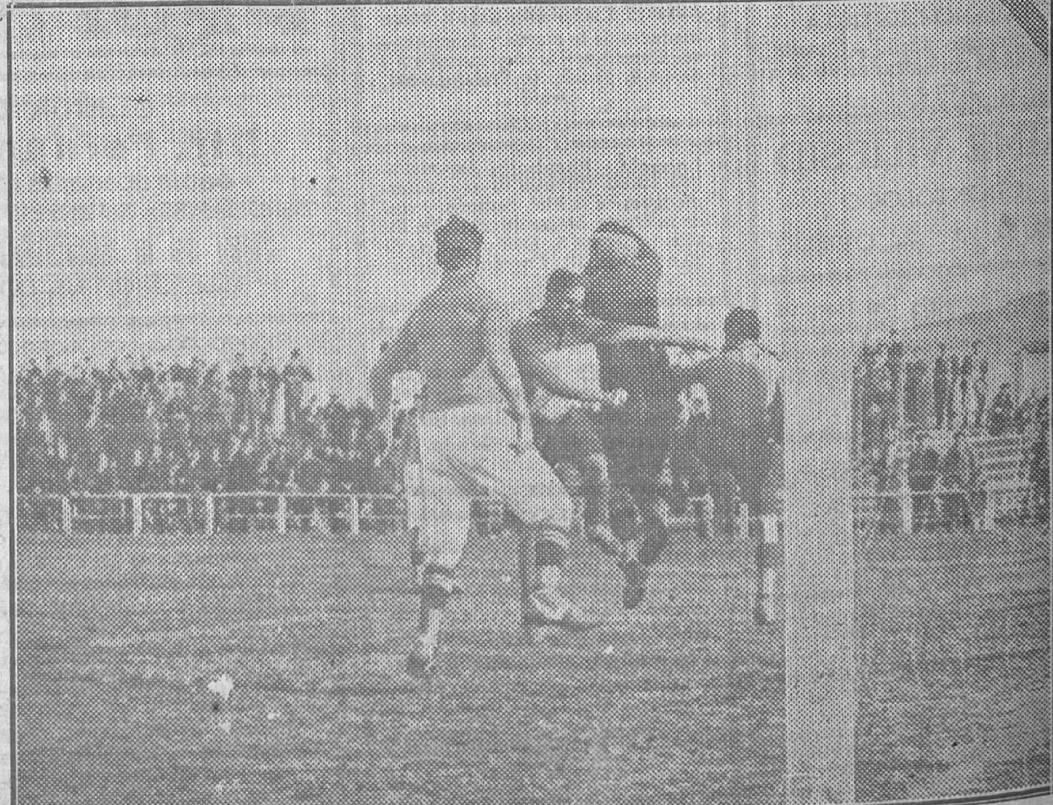
Oscar abriéndose paso por entre los atacantes que entran ciegos en busca de un goal