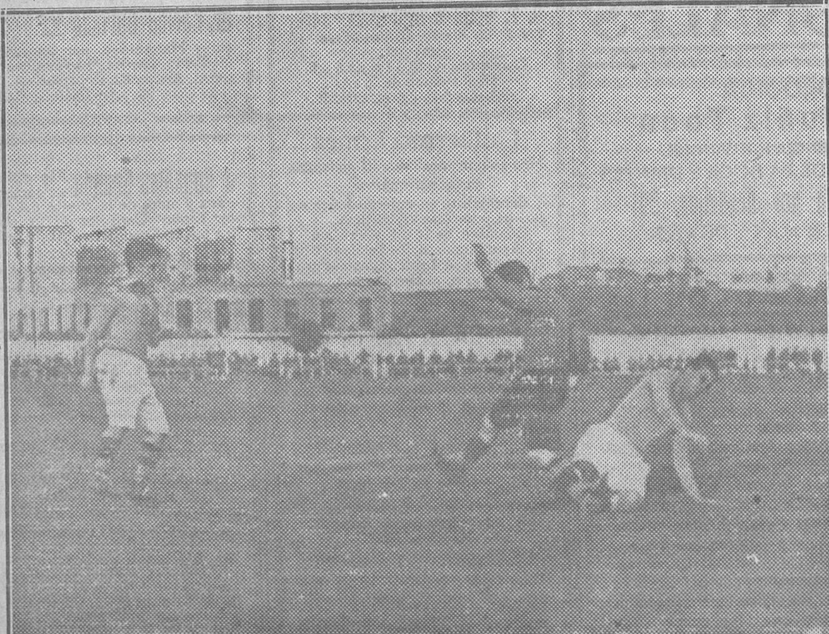
Un delantero del Athletic logra arrebatar el balón a Zabala con la correspondiente zancadilla. Véase al Avilesu extrañado por la «faena»