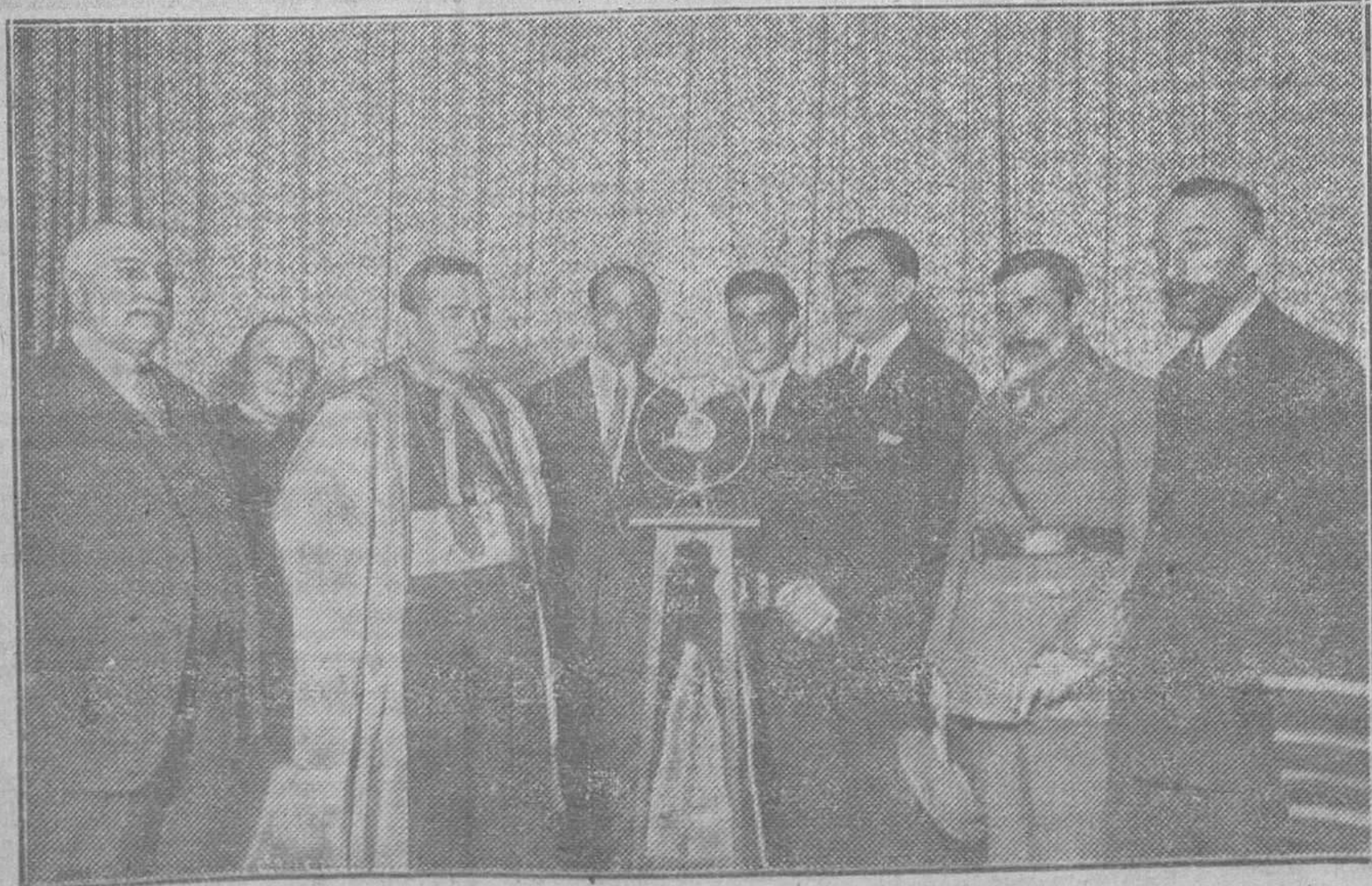
OVIEDO.—Las autoridades en el acto de inauguración de la estación radio E. A. J. 19, establecida en la calle del Marqués de Santa Cruz.