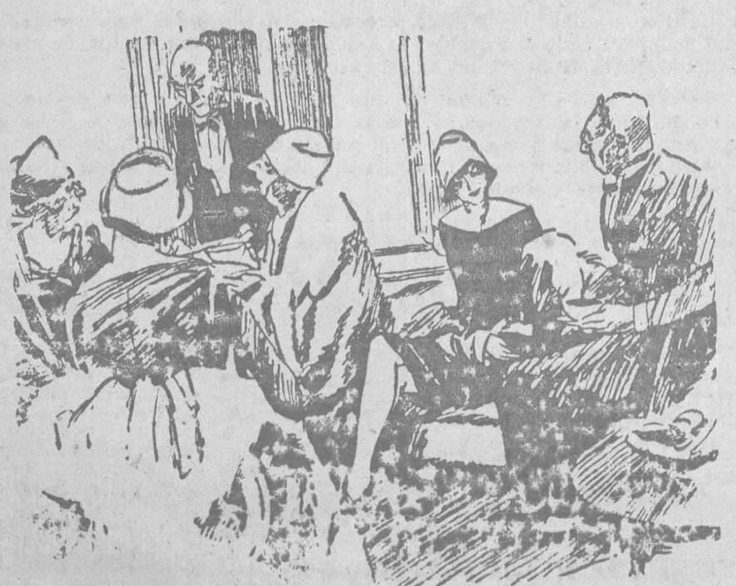
El señor.—El secreto de la buena salud está en comer cebolla. P ta . Puede ser; pero lo difícil es guardar el secreto