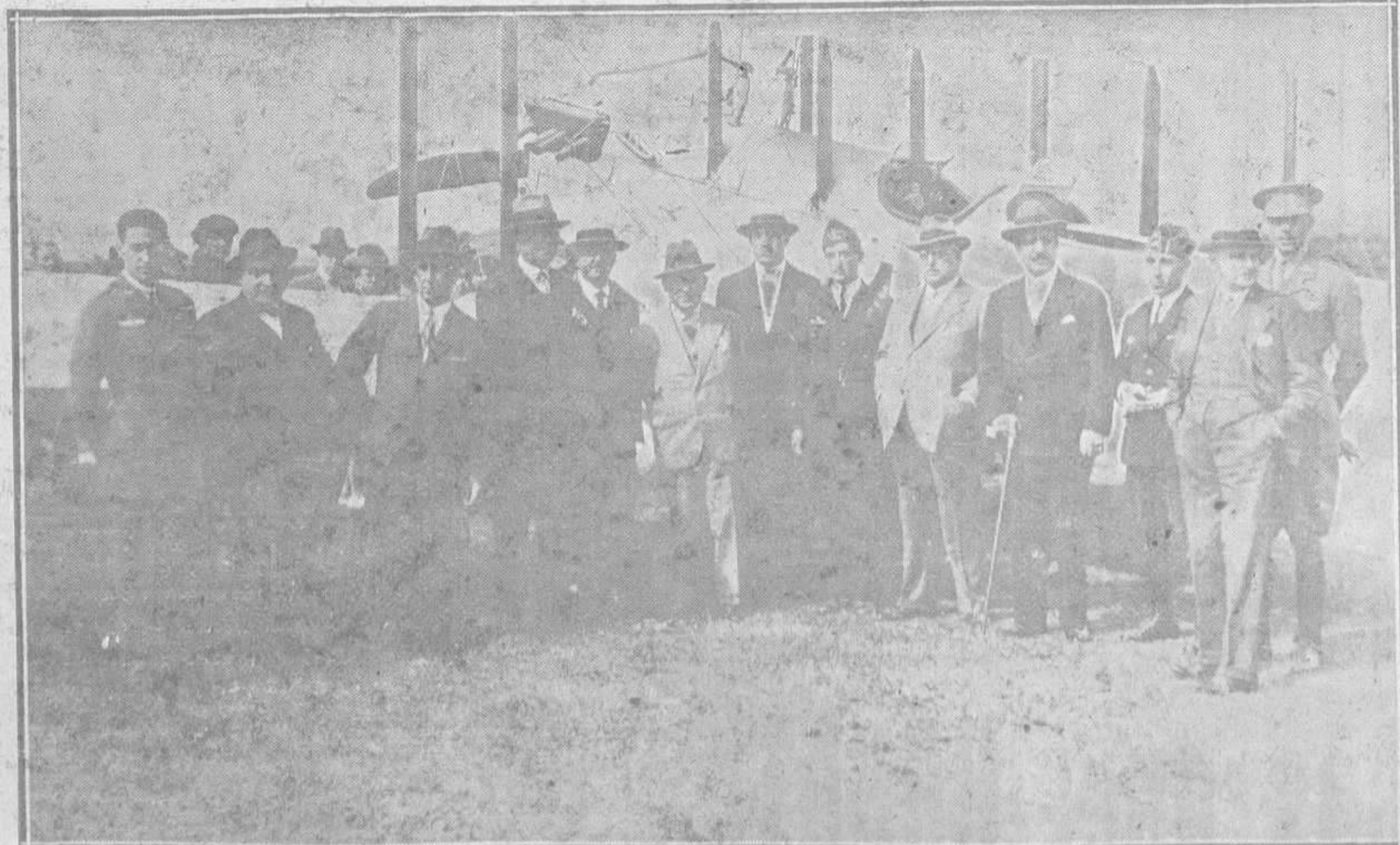
EN EL CAMPO DE LLANERA.—El alcalde de Oviedo con algunos concejales, directivos del Tennis y otras personalidades, que acudieron a recibir a los aviadores llegados en vuelo desde la base de León.

Esta dará un concierto por la tarde en el campo de San Francisco.