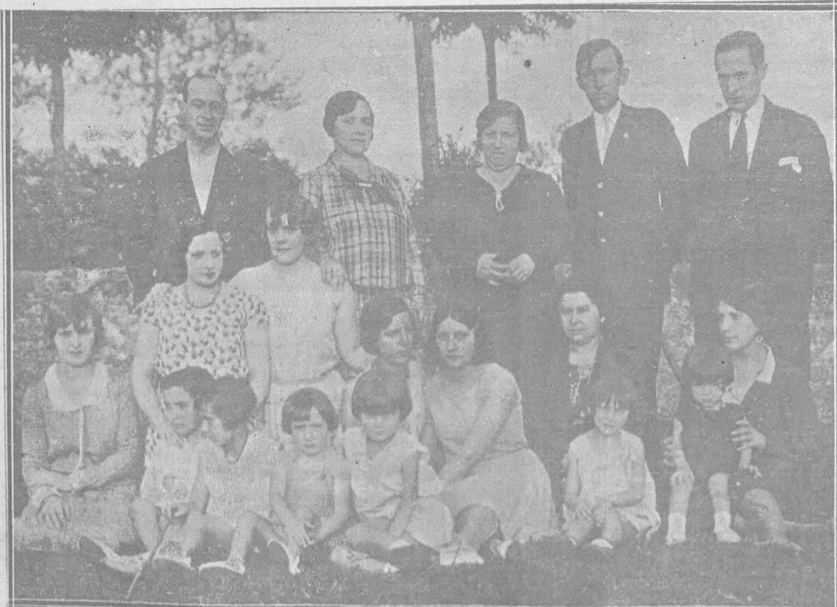
EN CECEDA.—Grupo de veraneantes ovetenses a quienes acompañan sus distinguidas familias, que han disfrutado de las comodidades que supone la estancia en tan pintoresco pueblo y se disponen a regresar a la capital.

Este número ha sido visado por la censura