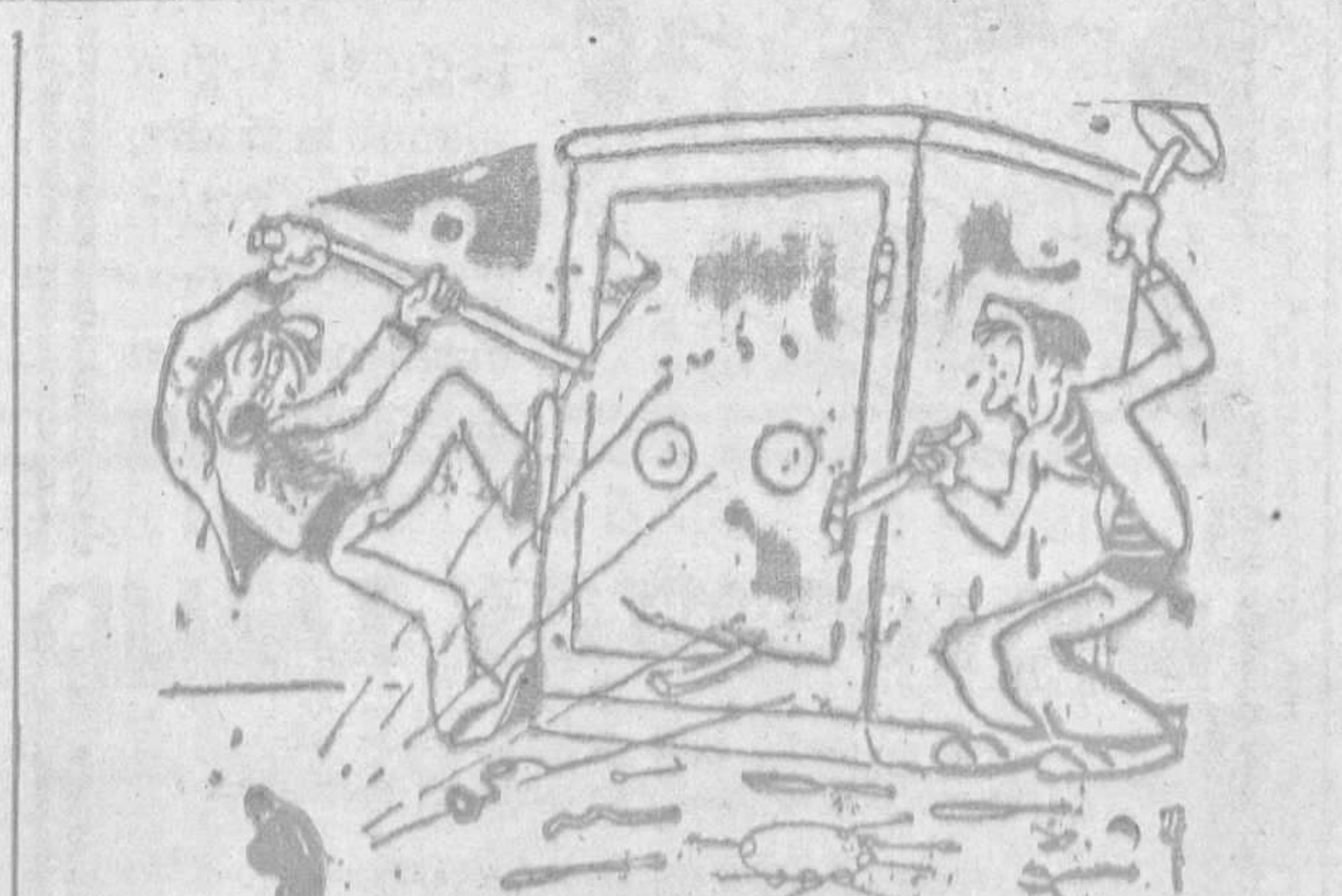
—¿Si el Jurado se hiciera cargo al menos de las fatigas que pasamos!