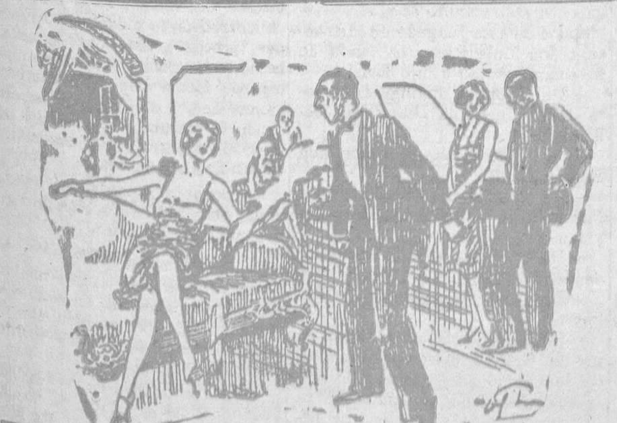
—Parece que está usted aburrido. —Sí; es el efecto del matrimonio. —¿Hace mucho que está usted casado? —No; me caso mañana.

Día 4, miércoles.—Santos Rufino, Silvano y Vitálico, niños mártires; Marcelo, obispo y mártir; Mariano, diácono; Rosalía de Palermo, virgen; Ida, virgen.