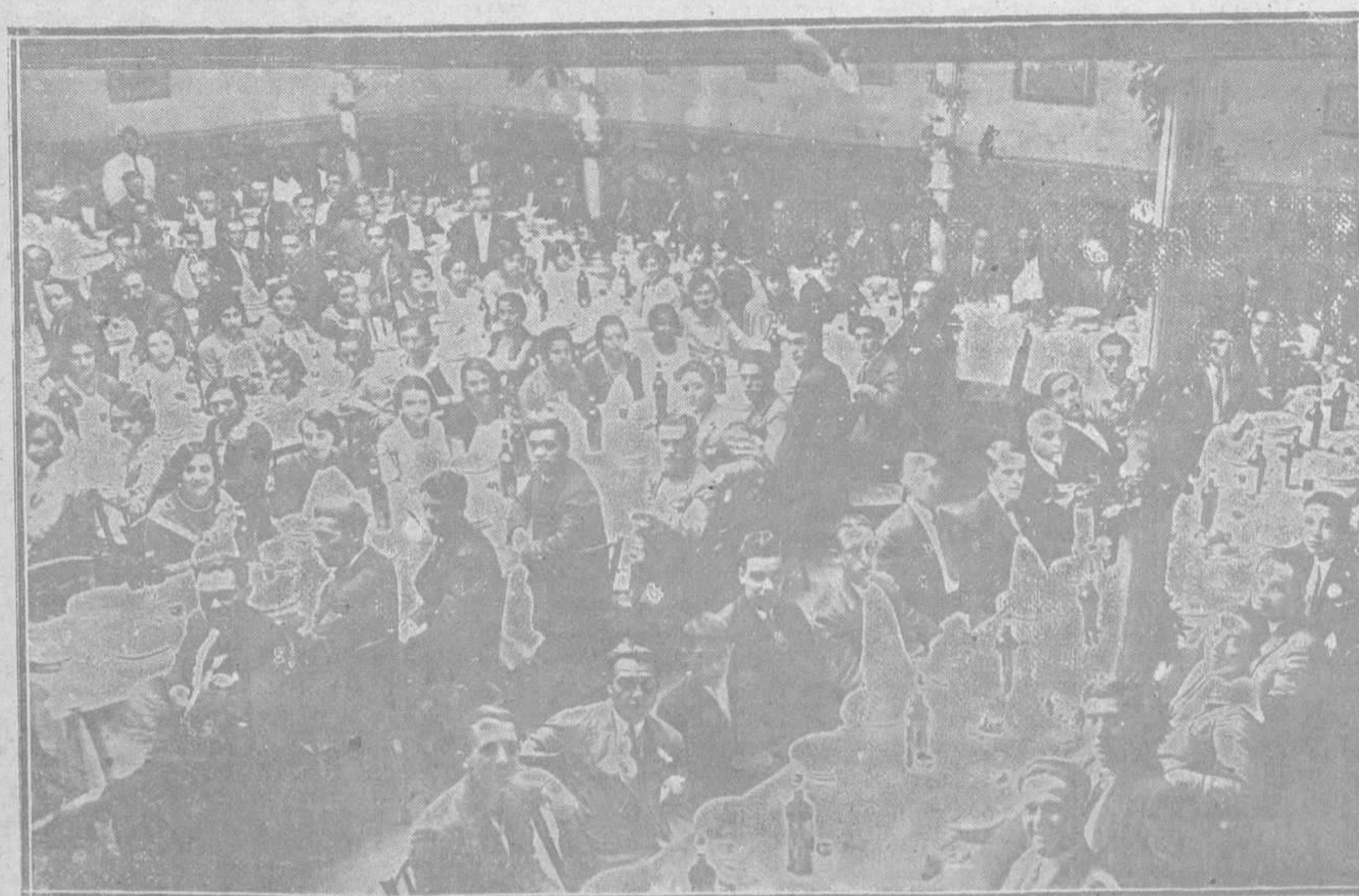
EN EL ORFEON OVETENSE. - Un aspecto del banquete celebrado el domingo y al cual concurrieron todos los componentes de la Masa Coral.

Este número ha sido visado por la censura.