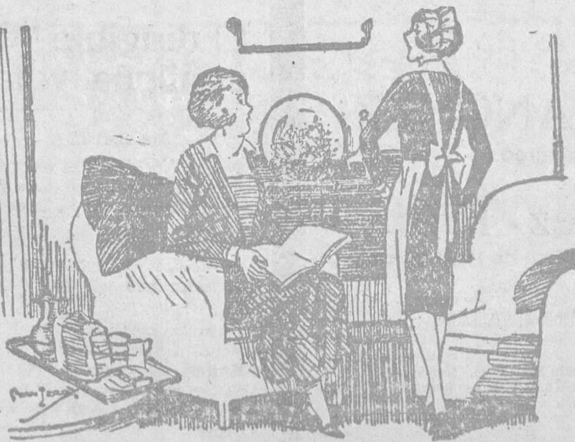
La señora. — ¿Y cree que estará aquí mucho tiempo? Ha mudado usted tantas casas... La doncella. — Sí, señora; pero sepa usted que de ninguna me he salido por mi voluntad.