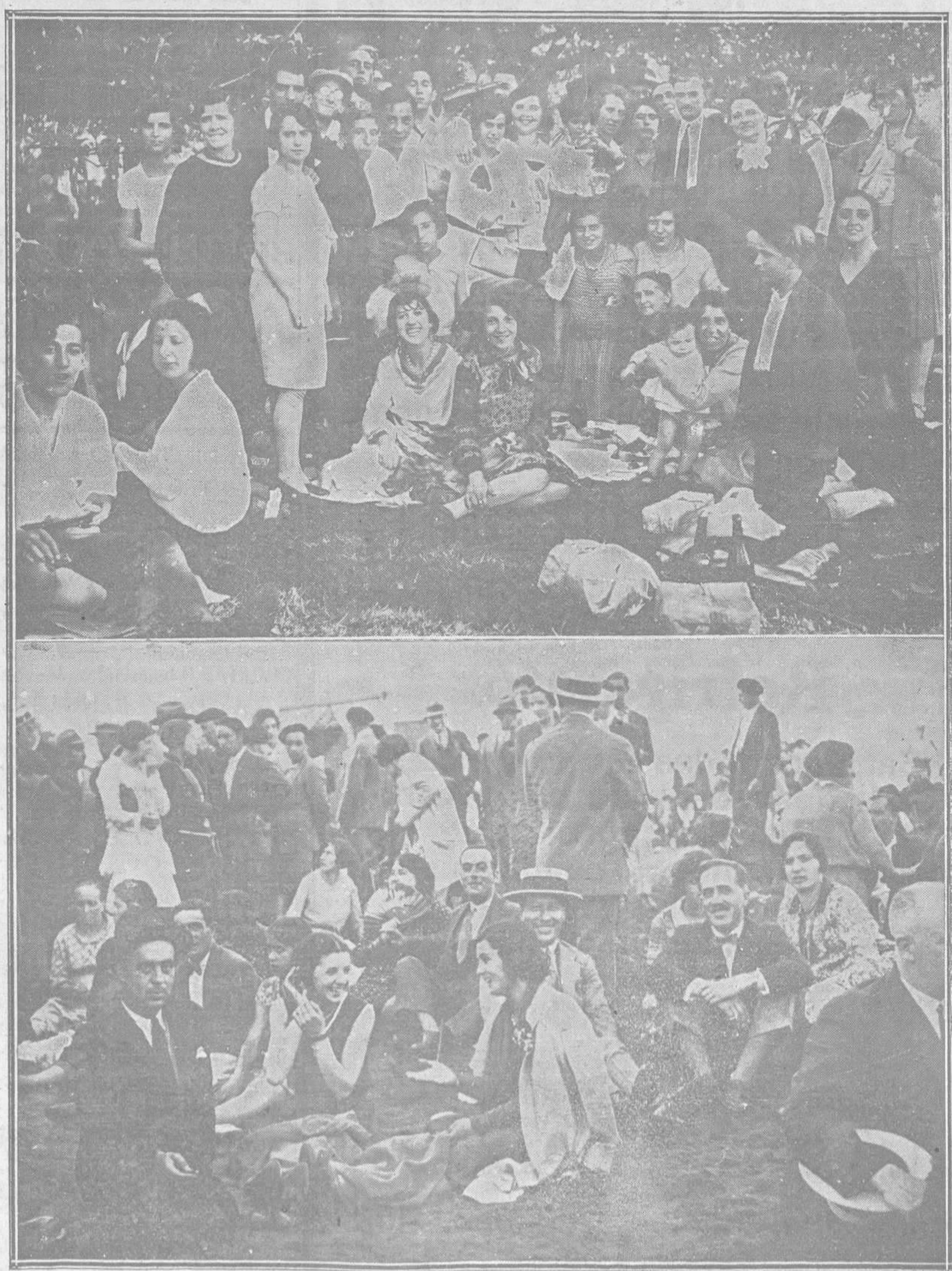
DEL CARMIN DE LA POLA.—Dos alegres grupos de romeros ovetenses, de los millares de personas que concurrieron el lunes a la tradicional romería de Pola de Siero.