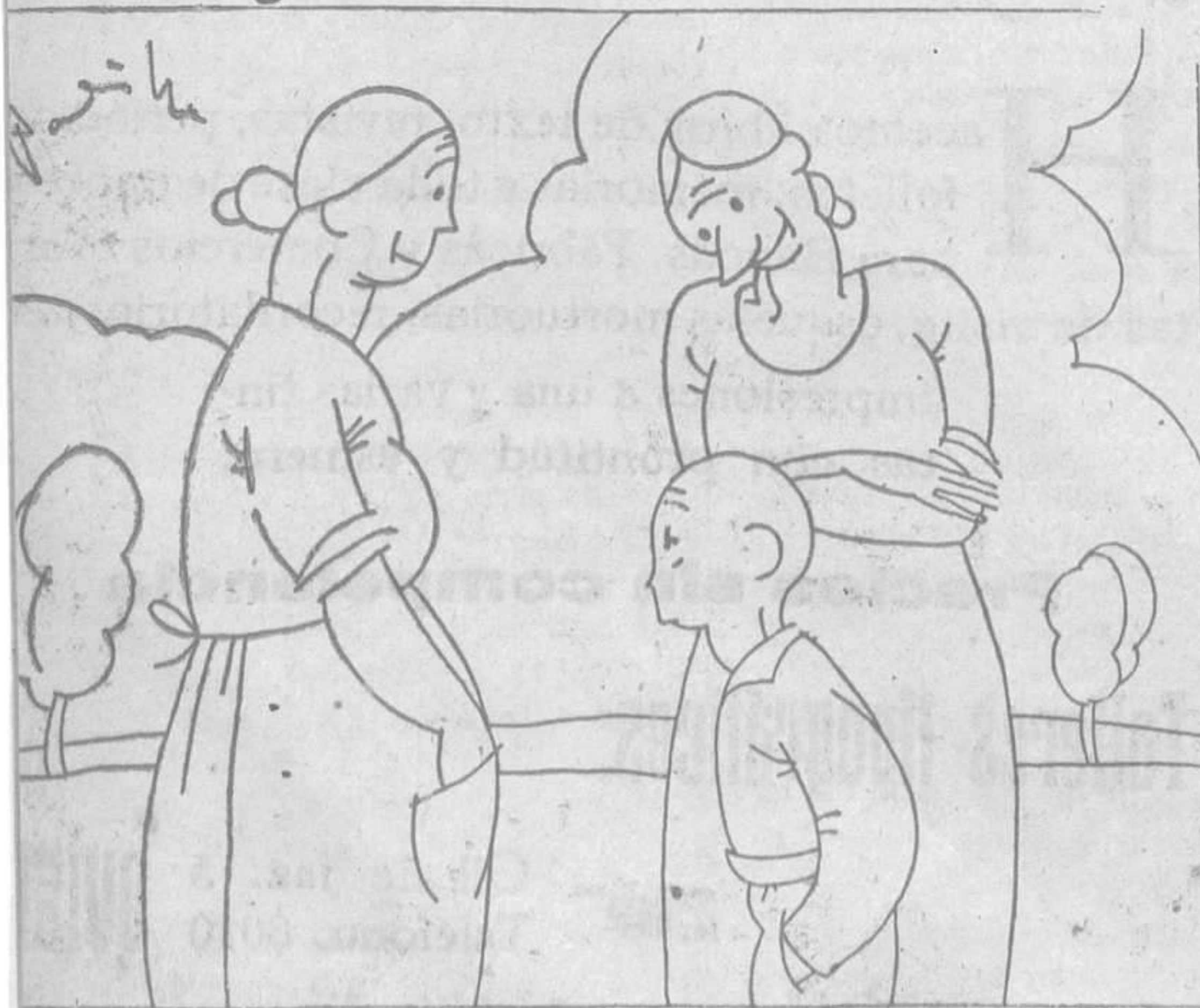
—Este hijo mío es un pedazo de pan. —Ya lo creo. Como que es un soquete.