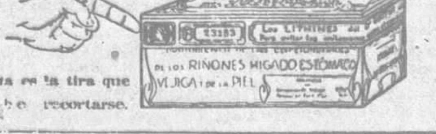
Foto en la tira que debe recortarse.