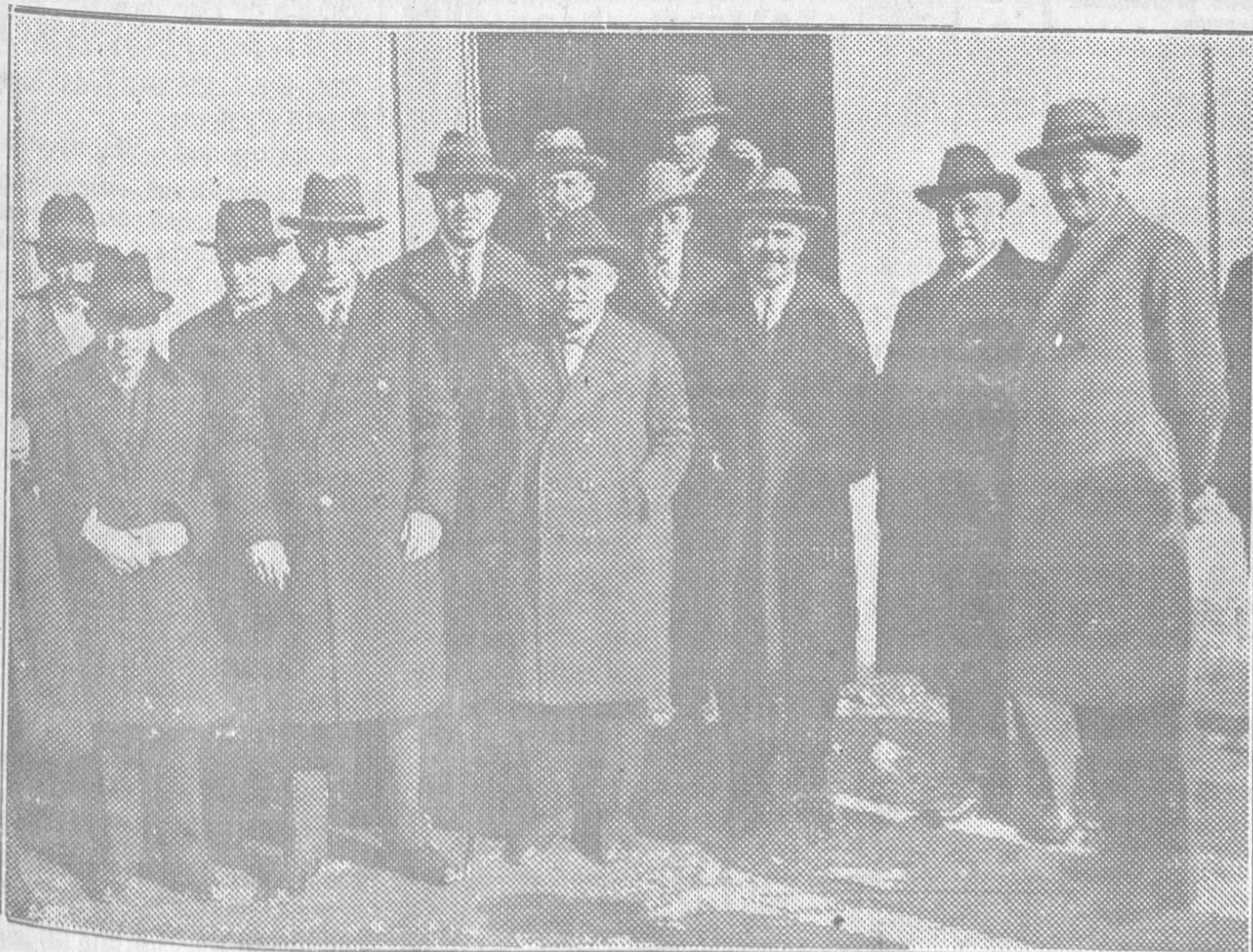
LLANERA.—Las autoridades que el domingo asistieron al acto inaugural del edificio destinado a Mercado

El ministro del Trabajo ha recibido un despacho del presidente de la Cámara de Comercio de Valencia,