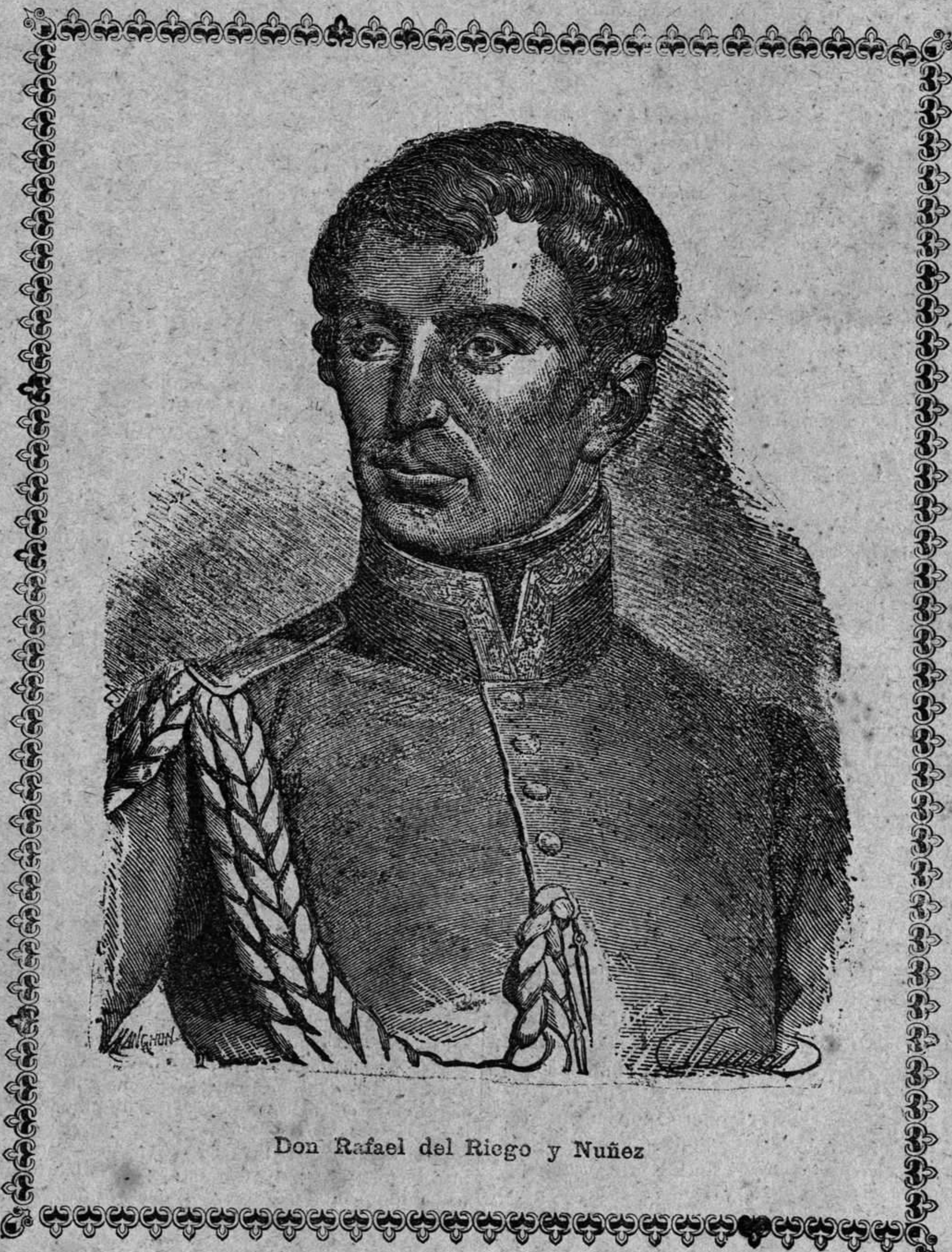
Don Rafael del Riego y Nuñez