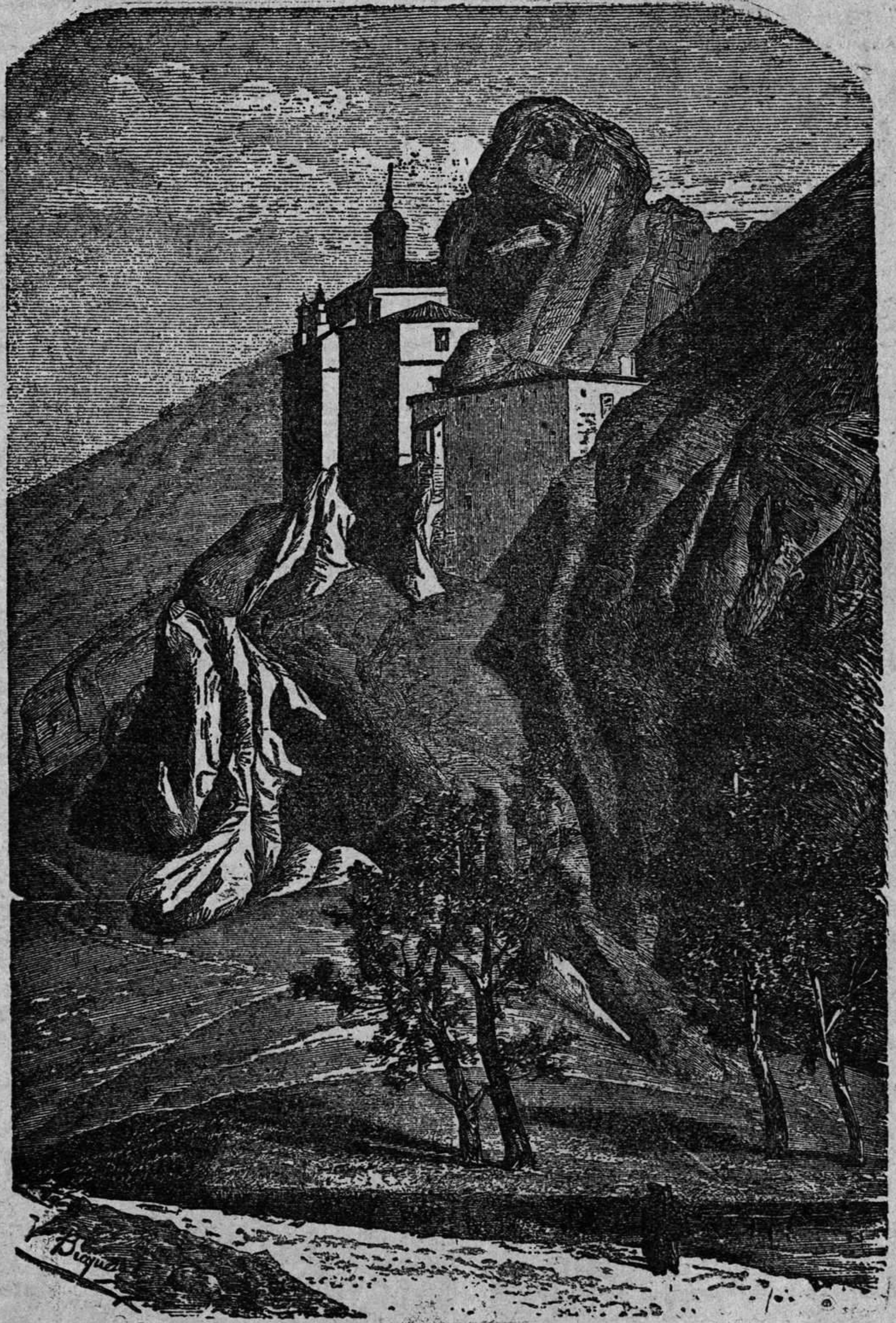
SORIA—Ermita de San Saturnino, patrón de la ciudad

cruel é inesperada enfermedad que me hizo víctima, no he tenido la satisfacción de dirigir mis periódicas correspondencias á EL CORREO DE ESPAÑA.