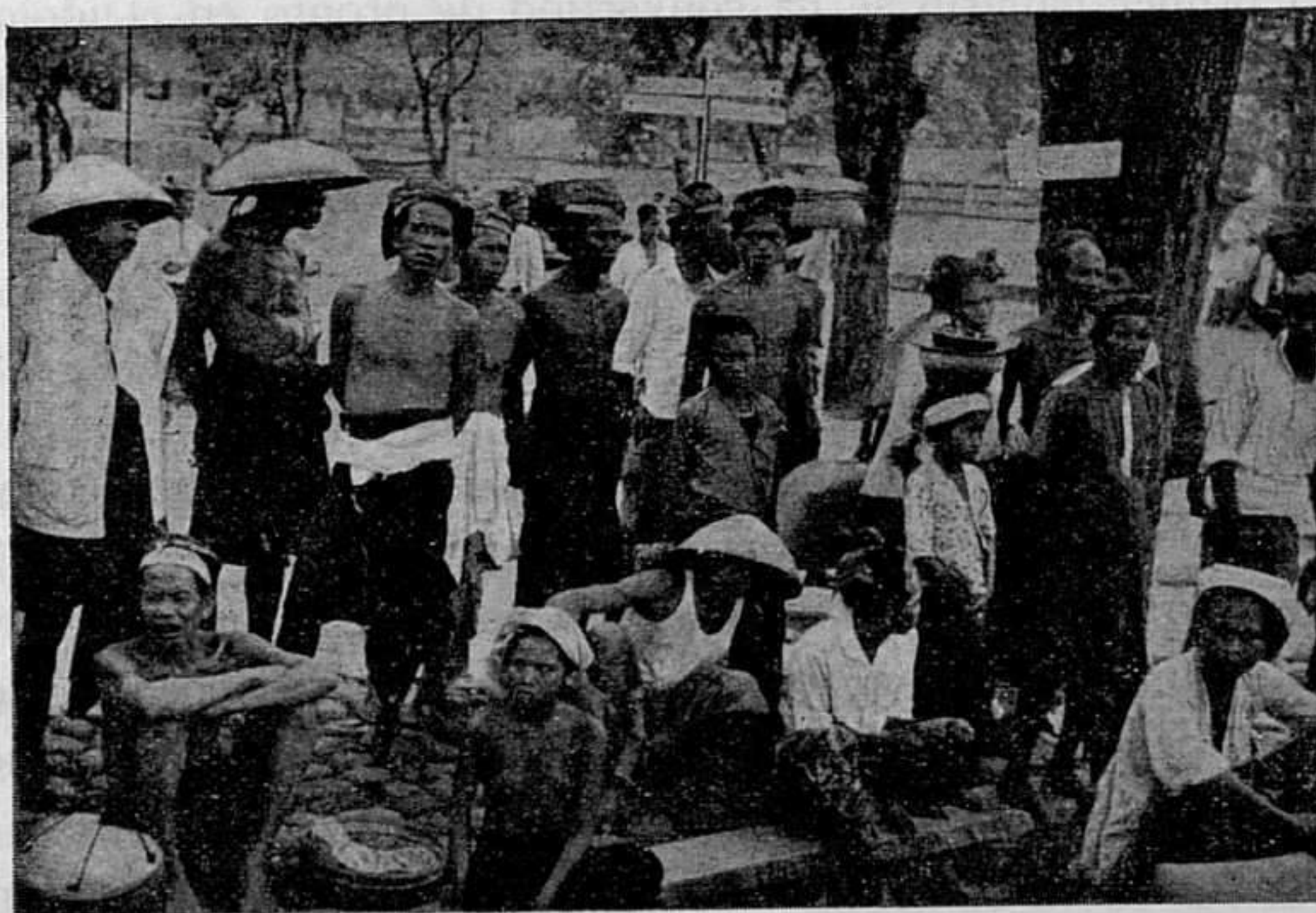
Los transeúntes se detienen para contemplar las danzas.