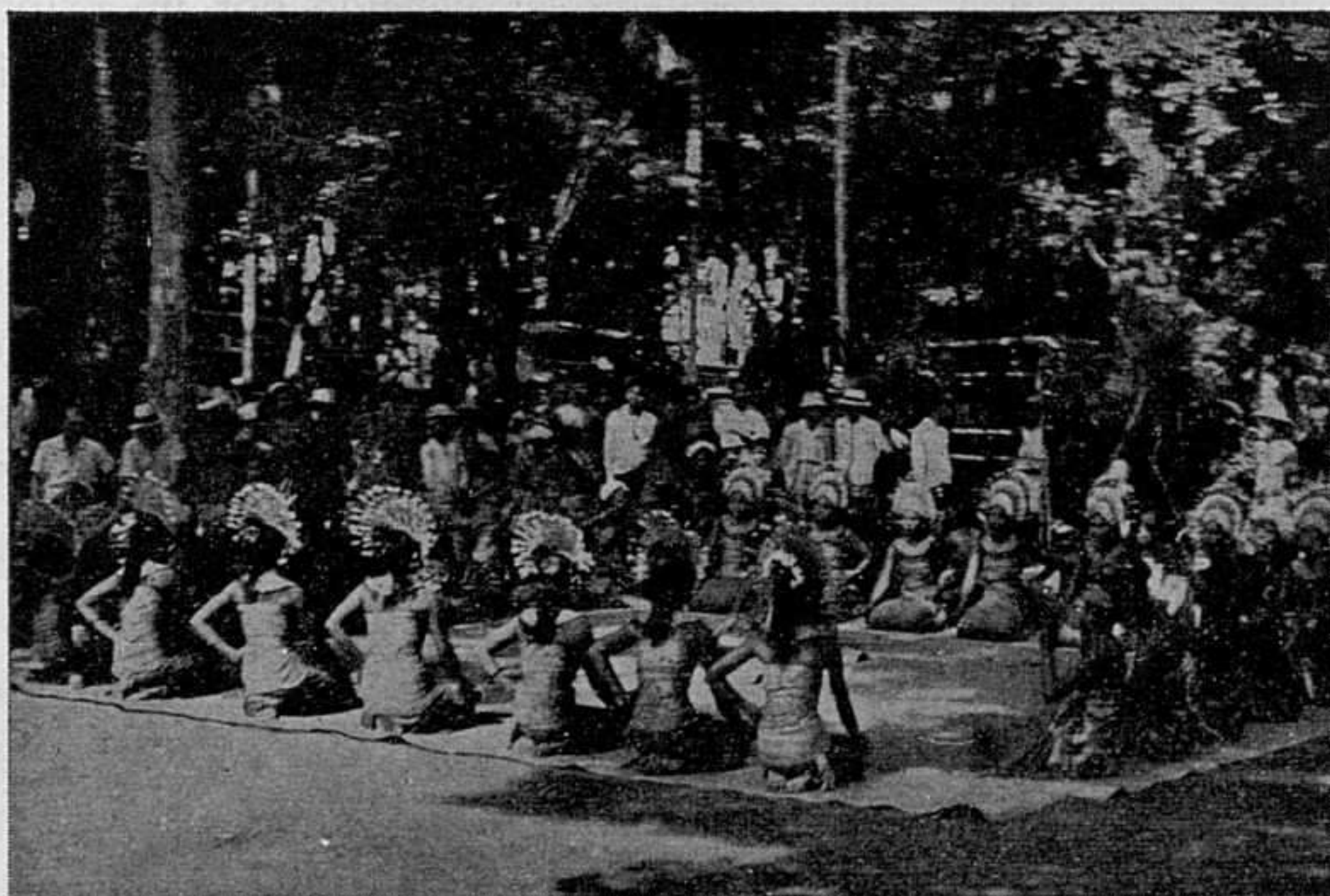
El coro, entretanto, baila con los brazos y con los ojos y canta describiendo las escenas.