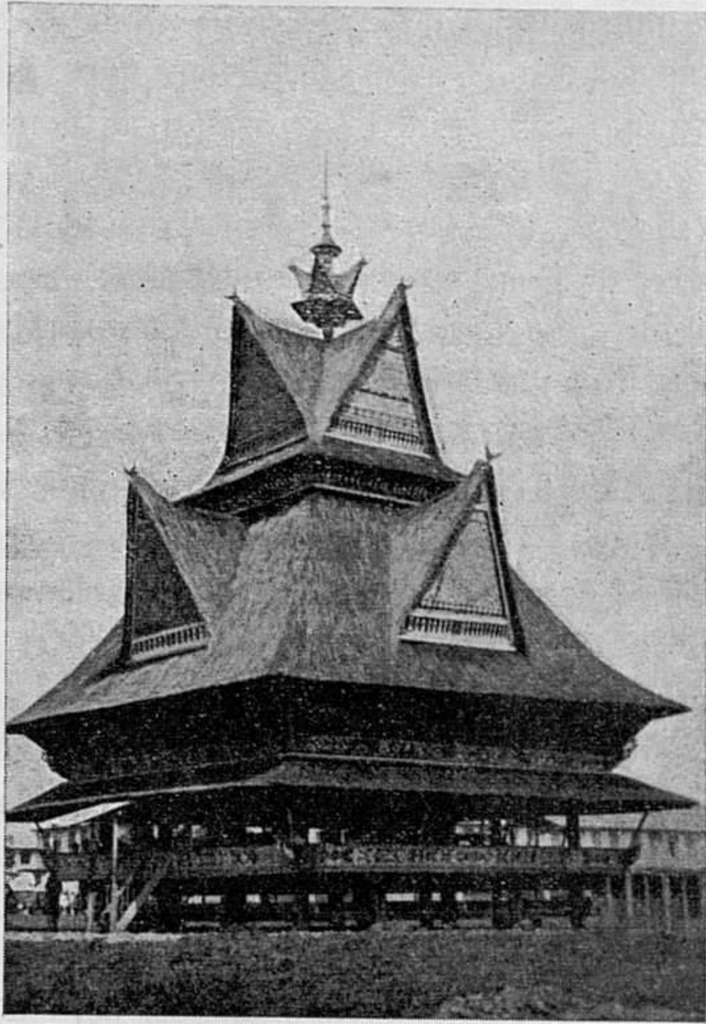
La mezquita de Medan (Sumatra).

Hermoso edificio en que los batacs de Arnhemia ce- lebran sus reunio- nes.