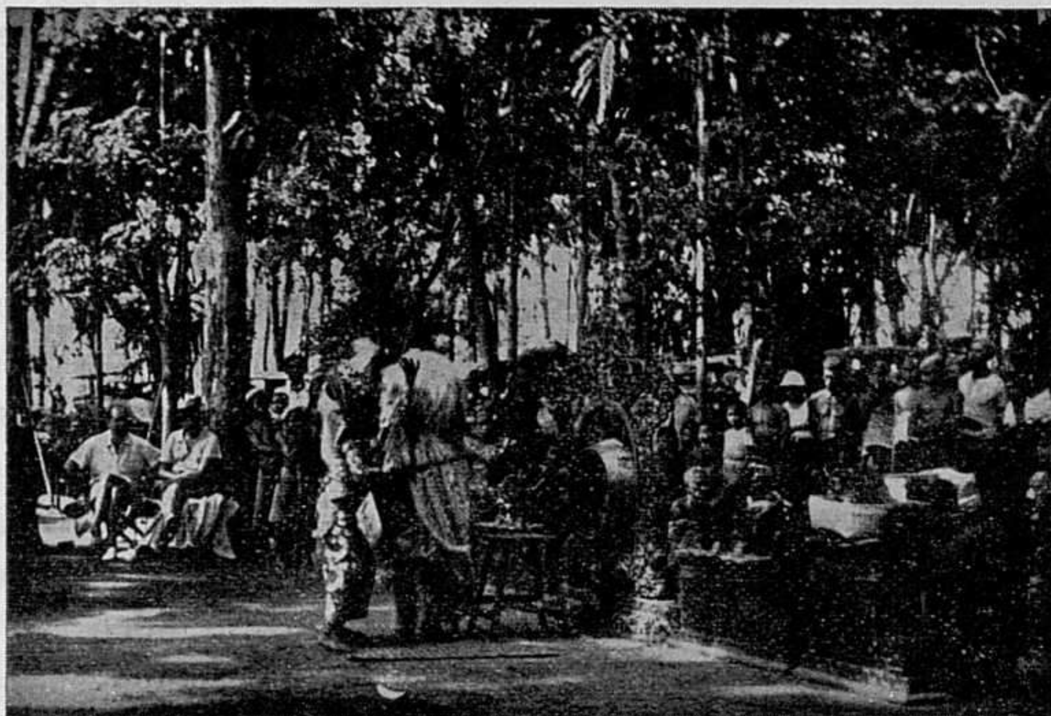
Brujas horribles cuyo sortilegio es vencido por un príncipe bizarro y apuesto.