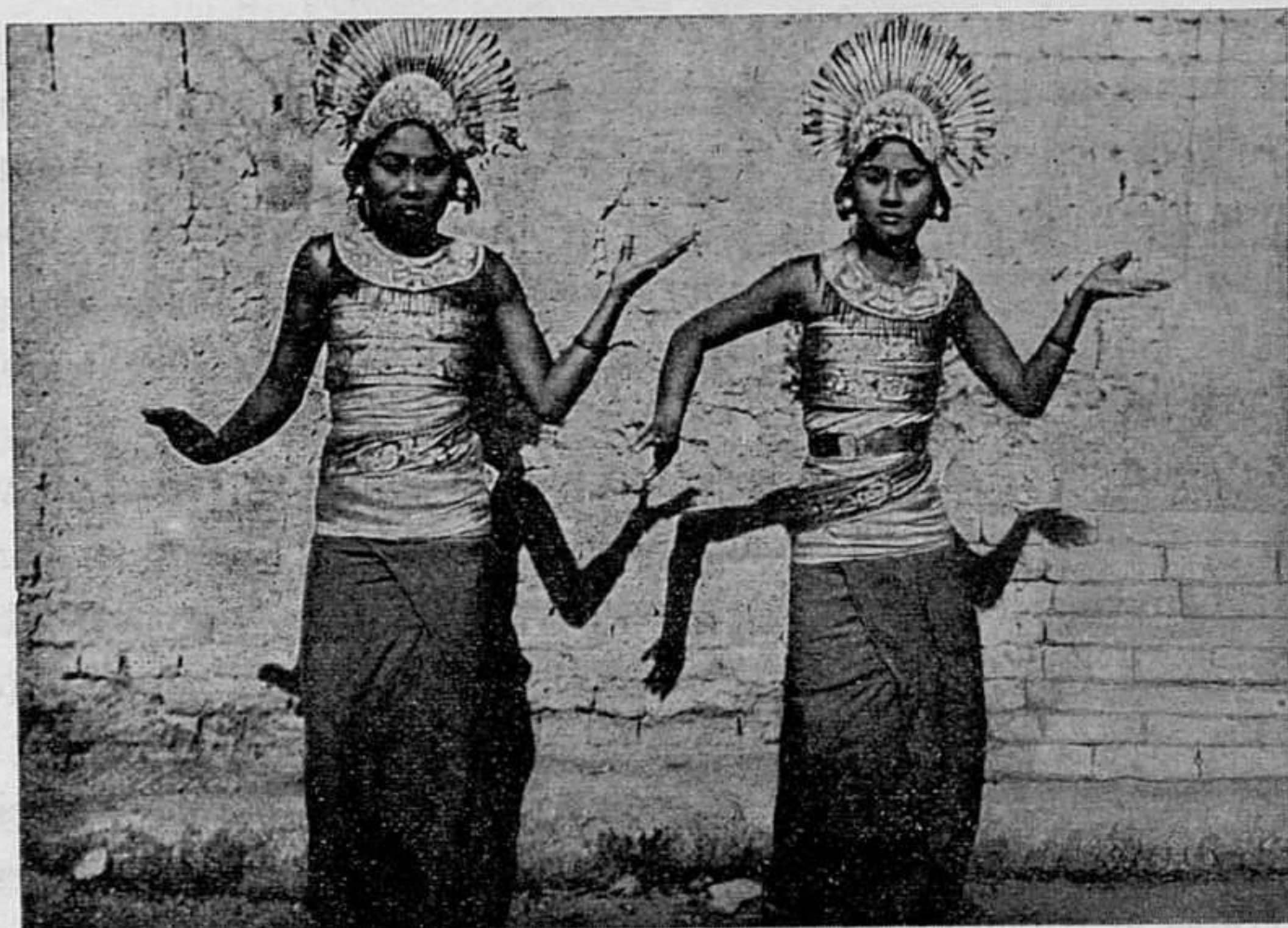
El tocado de las chicas del coro consiste en altísima diadema bordeada de flores blancas.