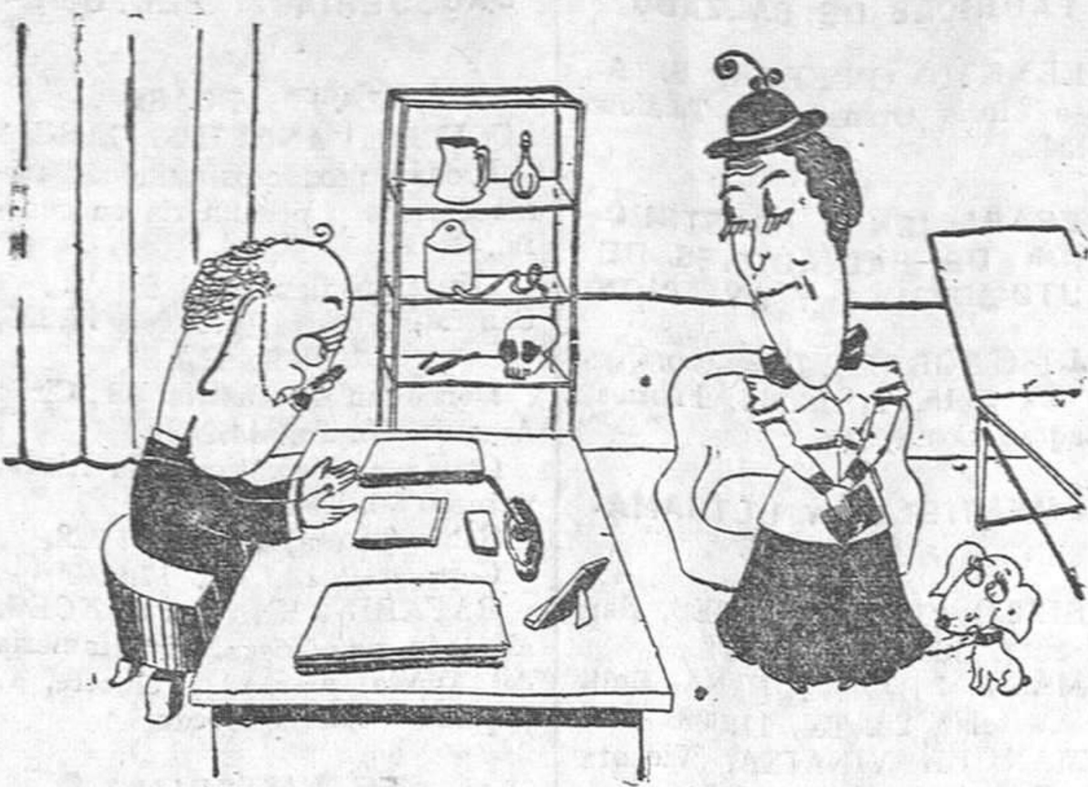
—Tengo que auscultarla. —Entonces prefiero volver con mamá.