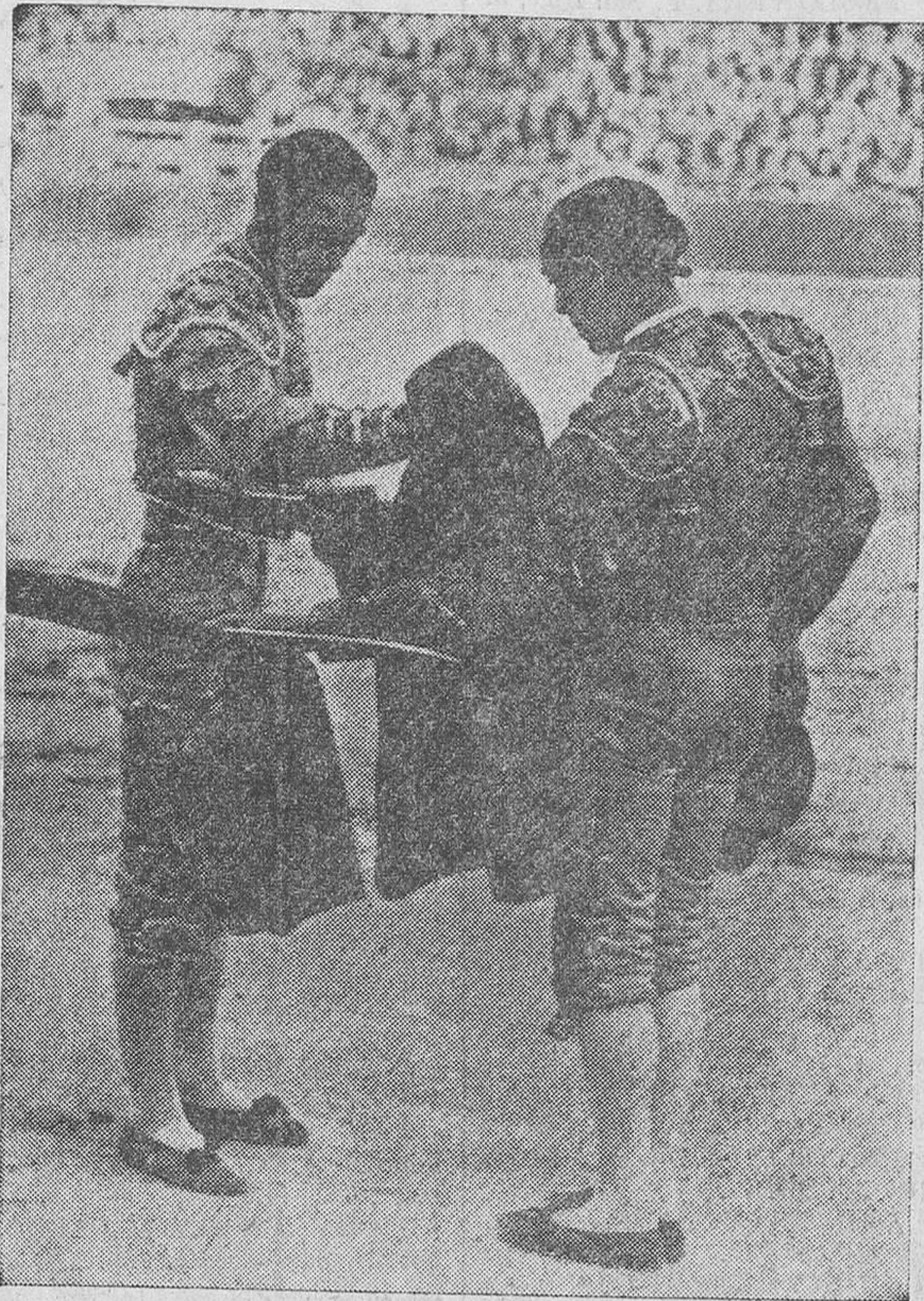
El Estudiante, que ayer se doctoró ante el público valenciano

Tardó de responsabilidad para El Estudiante la de ayer. Salió a