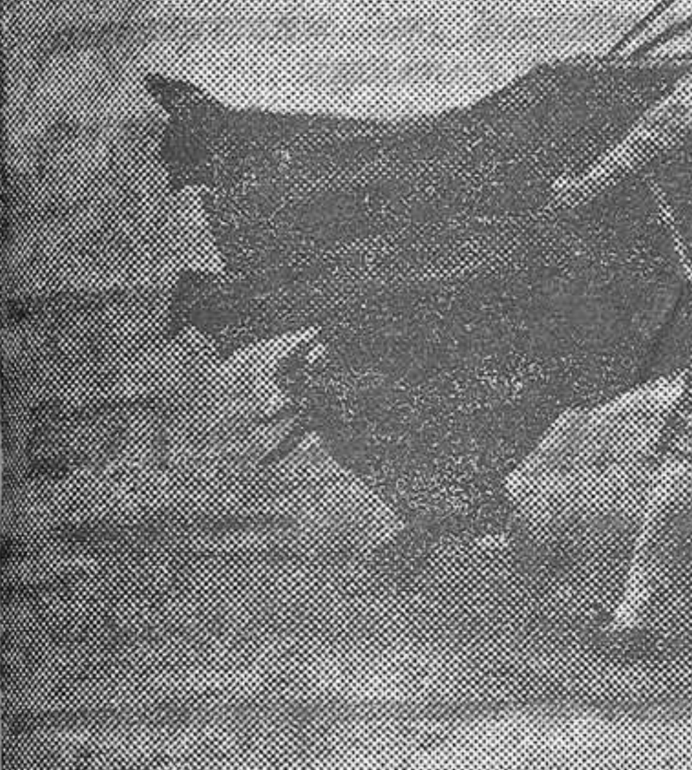
Marcial pasando de muleta al primero