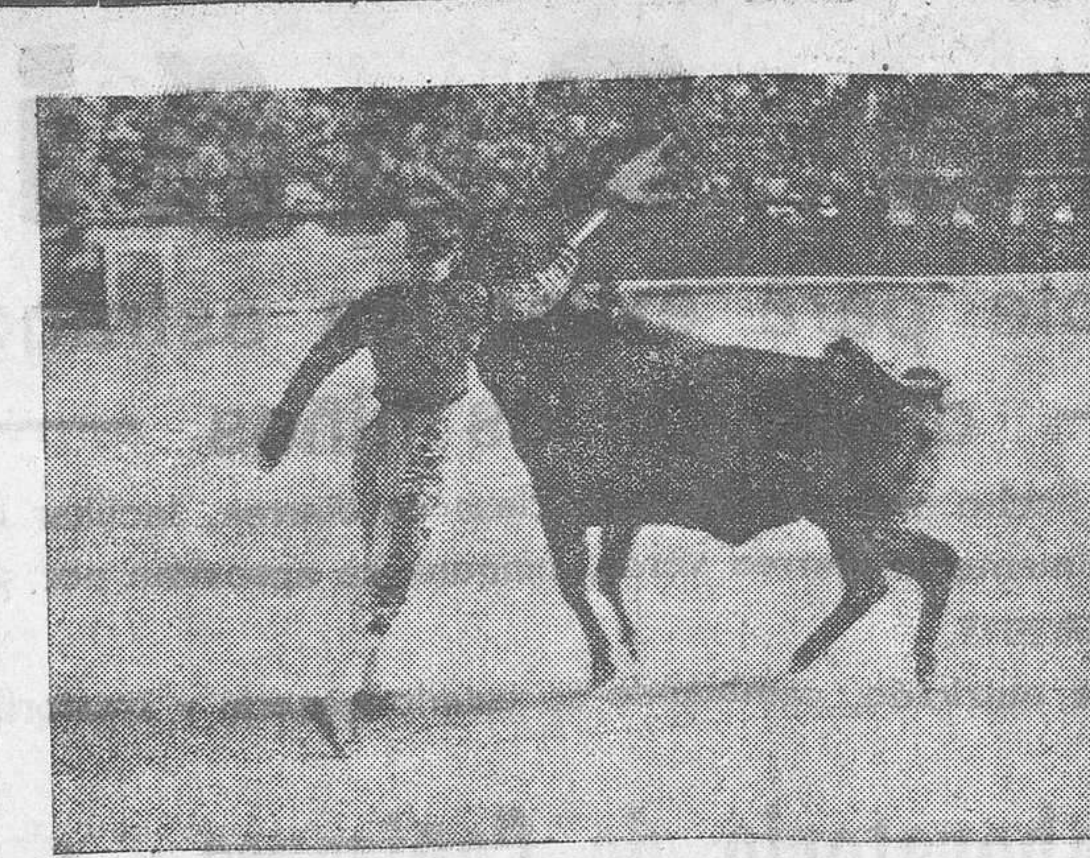
Barrera en su primero

En las plazas no permanentes. Art. 108. Los lugares que de mangra provisional se habiliten