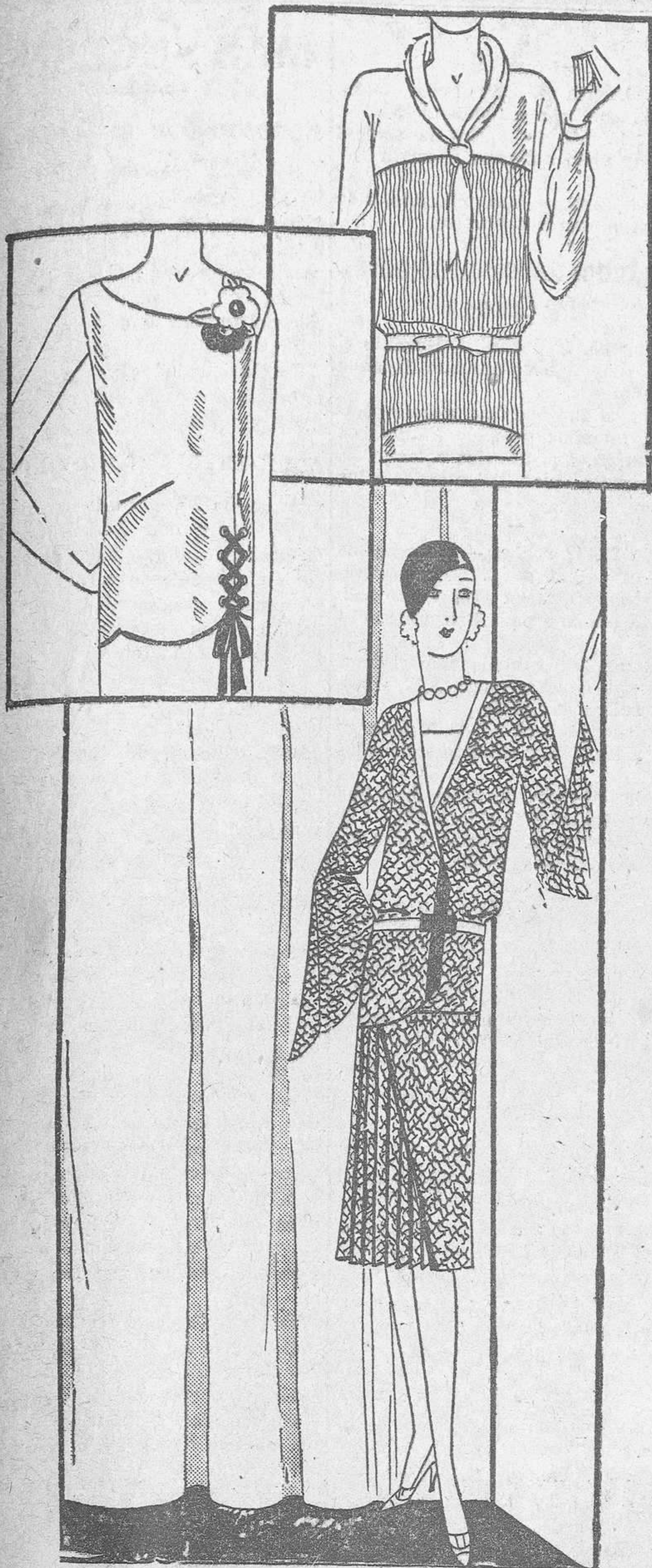
UNAS COMBINACIONES DE TRAJES DE MANANA