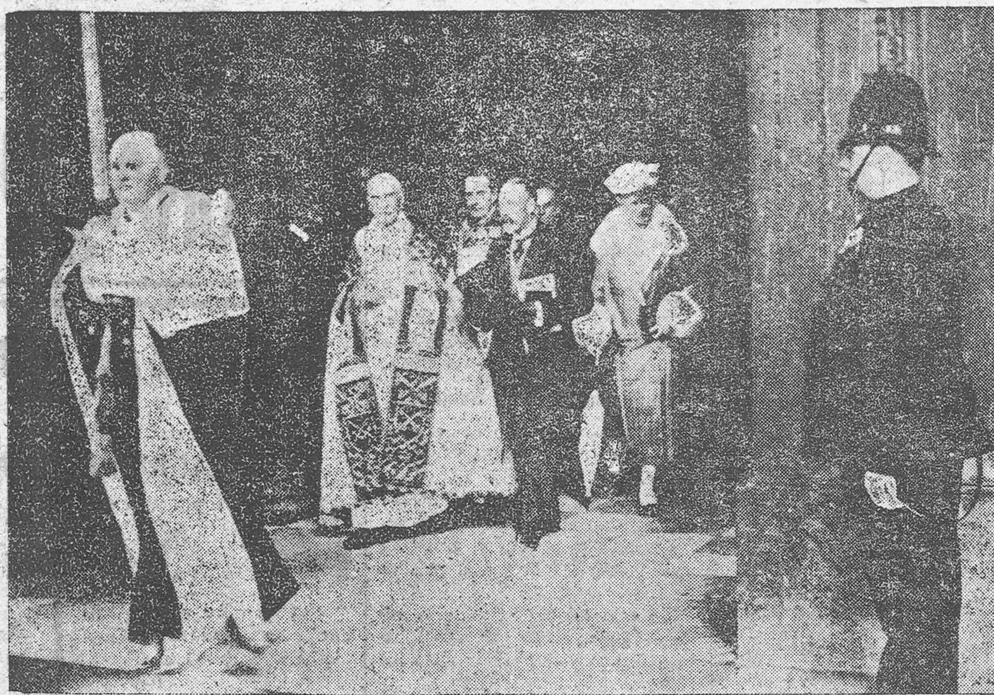
La soberbia catedral de San Pablo, de Londres, ha sido restaurada. Al abrir sus puertas nuevamente al culto, los primeros en acudir han sido los soberanos ingleses, que aparecen en esta fotografía