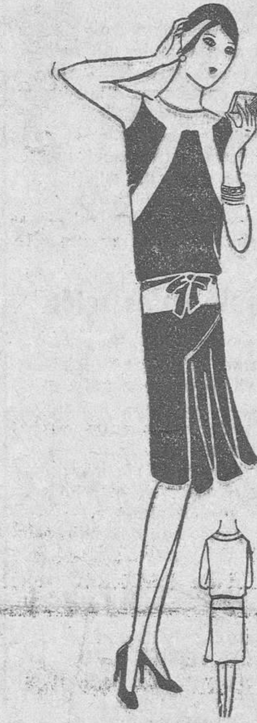
UN SENCILLO Y ELEGANTE TRAJE DE MANANA

El decorado del comedor varía infinitamente, según el gusto y la posición de cada uno; deben preferirse las pinturas frías, sin brillo, los colores neutros y las tapicerías que representen flores, plantas o escenas de la vida campestre, y lo mismo los cuadros.