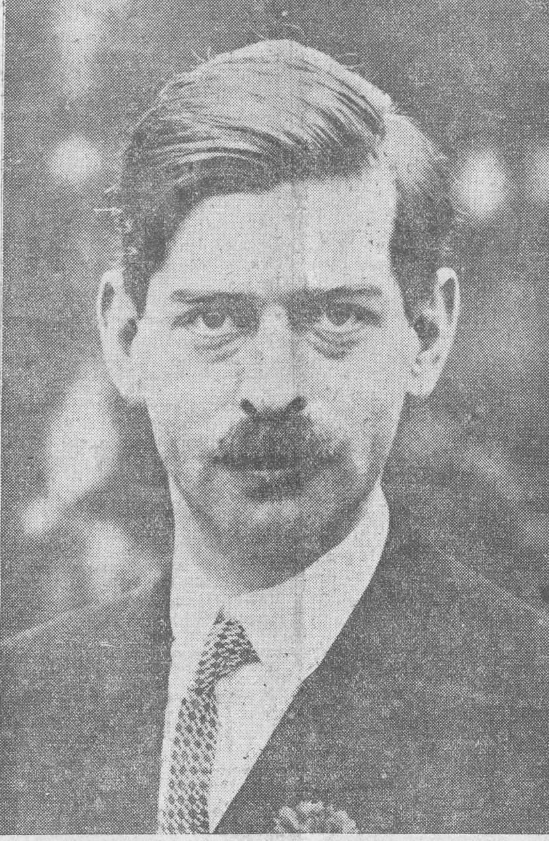
EL PRINCIPE CAROL DE RUMANIA, QUE HA SIDO ELEVADO AL TRONO POR LAS CAMARAS, DESPUES DE LAS VICISITUDES POLITICAS QUE HA ATRAVESADO Y QUE FUERON DURANTE MUCHO TIEMPO LA NOTA INTERESANTE DE LA POLITICA INTERNACIONAL