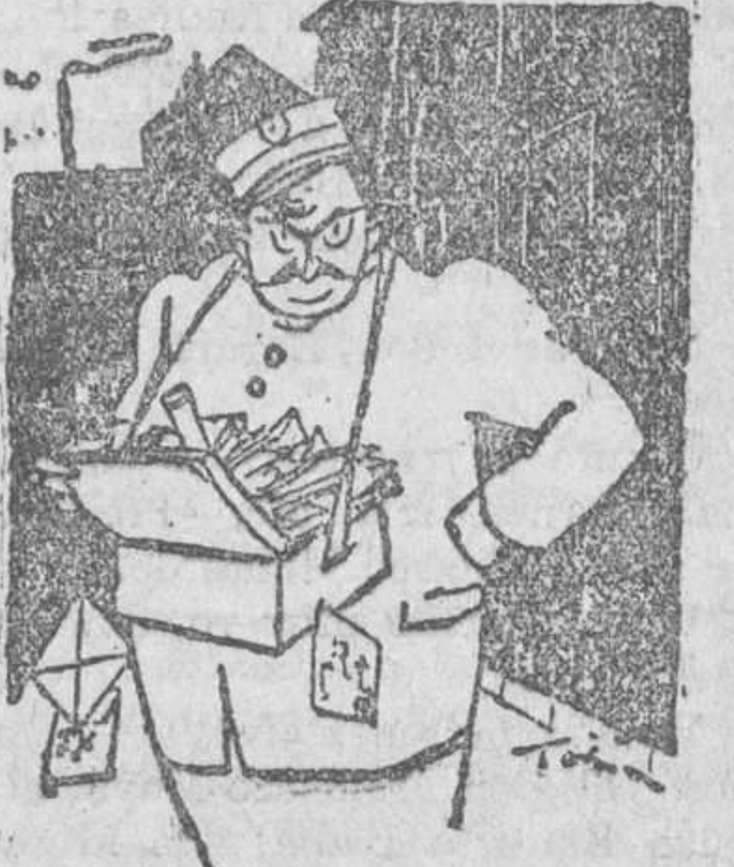
El cartero.—Y decir que hace lo menos seis meses que no recibo una carta!

Durante la gran guerra, y en uno de los sectores más tranquilos donde jamás se oyeron silbar las balas, llegó un nuevo comandante, quien comenzó a efectuar una revisión minuciosa del archivo, separando gran cantidad de