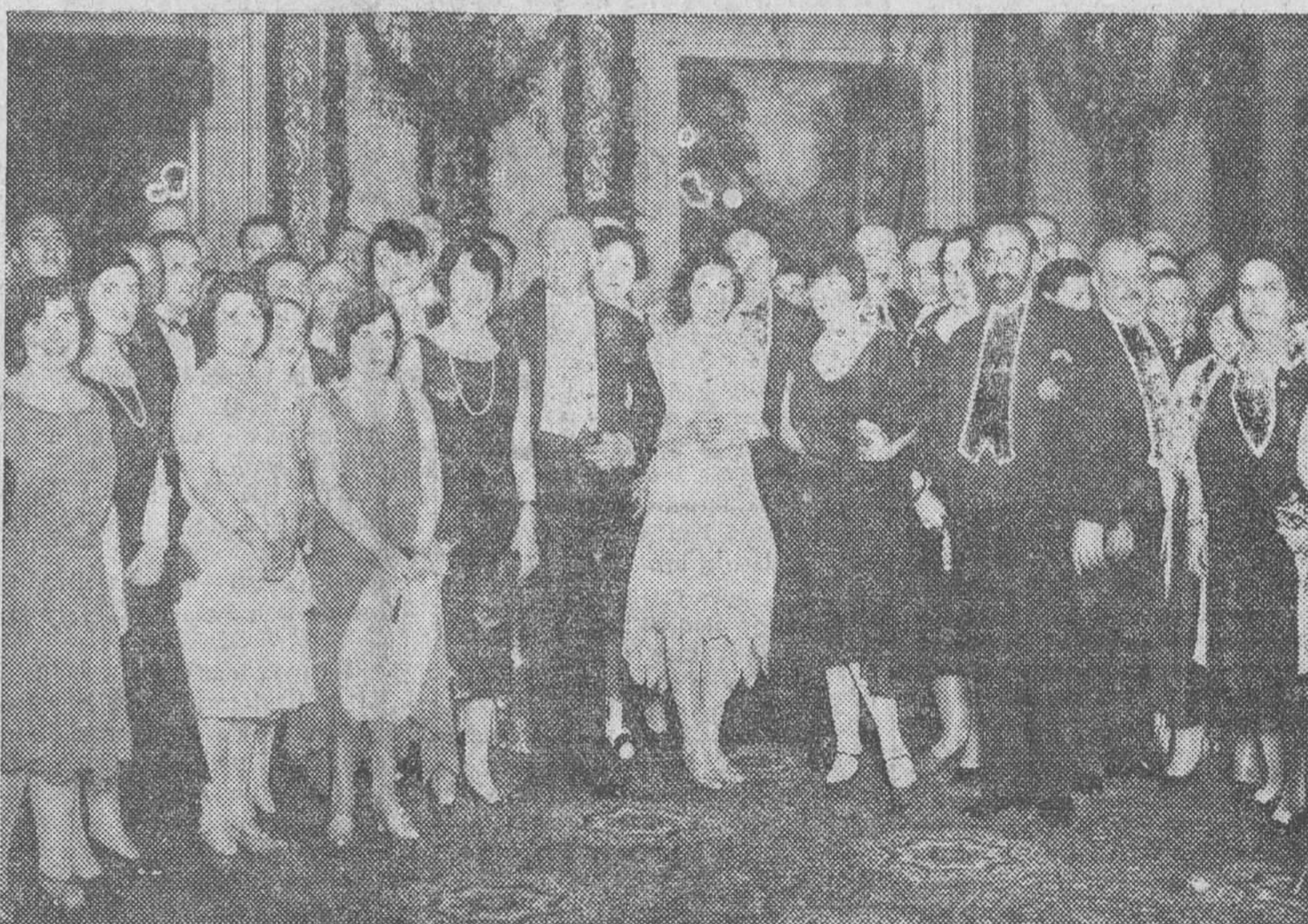
Recepción celebrada en el Ayuntamiento de Madrid en honor de los delegados extranjeros y sus familias con asistencia del jefe del Gobierno