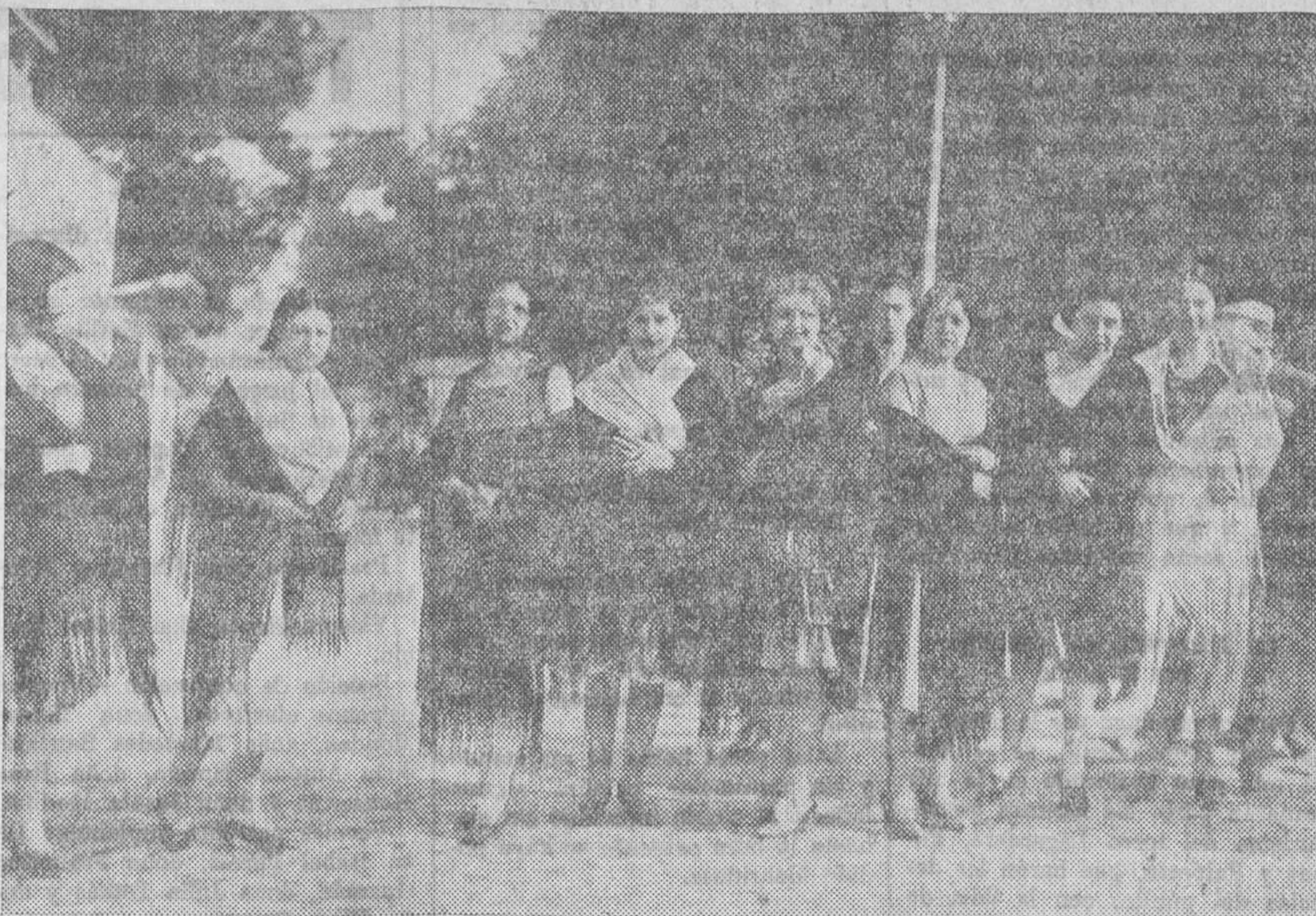
Lindas modestillas luciendo el clásico mantón de crespón madrileño en las fiestas dedicadas a San Antonio de la Florida