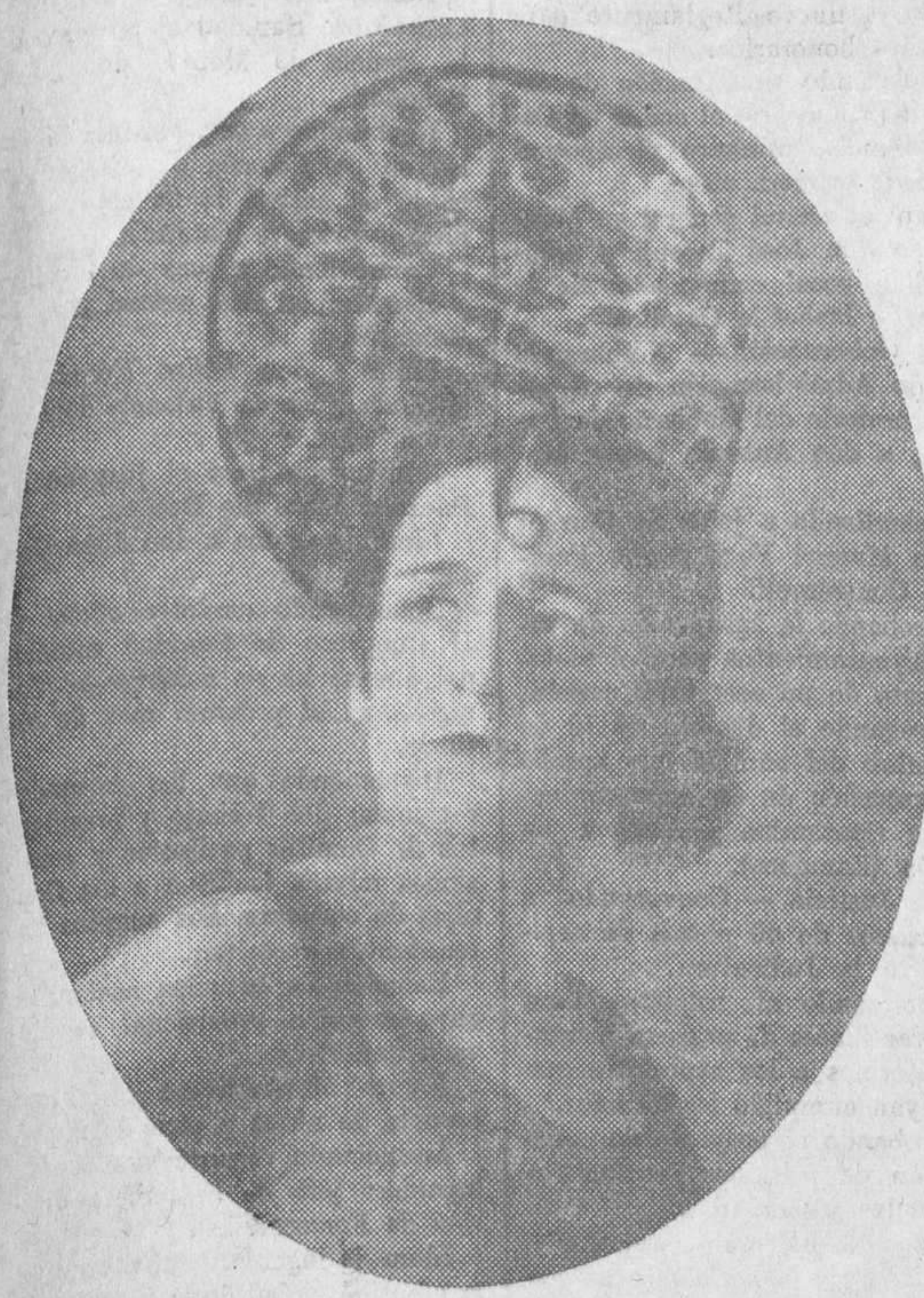
La distinguidísima actriz que en el escenario de la Princesa acaba de renovar sus éxitos en Valencia