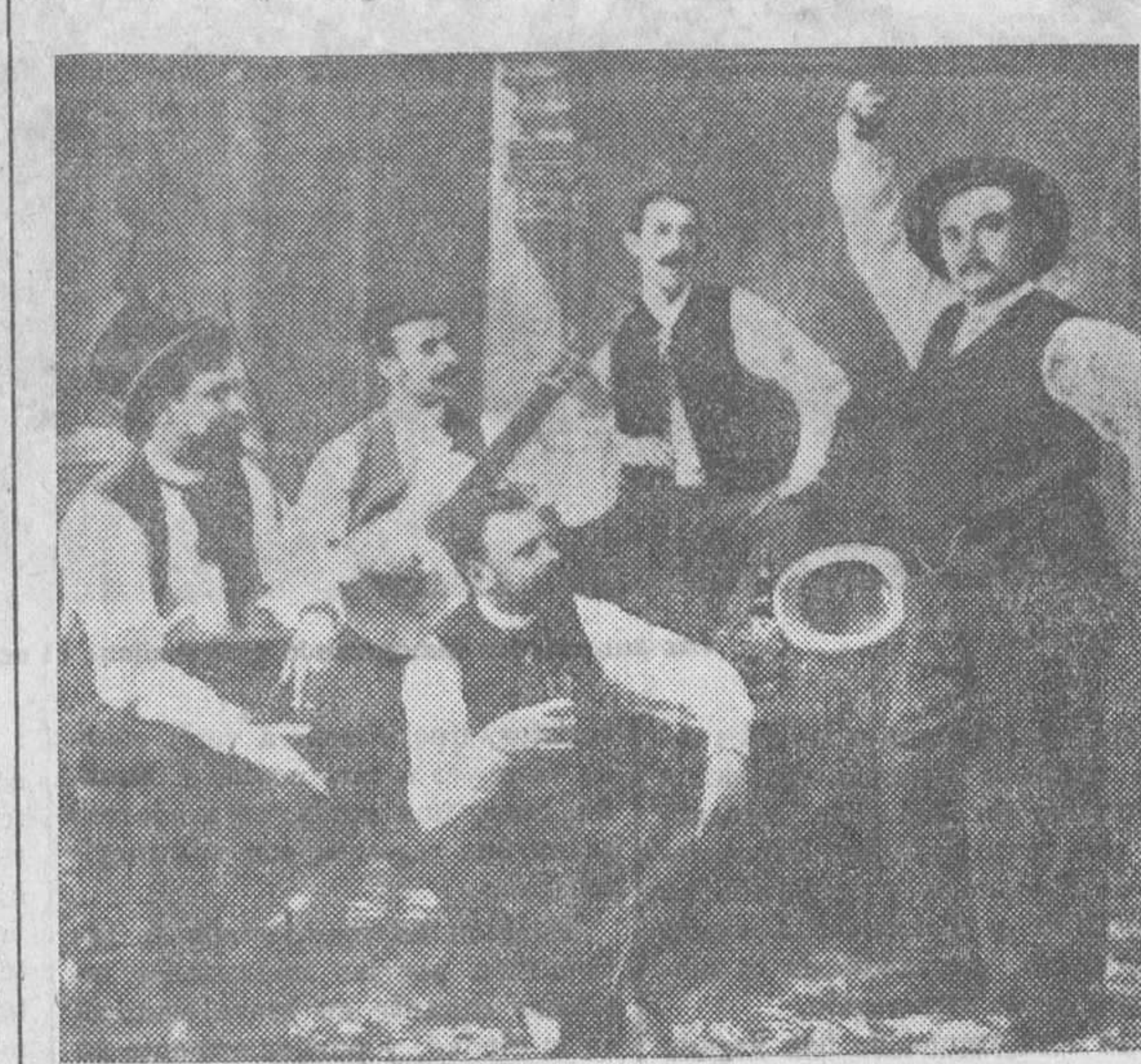
De izquierda a derecha: Felipe Pérez y González, el popularísimo cronista de «El Liberal» y autor de «Cádiz»; el que toca la guitarra, Julián Romea, el eminentísimo actor; el que está sentado bebiendo, Joaquín Valverde (padre), el celebradísimo compositor; el del bastoncito y la boca abierta, el gran actor Pedro Ruiz de Arana, y el que está bailando, es nada menos que don Federico Chueca, el autor de «La Gran Vía»

Han pasado muchos años. Fué en 1886, 2 de julio, cuando se estrenó la celebradísima obra, modelada de revistas, titulada «La Gran Vía».