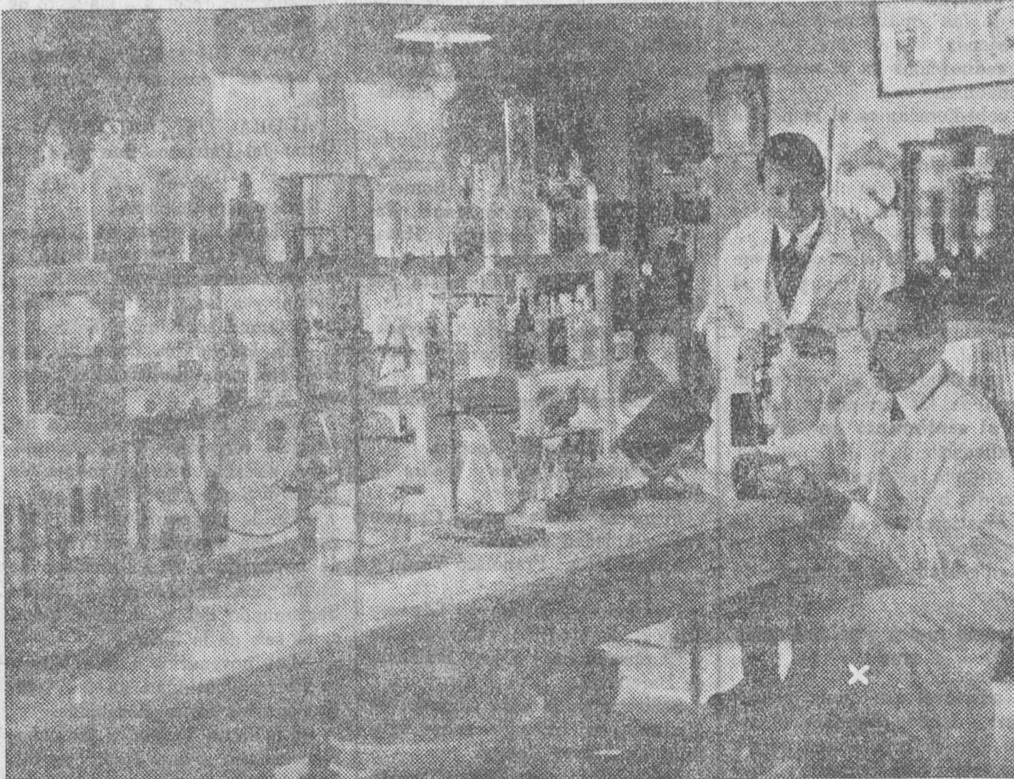
EL CELEBRE DOCTOR VORONOFF EN SU LABORATORIO QUE HA INSTALADO EN MENTON