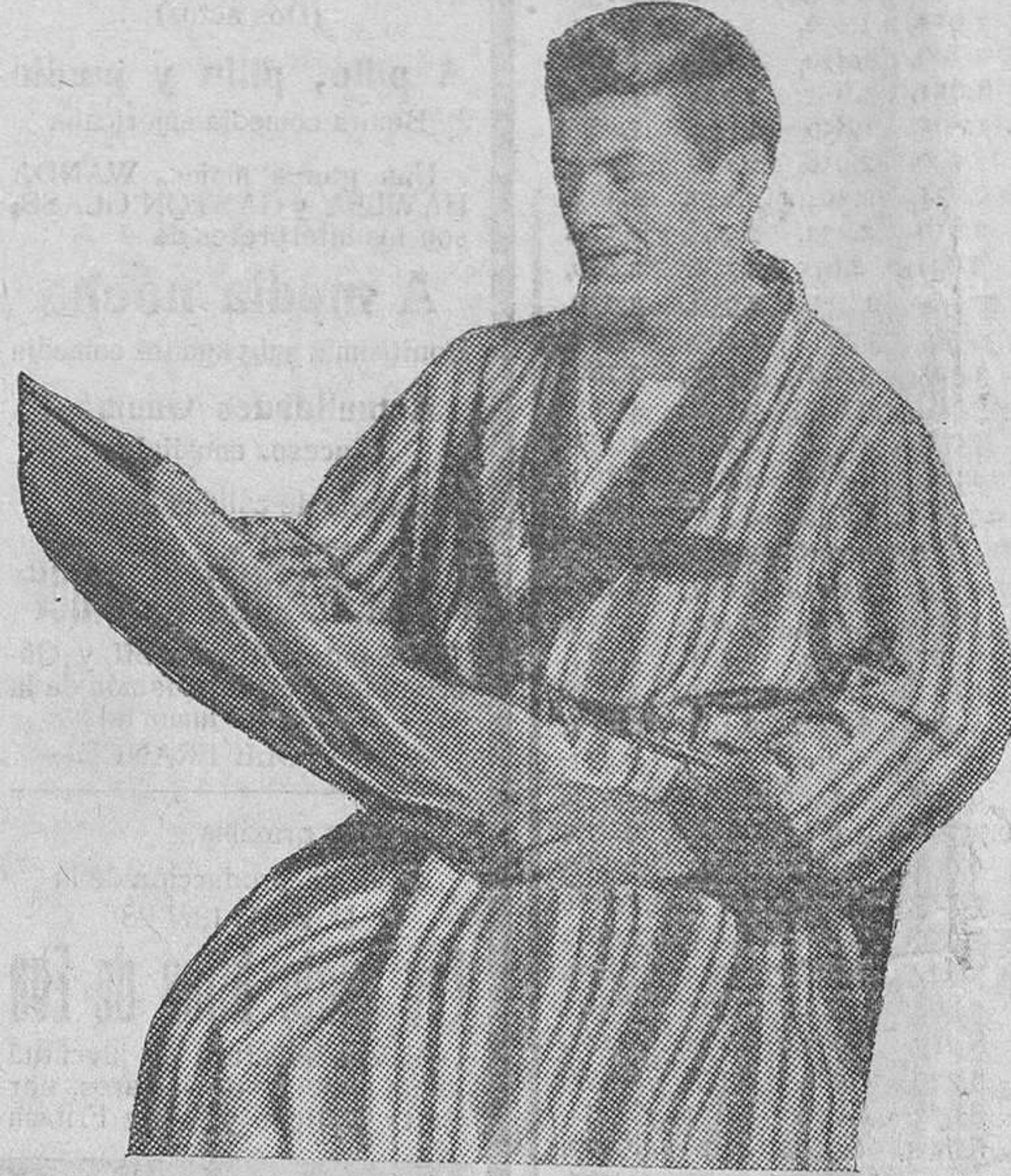
Aquí tienen a Gene Tunney, indiscutible campeón del mundo. La fotografía, quizá sin quererlo, es simbólica. El pígil de los músculos de hierro aparece en actitud doméstica, sencilla, atenta, propia de un varón que, a pesar de ser fuerte, gusta de la urbanidad y cultiva la inteligencia.

(Información retransmitida por la Agencia Mencheta)