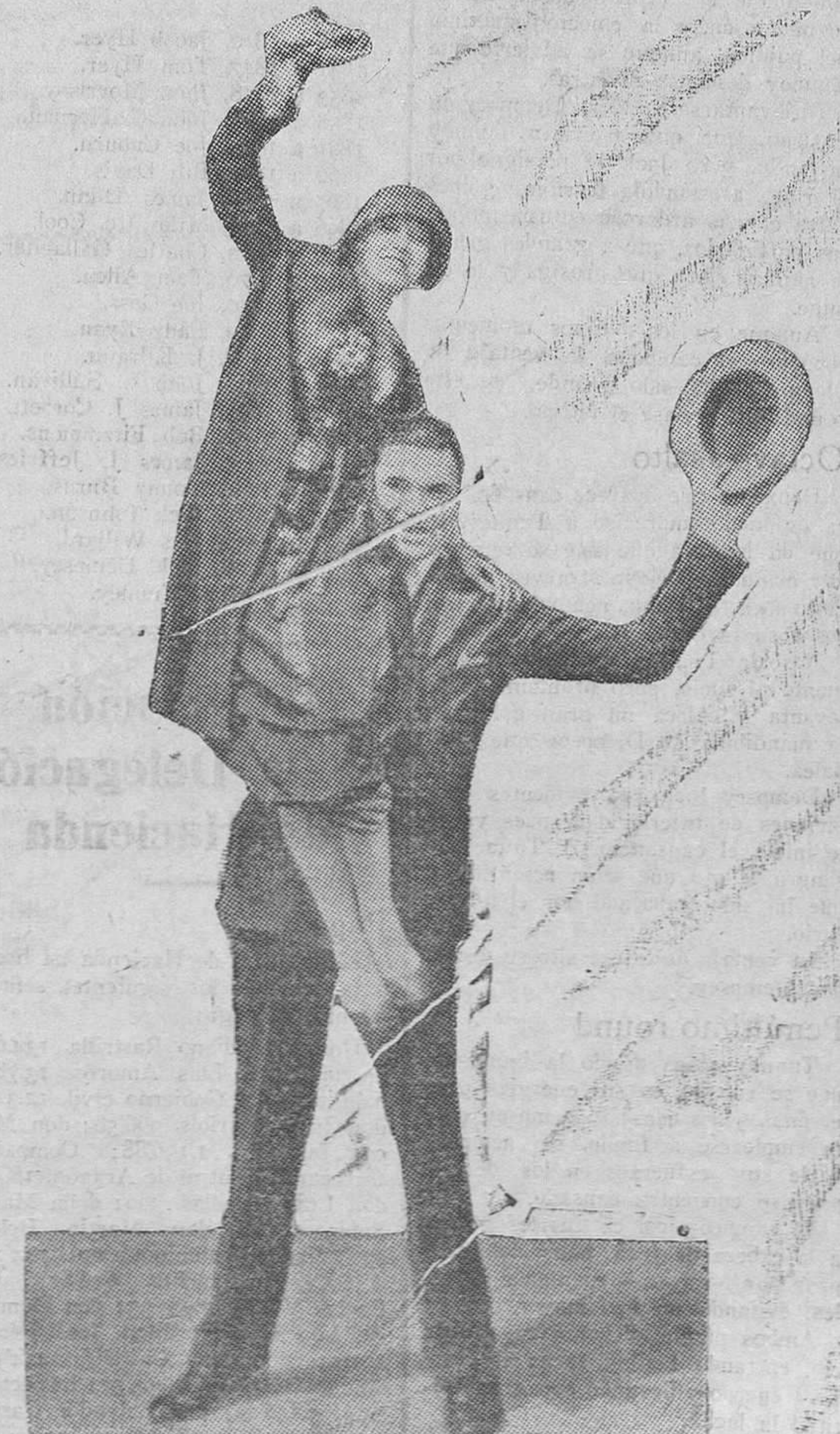
Aquí tienen ustedes a Jack Dempsey, el excampeón caído por segunda vez. La fotografía, quizá sin quererlo, es simbólica. No hay en ella algo desmesurado, algo anormal, algo pelucero? Pelucero es, a ratos, Dempsey; pelucera es su mujer, (Estelle Taylor, la que aparece en la fotografía).

Las mejores marcas de cerveza CERVEZA DAMM (dorada) CERVEZA MORITZ (ámbar) MORITZ NEGRA (sin aumento de precio) Se sirve invariablemente fresca en Casa Balanzá