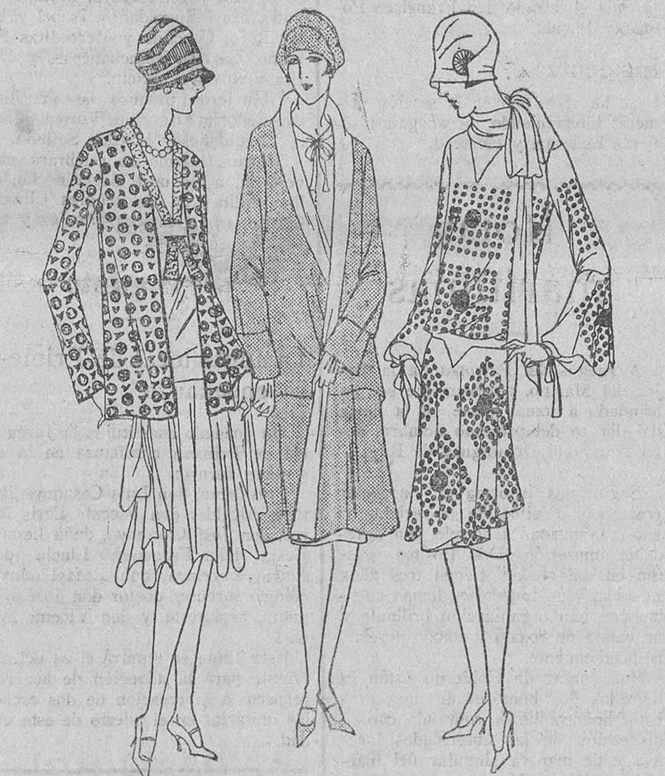
Tres modelos para los bellos días otoñales. I. Traje en crespón Georgette plata, y paletot de lana, al tono; bordado y ribeteado de azul vivo...