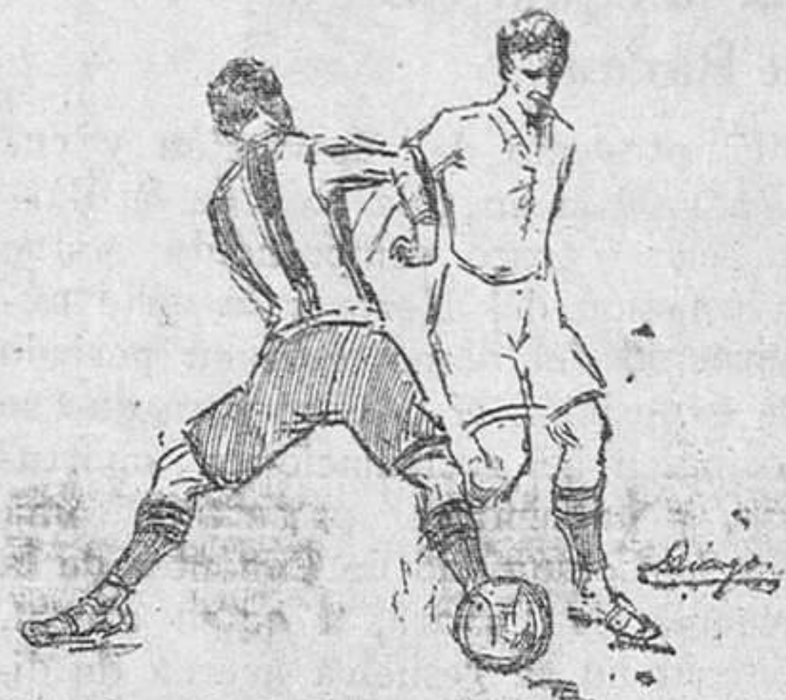
Algo del juego sucio de ayer