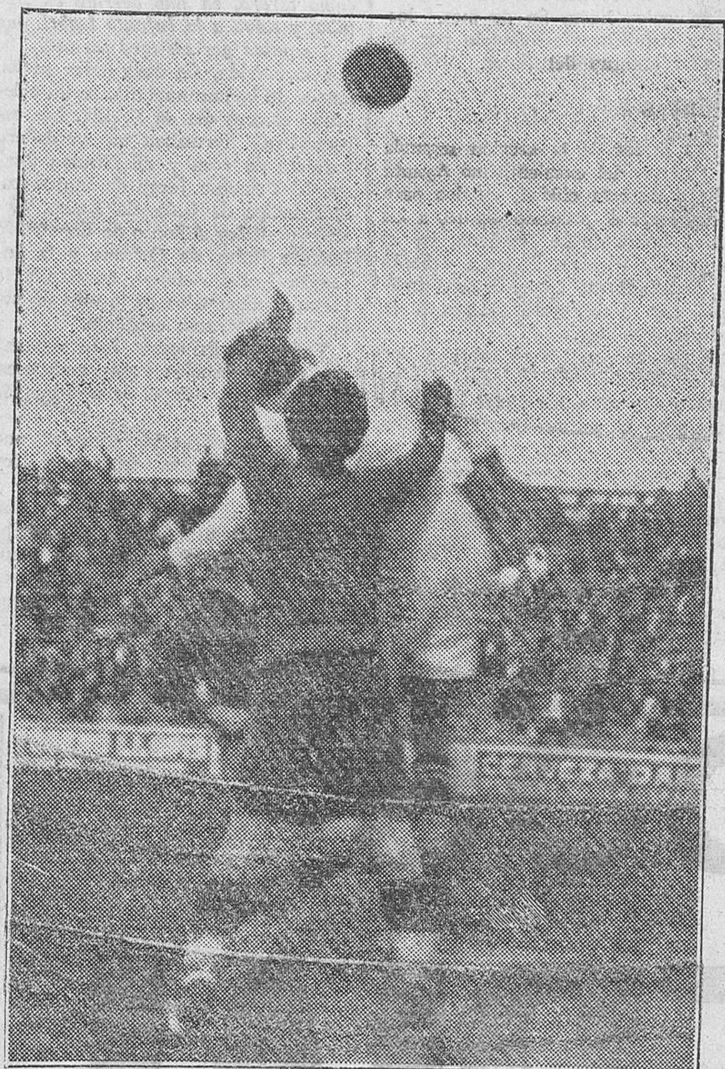
El portero del Gimnástico despeja una situación comprometida

tiempo lo anunciaron los dirigentes del Real, el equipo presentó tan incompleto, que le hacían perder todo el interés que en un principio pudieran crear.