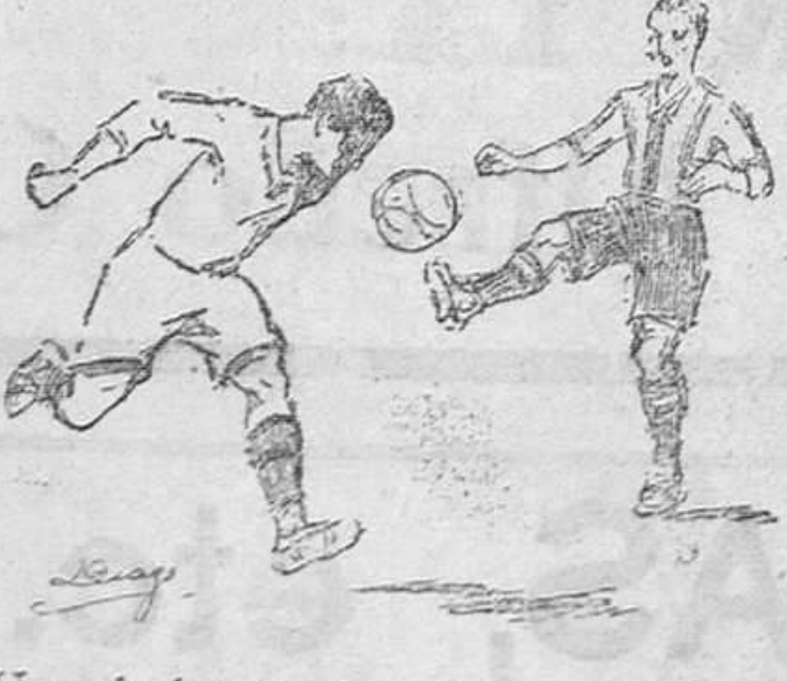
Una de las notables jugadas de Rey

Hay un establecimiento en Valencia titulado El Caos, que ha resuelto el difícil problema del movimiento continuo.