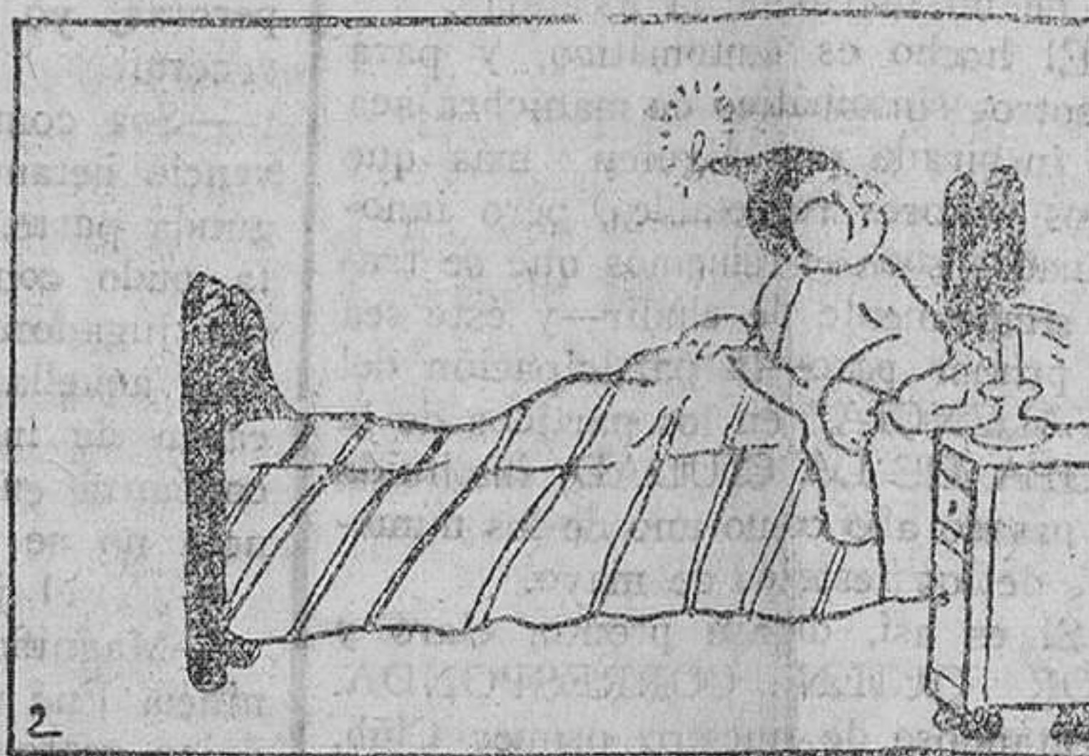
2.—Un súbito resplandor le despertó de pronto, y al no ver la bujía encendida

ro, y el día que ellos me falten, me quedará su fortuna, más que suficiente para mi sustento.