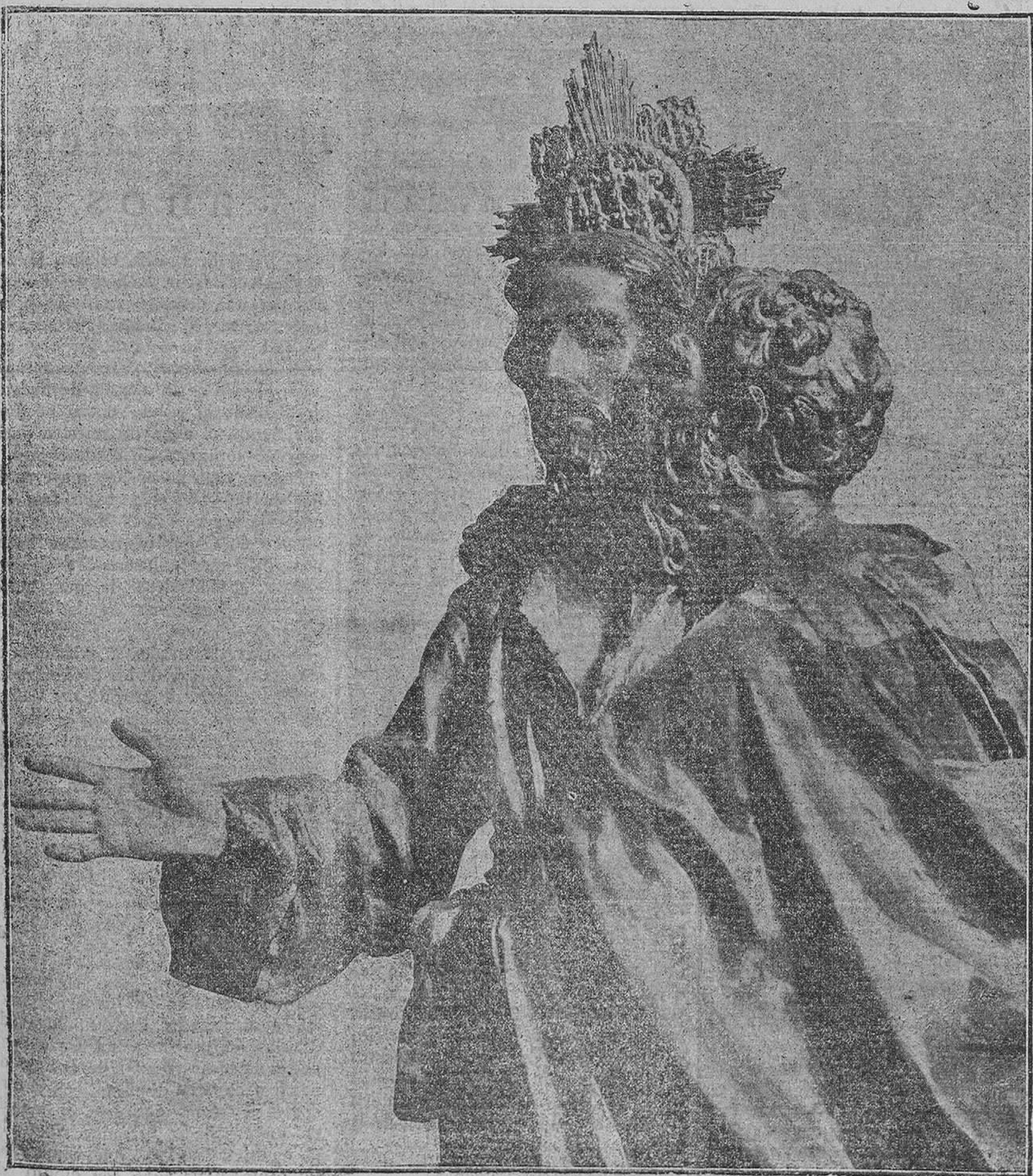
...Y acercándosele Judas, le besó y le dijo: — ¡Dios te salve, Maestro!...