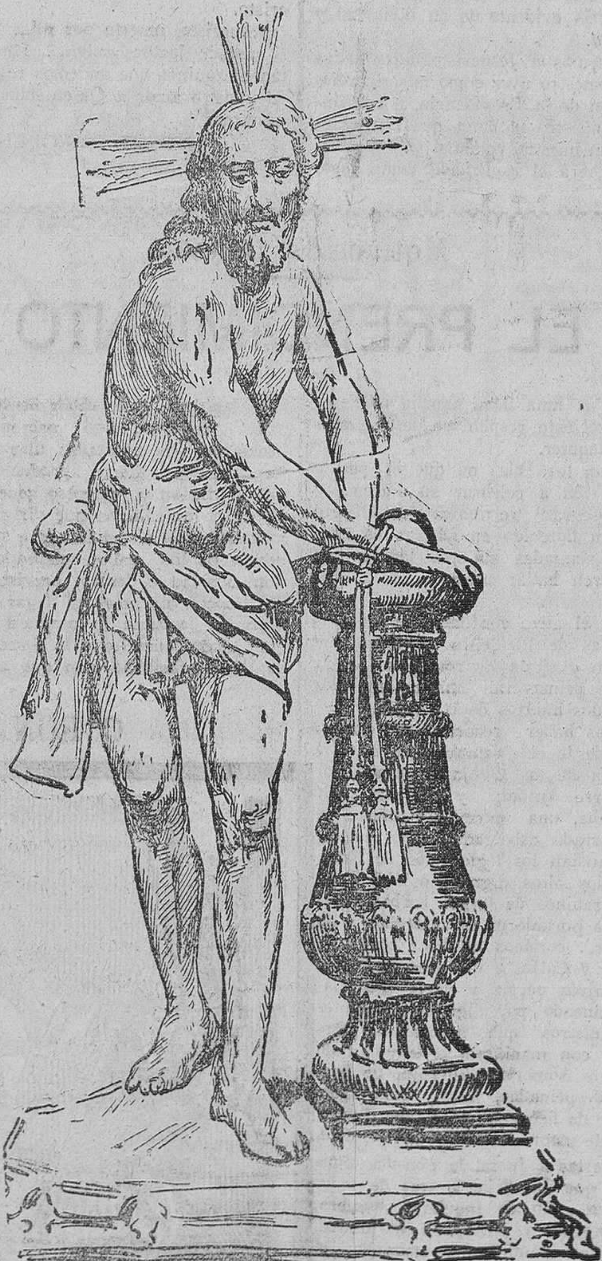
JESUS ATADO A LA COLUMNA

siguiendo el ceremonial de rúbrica, el señor Arzobispo ha hecho a su tiempo la consagración del "Oleo de los enfermos" para el Sacramento de la Extremaunción; el "Santo Crisma", para los Sacramentos del Bautismo, Confirmación, Ordenes y otras consagraciones, y el "Oleo de