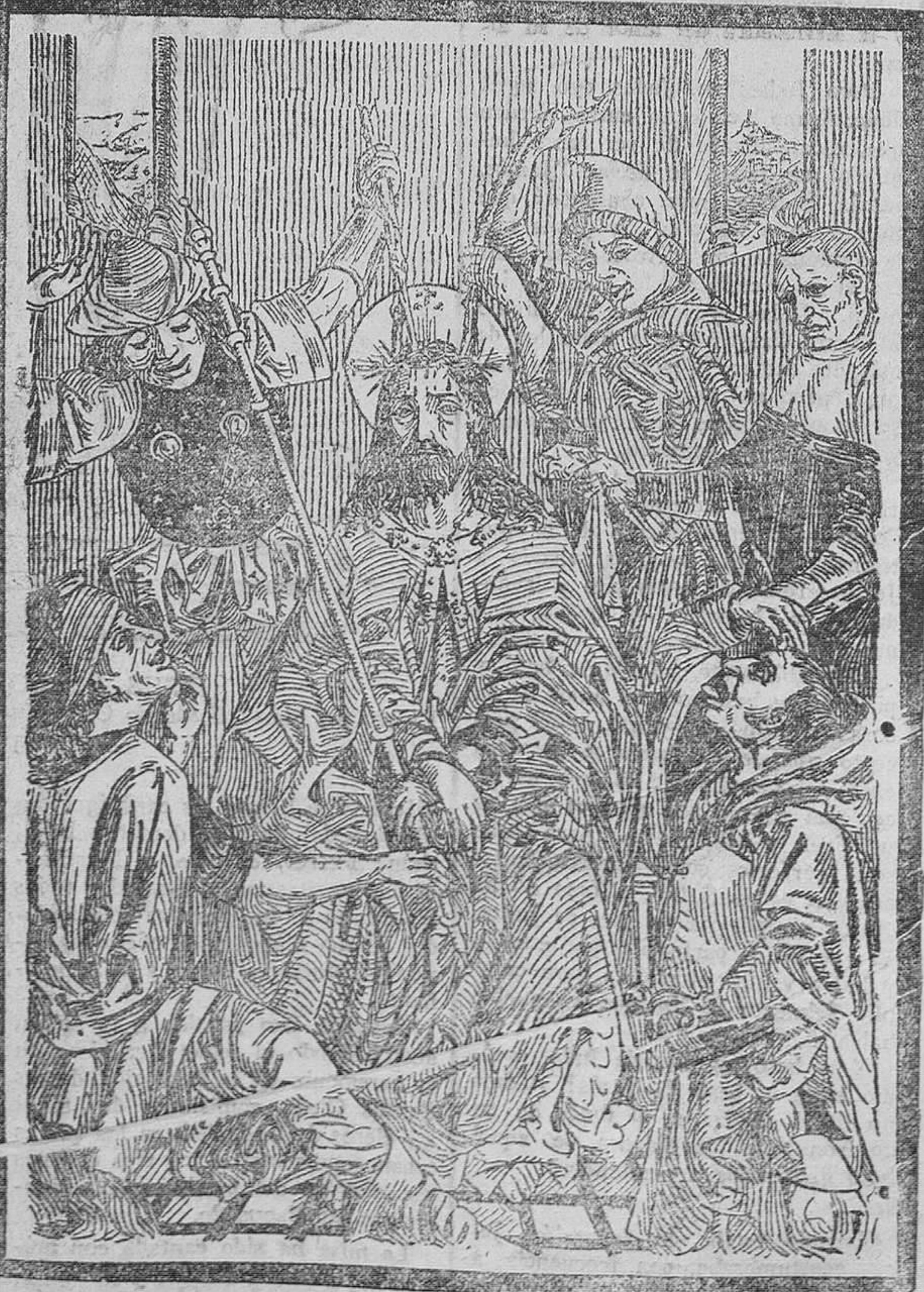
Lienzo del pintor Fernando Gallego, existente en el Museo del Greco, Toledo