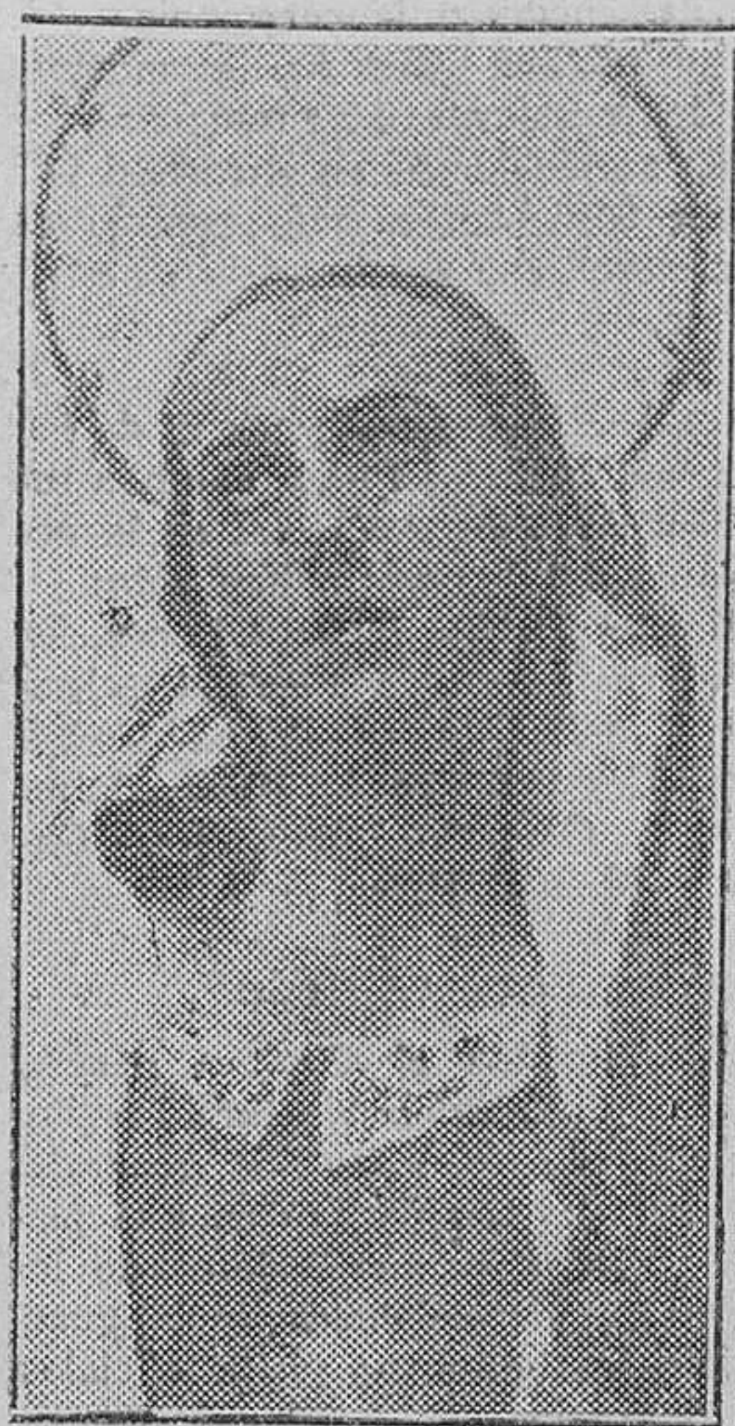
«Una Dolorosa», de Salcillo

Desde tal momento los fariseos captaron al pueblo y le pusieron cantos en el puño, para que lapidasen a Cristo. Y Jesús les preguntó que por qué le apedreaban. Y ellos le respondieron que no le apedreaban por sus obras, sino por sus palabras, por que siendo un hombre mortal, se llamaba Dios a sí mismo. Y Jesús reclamado de tales reconvenções, respondióles con pregunta en verdad sencilla: "¿Pues no dicen los Salmos que somos los mortales sin excepción hijos de Dios?"