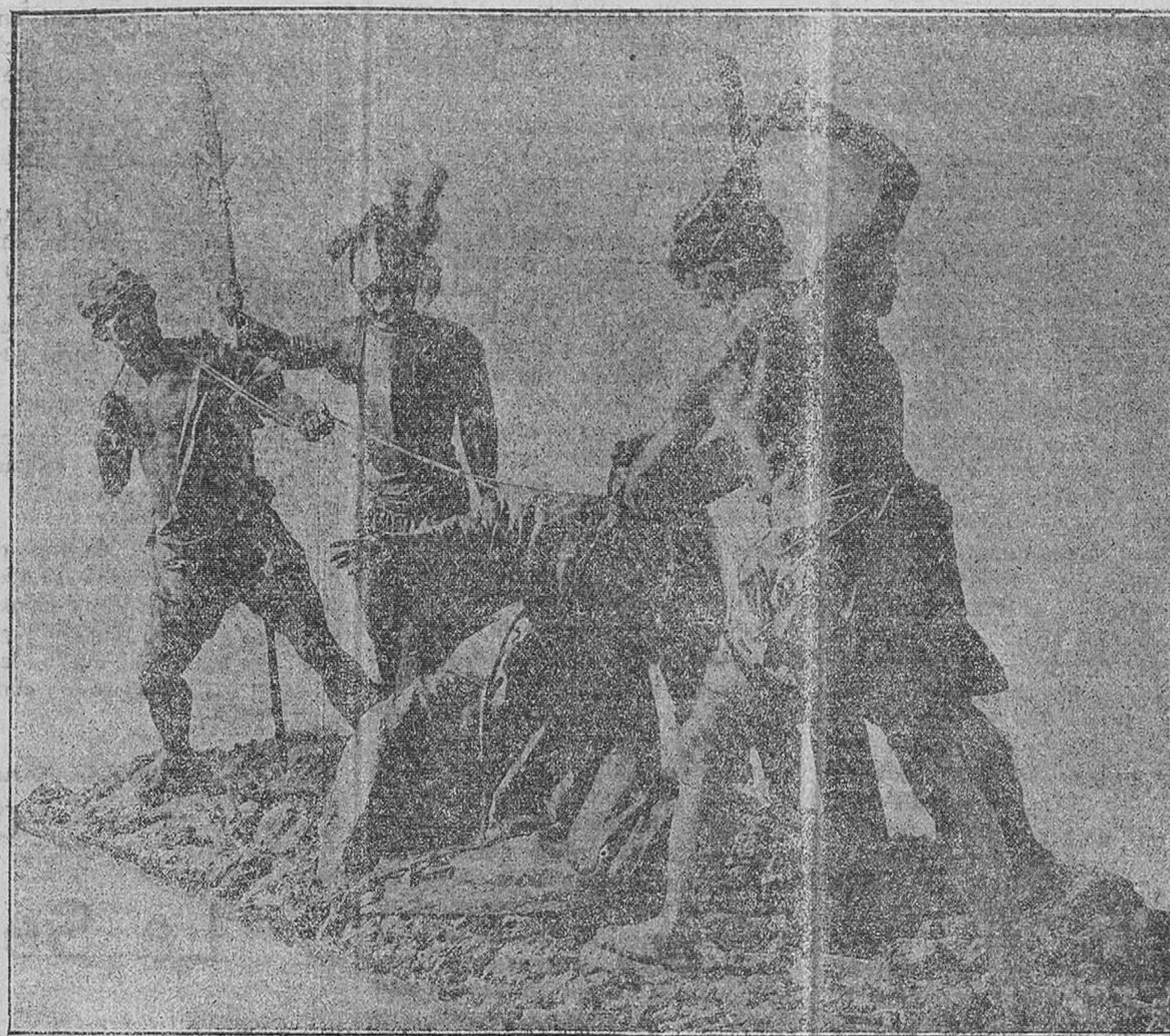
Caída de Jesús

Era necesario, era indispensable, que para poner mano en El, El mismo les diese su autorización, y así reitera nuevamente su pregunta, que es ahora como el eco del fiat volun-