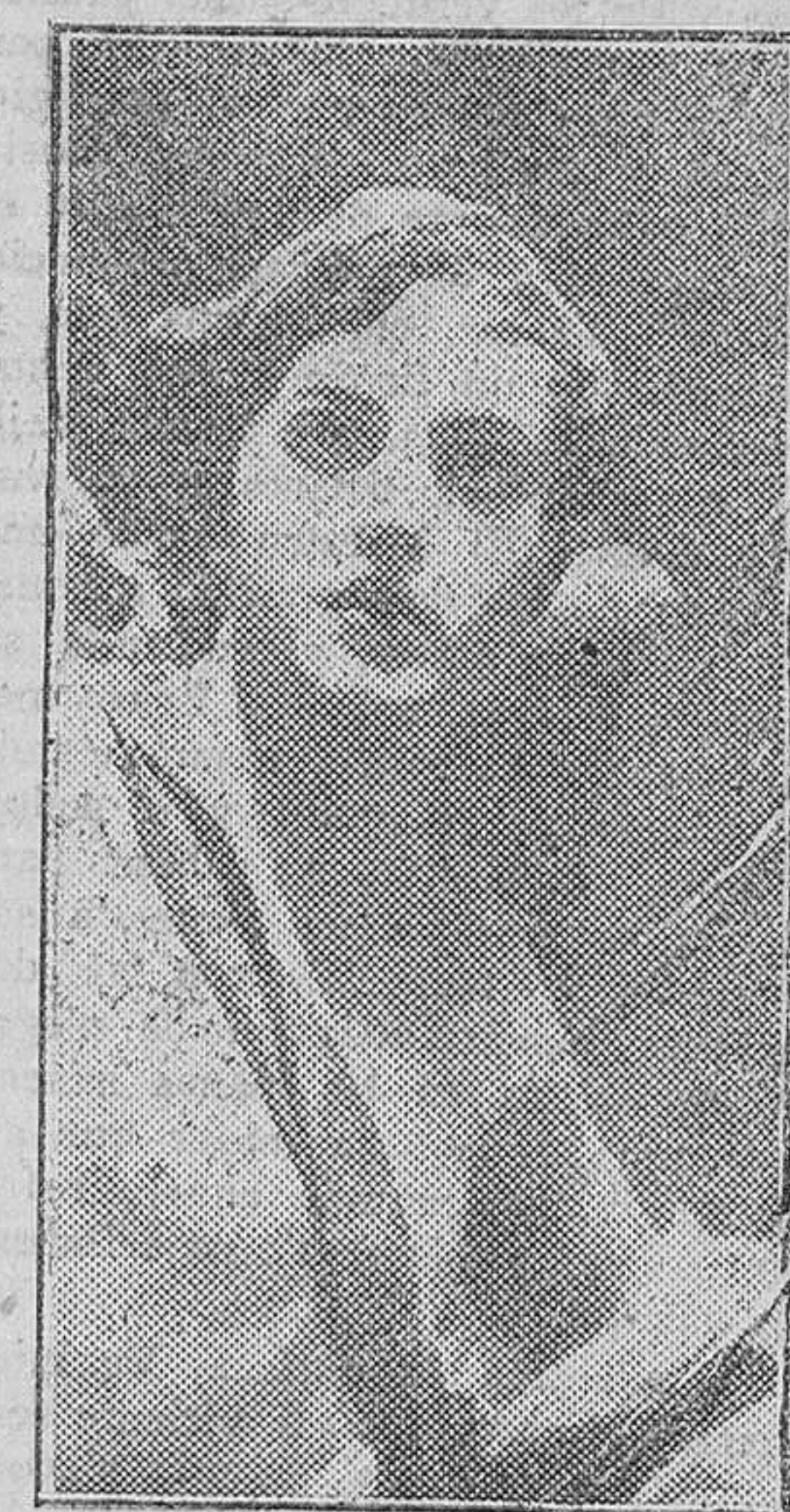
«Un Angel», de Salcillo

Se entregaba; su palabra era, como siempre, luz para los espíritus, aun para aquellos poseídos por el Malo. «Es vuestra hora». Luego no intentaría defenderse, no iba a huir, no se le escapaba. Horas después, ante aquella parodia de juicio a que se le sometía, El sabría plasmar aquellos temores colectivos de las