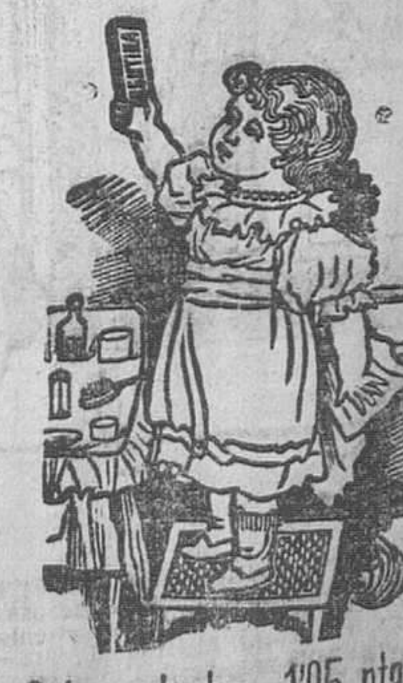
Caja-estuche, 1'25 ptas.