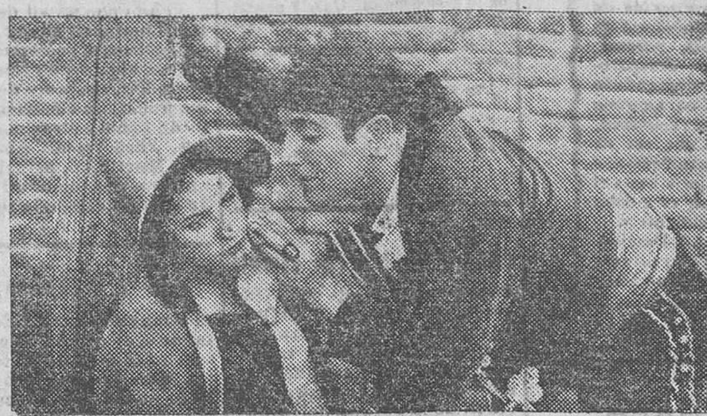
Una de las escenas más interesantes de la película «Luis Candelas» que tan brillante éxito ha obtenido