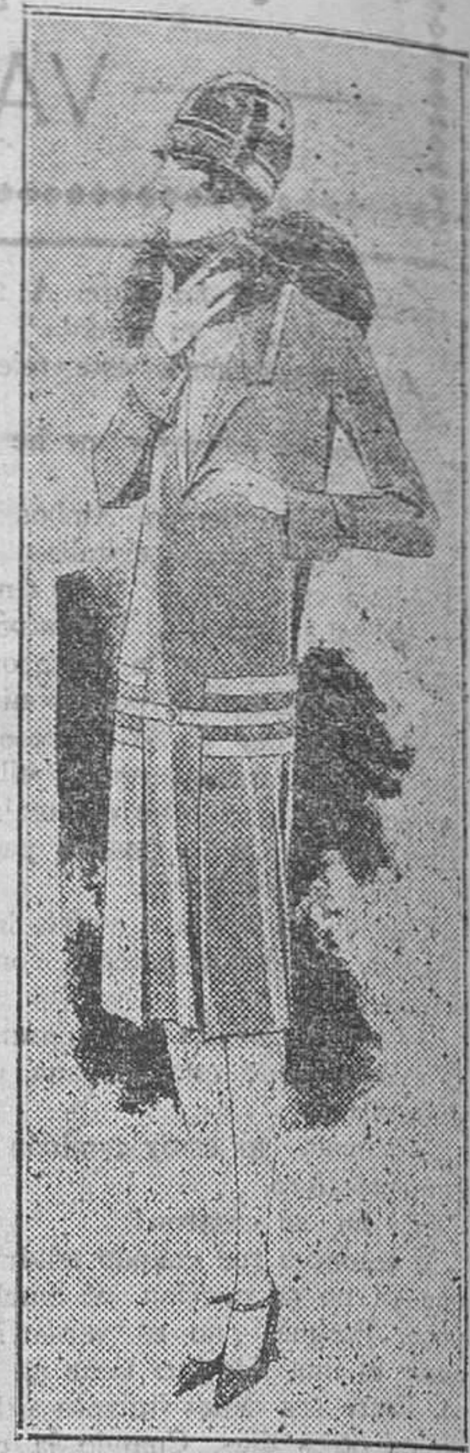
Traje sastrer, gris. Cuello color pastel y adornos rojos

Casi tuvo tiempo para dar la vuelta al mundo. La amante no se dejaba abandonar. Max escribía a Simona tratando de explicarle las cosas. Ella le contestaba en términos que parecían revelar que cada vez entendía menos lo que él le explicaba. Un día fué un telegrama de él a ella así: