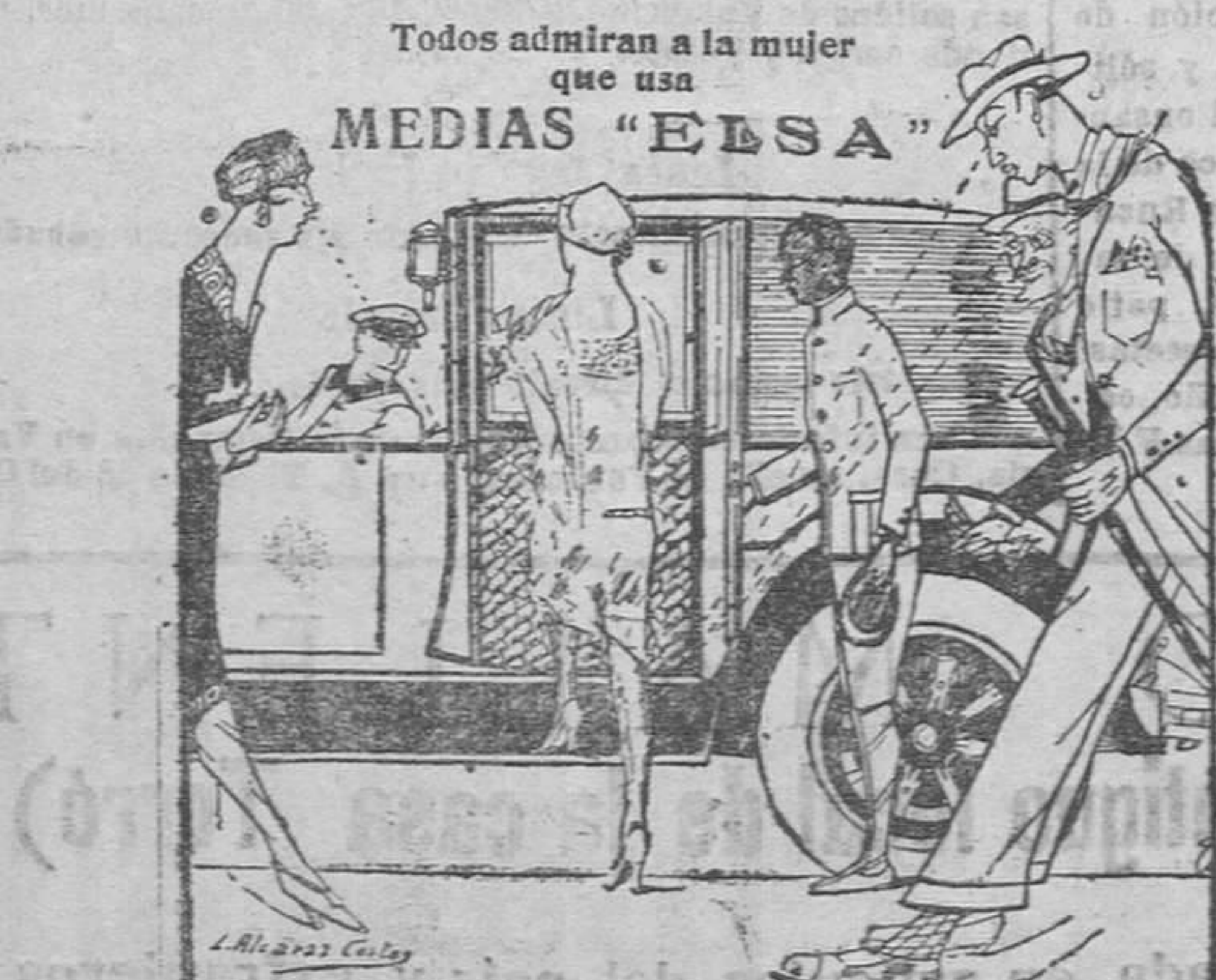
Todos admiran a la mujer que usa MEDIAS "ELSA" ¡ASOMBROSO, INCREÍBLE! Nada de liquidaciones, ni procedentes de quiebra. Grandiosa rebaja de precios, debido a la compra fabulosa de los artículos.—Medias "ELSA", hilo o seda, 3 pías.—Id. ALBI id. id., 2 pías.—Id. seda taradas, 1.—Calcetines seda caballero, 175.—Gran baratura en abrigos lana y seda, y guantes.—Plaza Porcheis, 5 (cortetería).

Venta de pianos al contado y a plazos, desde 50 pesetas mensuales. — Taller de reparaciones para toda clase de instrumentos.