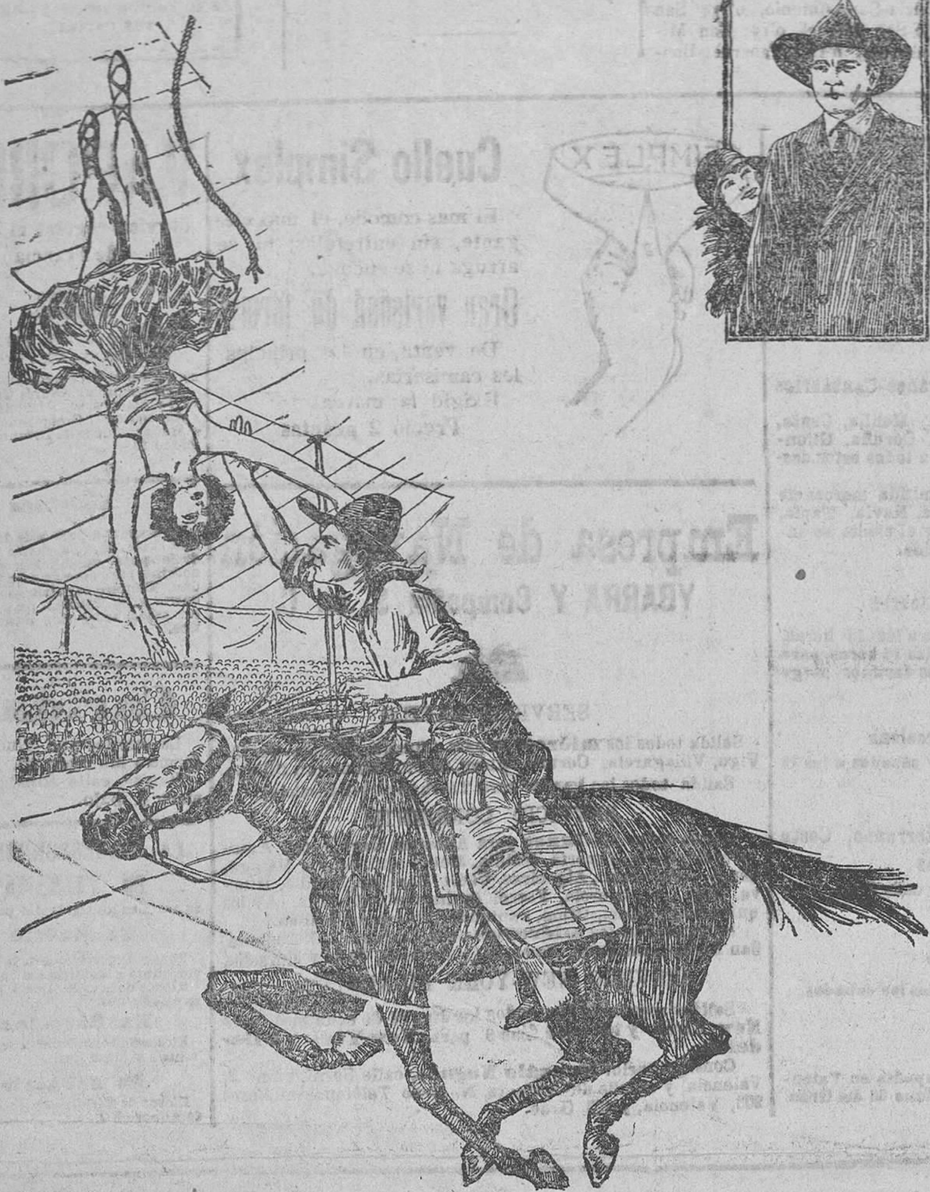
Popular artista que con Tom Mix forman la pareja predilecta de los niños y de los mayores aficionados a las proezas y aventuras de los argumentos de películas americanas

feridos en la pantalla. Tiene en sí un soplo de romanticismo. Os hace pensar en las noches de luna en España y en los acordes de una guitarra resonando debajo de una ventana con rejas.