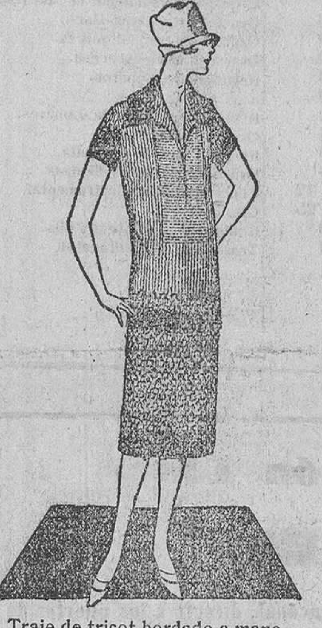
Traje de tricot bordado a mano.

durante cuatro horas; se funde y añá desede, agitando al mismo tiempo, 500 gramos de miel de vaca y 750 gramos de polvo de jabón de Marsella, para que se forme una masa de bastante consistencia que resistirá la presión del dedo. Después de enfriarse la masa, se corta en trozos como el jabón ordinario. COLOCACION DE LOS COMENSALES EN LOS BANQUETES Las personas de la familia deben estar separadas. Presidirá la mesa la señora de la casa, que ocupará el centro del lado que dé el frente a la en-