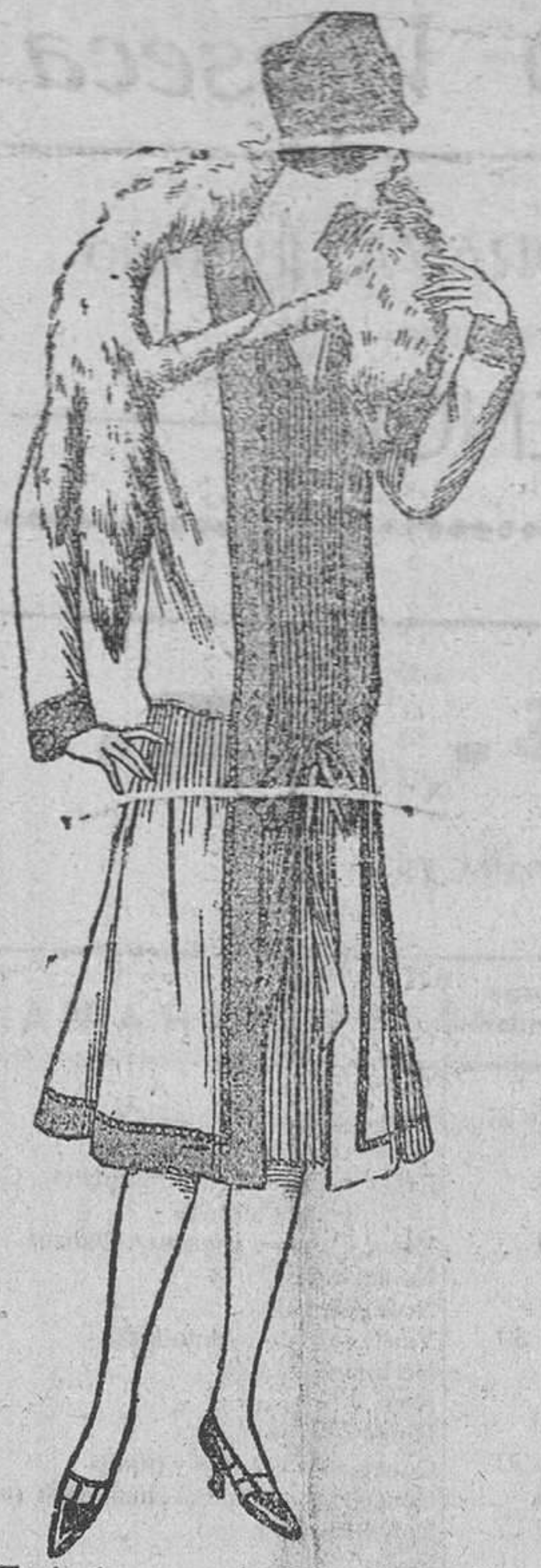
Traje de crepe de China color limón, abierto, con plisados en la parte delantera. Los plisados color azul pálido.