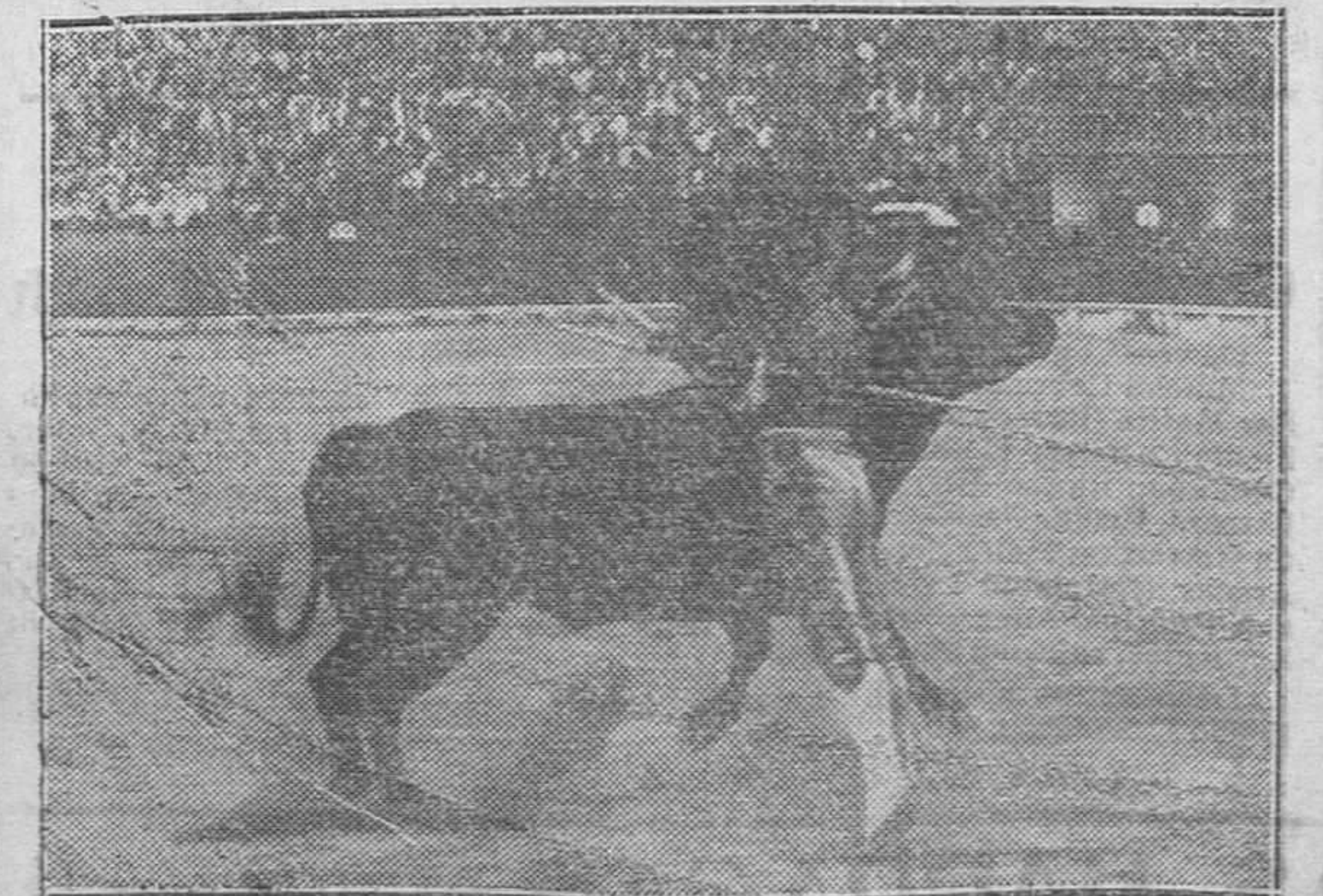
Chaves caído un par por alto de los que merecen jugar las manos

Durante el traslado, condujeron la camilla al Sanatorio los individuos