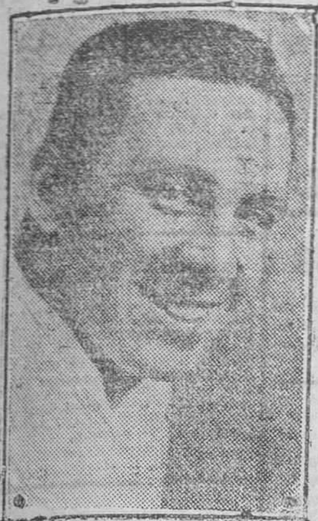
GEORGE O'BRIEN El afortunado artista de fascinadora sonrisa

Hoy mostramos nuestra página cinematográfica publicando el retrato de George O'Brien, el nuevo astro de la Fox, que en tan poco tiempo ha revelado singular talento para el arte mudo.