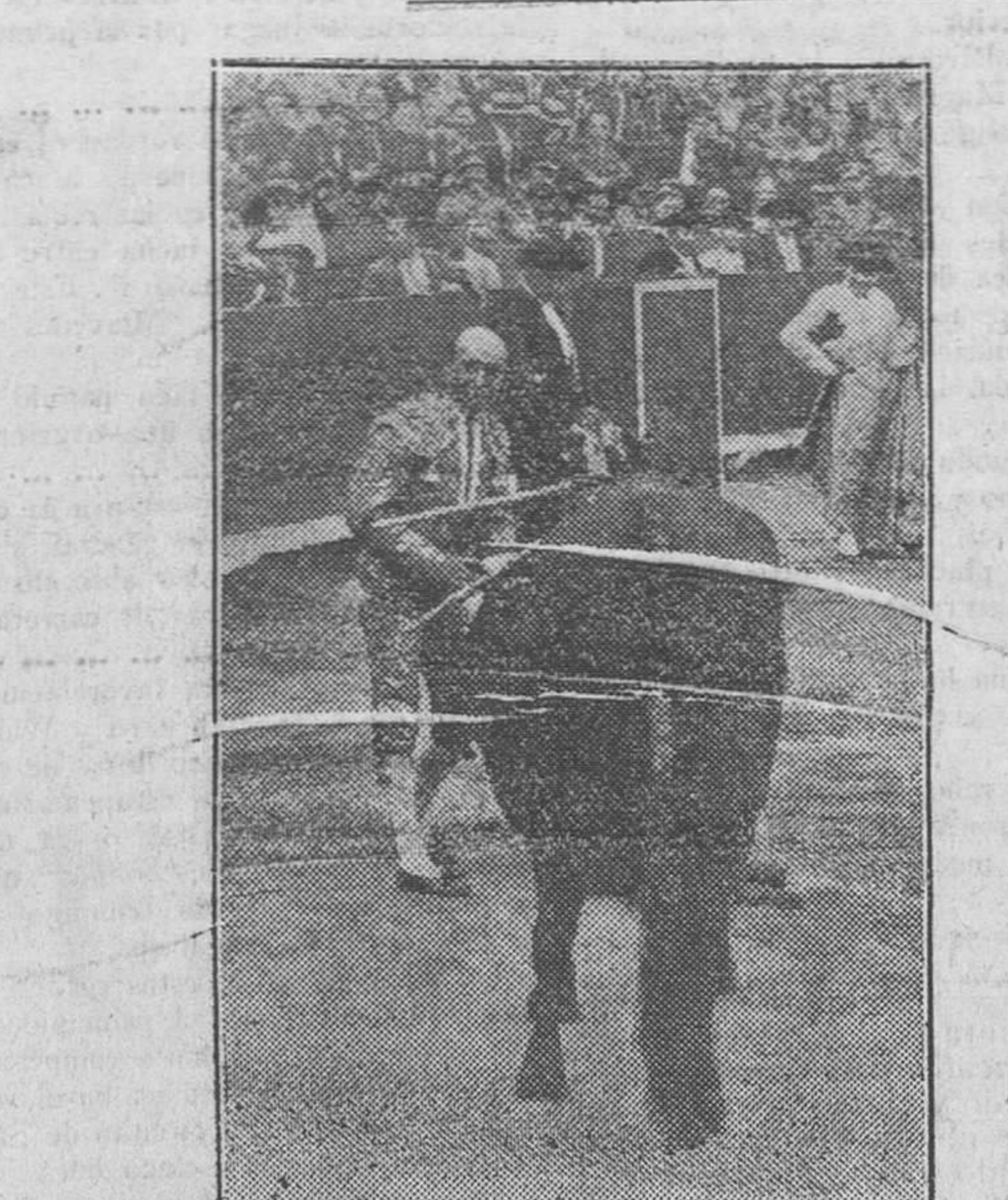
Gallo, pintorero, igualando para matar