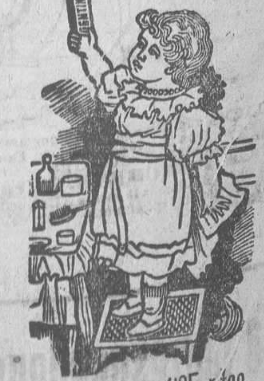
Caja-estuche, 125 ptas.