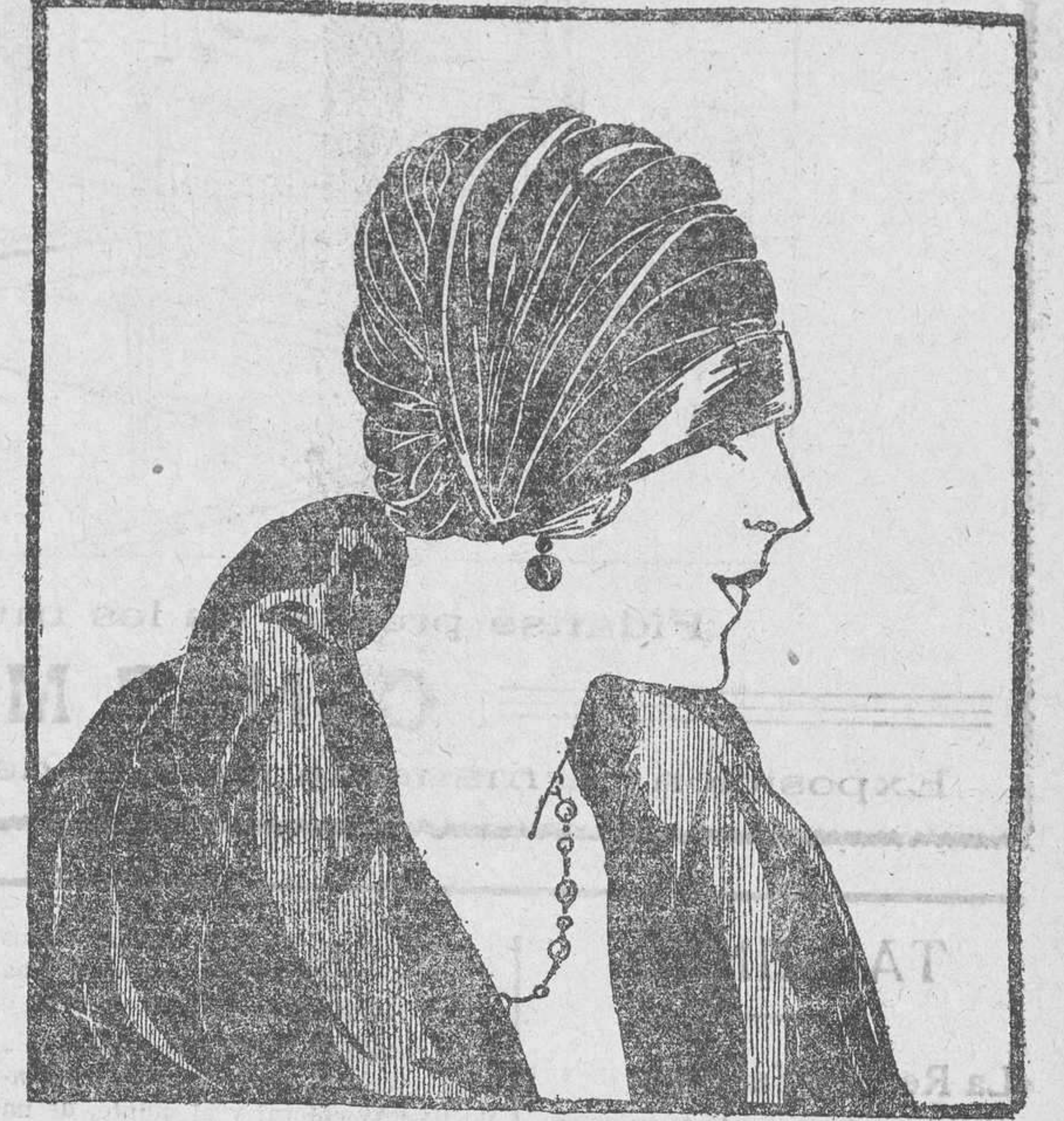
Pequeña forma revestida de satén castaño, con borde levantado por delante, y dibujando un movimiento de tiara sobre la cabeza