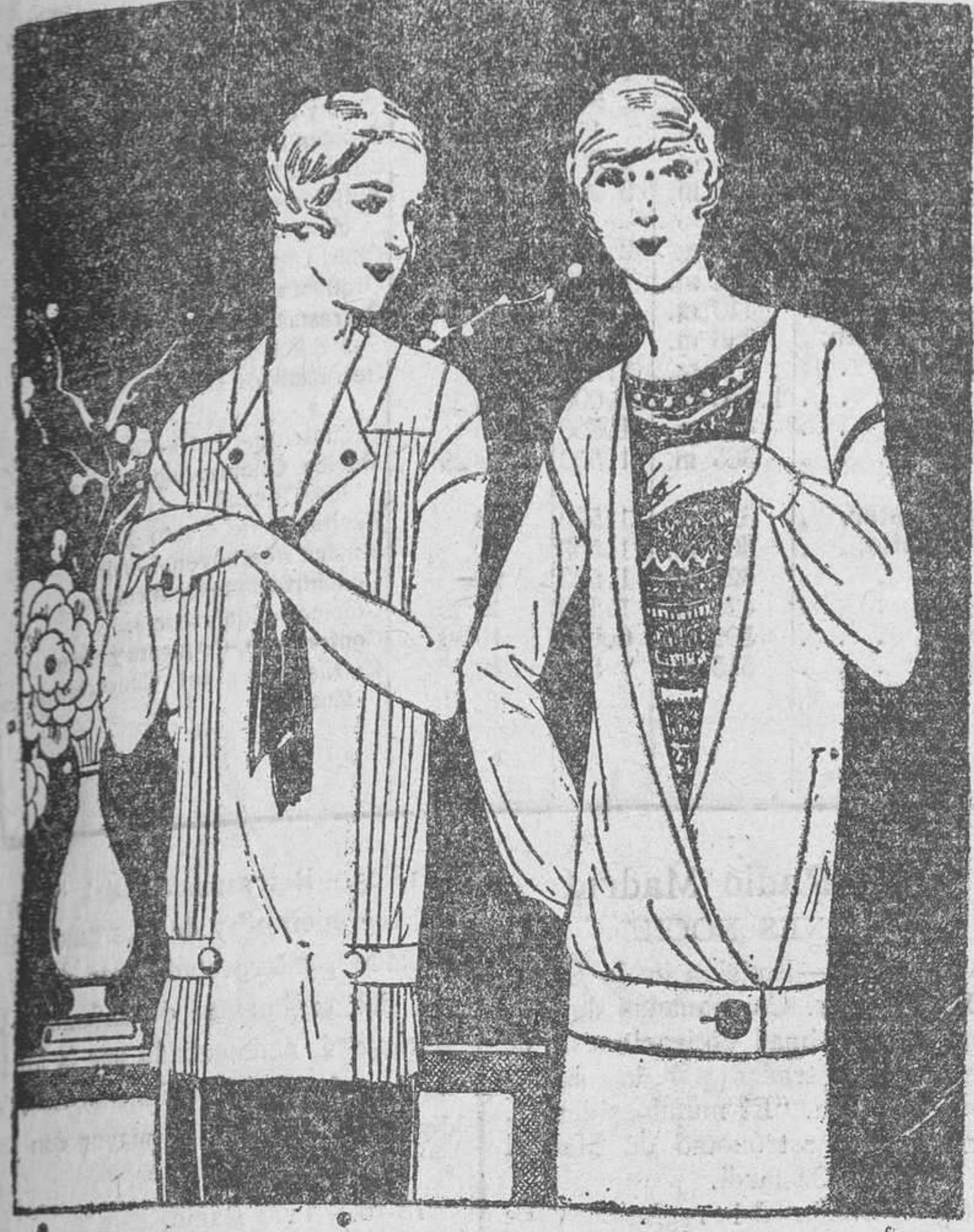
Casaca recta de crespón de China; corbata de cinta de encajes violeta Casaca de djersa unido, abierta sobre un djersa impreso