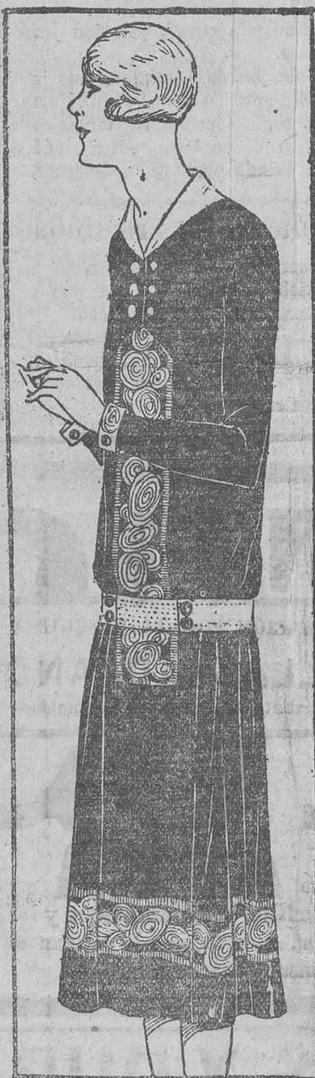
Traje de terciopelo de seda bordado de trencilla de oro; cinturón y cuello de piel dorada