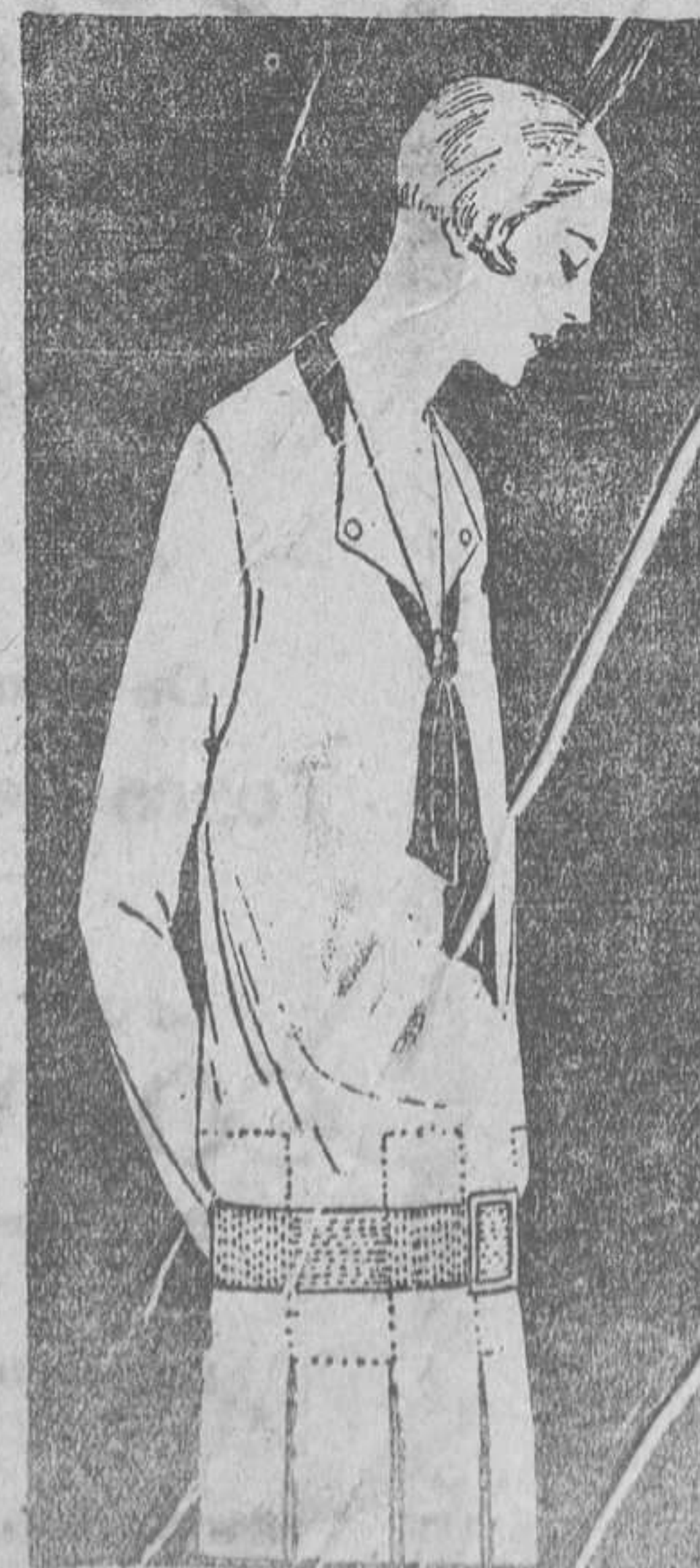
Traje de djersabiliana; cinturón de faja con picaduras; corbata de satén marrón.

Otra cosa. Soamente de hace veinte años a esta parte se ve en las calles de Seorel alguna mujer de la buena sociedad. Antigamente, solo después de las diez de la noche, les era permitido visitar a sus amigos. A esa hora, todos los hombres se retiraban a sus casas. En esa rara península no se considera que la oscuridad de la noche sea naturalmente indicada para el sueño. Todo el mundo va y viene, trabaja, o duerme a la hora que quiere. Los propios niños no están sujetos a regla alguna, ni siquiera tienen camas y se los ve, como si fuesen pollos, dormidos en cualquier sitio y en cualquier momento.