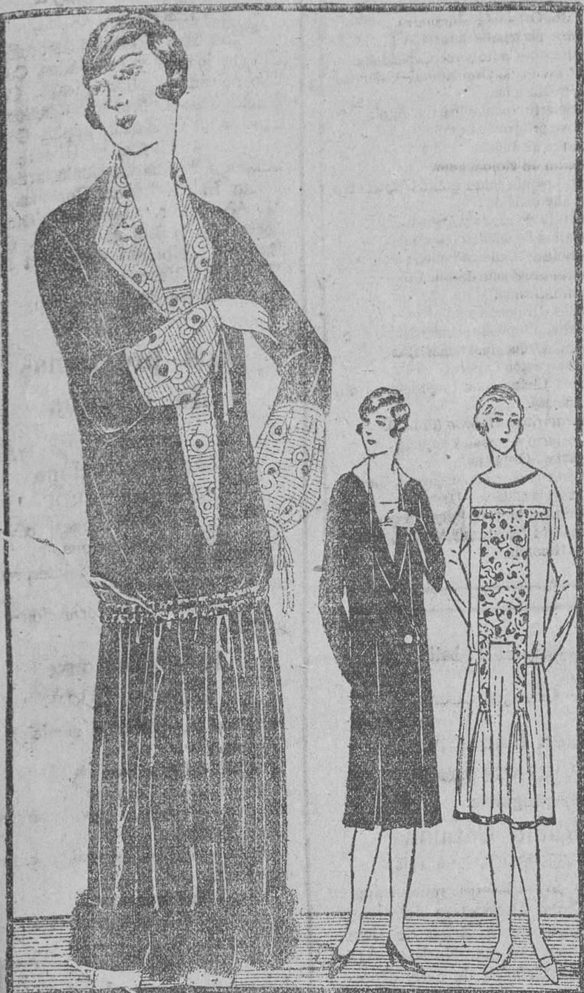
Traje de «paneclo» oliva iluminado de crepe estampado y bordado de pieles. Traje de «drapella» ciruela, abierto sobre un chaleco de crepe marfil. Traje de crepe «majunga» liso, limón y crepe «majunga» estampado.