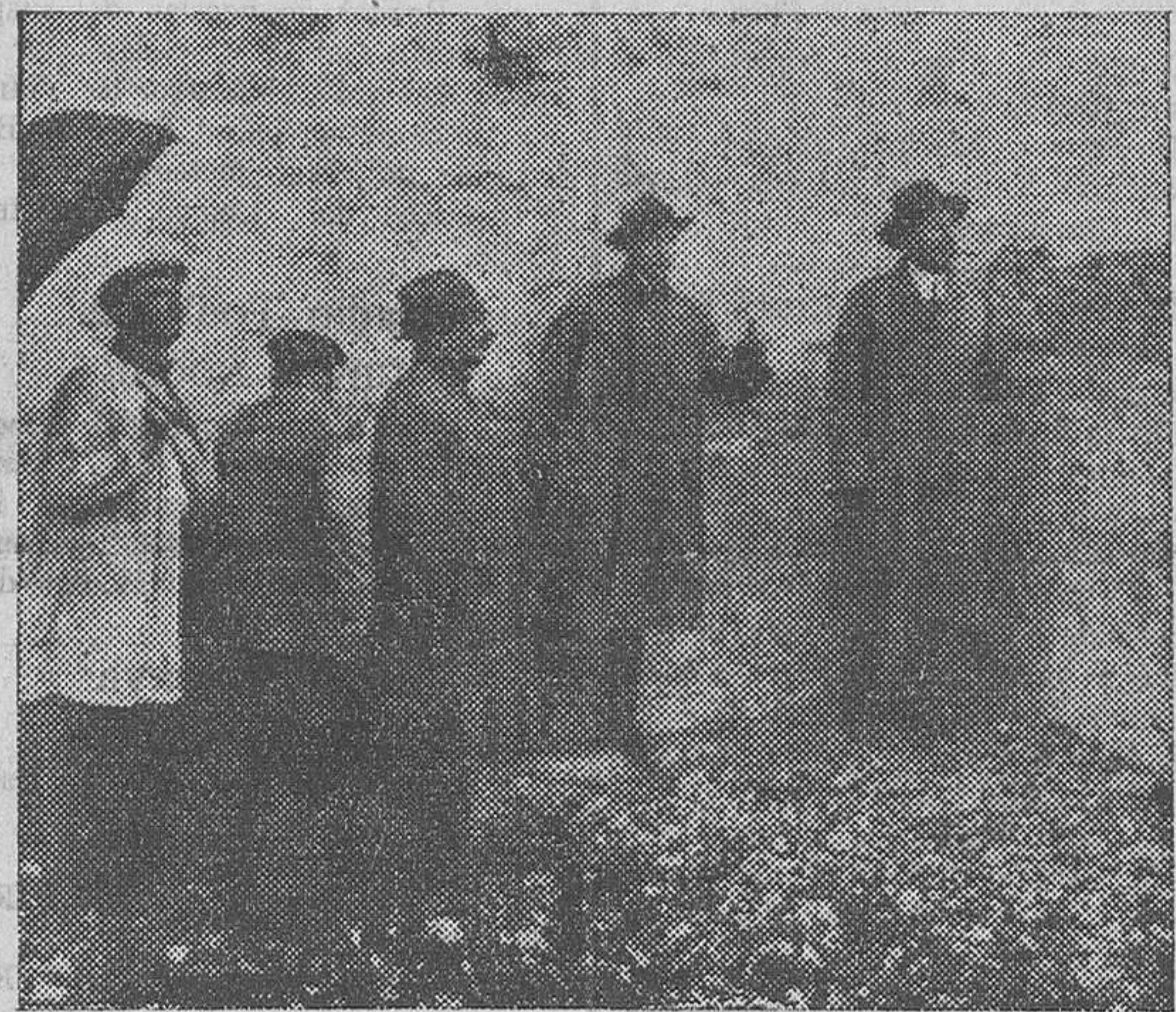
Los ingenieros observando los cables de salida del transformador de la Electra

Una vez verificadas las diligencias, a las seis próximamente de la mañana ha regresado la autoridad judicial a su local.