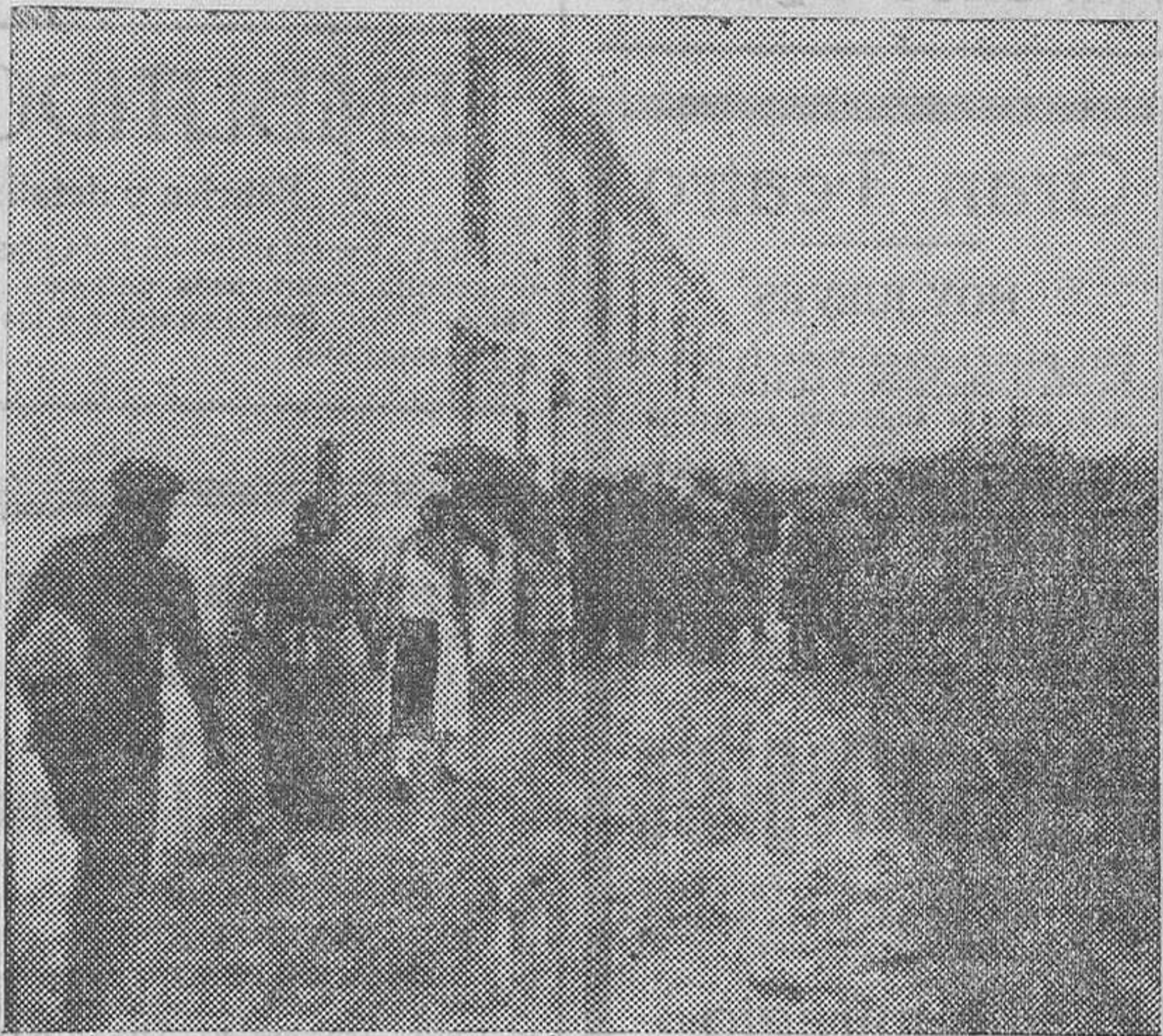
"Barrio de Perolets", donde ha ocurrido la otra desgracia

Quemaduras de segundo y tercer grados en la región glútea izquierda, en toda su extensión, cara plantar pie izquierdo y tercio inferior y derecho superior y codo izquierdo. Pronóstico grave.