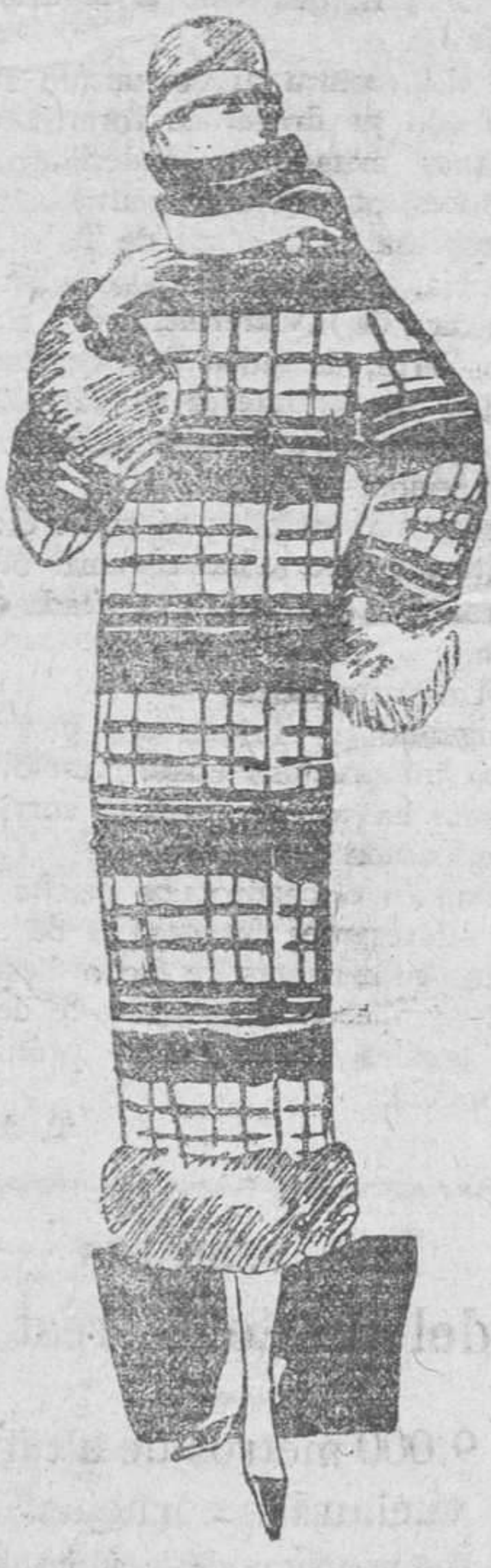
Abrigo de terciopelo combinado de "Smirna", muy elogiado en la costa azul.

Bucarest.—El misterio que hace cerca de nueve años ha rodeado la muerte de la Reina madre Isabel de Rumania comienza a aclararse. La Reina madre, que tenía reputación mundial de escritora, bajo el seudónimo de "Carmen Sylva", murió en 1916 en un castillo rumano durante la ocupación alemana. Atacada súbitamente de neumonía, falleció al cabo de algunas horas. Esta explicación no era más que parcialmente verídica. Los hechos reales han podido establecerse gracias a las declaraciones de criados de la corte que fueron testigos de la circunstancia que originó la muerte. En 1913, "Carmen Sylva", que tenía 70 años, sufrió una operación de cataratas. Perdió la vista. Desde aquel punto la Reina cayó en una rieleancolia profunda. Además, exasperada por la dominación alemana, decidió poner término a sus días. A fin de febrero de 1916, una noche sumamente fría la Reina madre tomó un baño lo más caliente que era posible. Después despidió a todos sus criados y séquito, y muy ligeramente vestida permaneció ante una ventana abierta, expuesta al aire glacial de los Alpes de Transilvania. Cuatro días más tarde moría con la sonrisa en los labios.