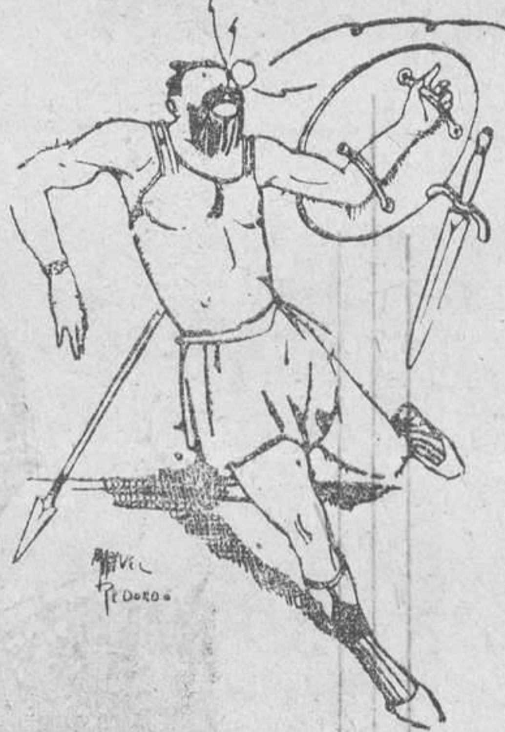
El gigante Goliat, primer receptor de los perniciosos efectos de la onda. Dib. de Manuel Redondo. (De "Muchas Gracias").