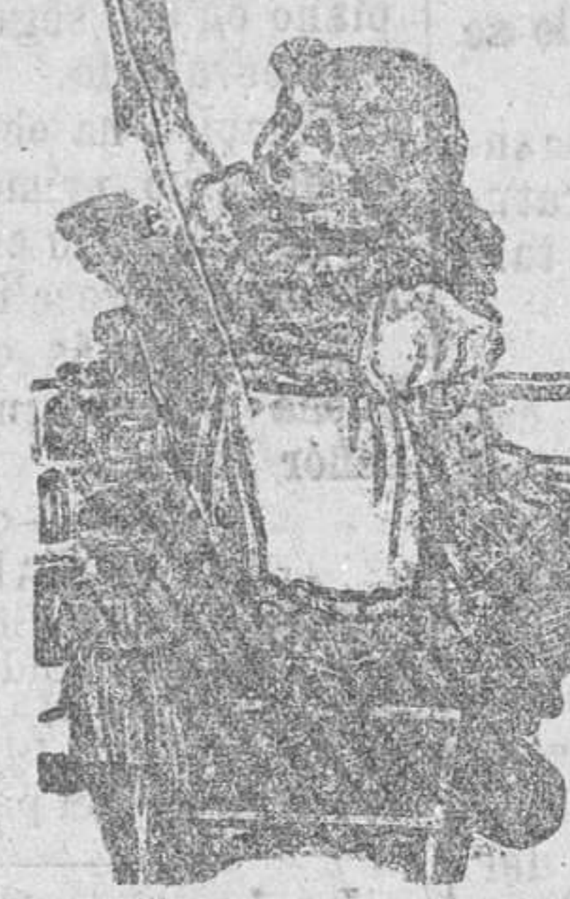
Caja-estuche una peseta